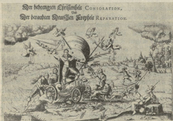
Allegooriline pilt Gustav Adolfist kui kristluse ja Saksa vabaduse päästjast. (Kaasaegne vaselõige.)

rindel korraga: kimbutada keisri püruksmaid ja rünnata katoliikliku liiga maid Edela-Saksamaal Reini ja Maini ääres. Saksi kuurvürsti soov oli, et Gustav Adolf tungiks keisri püruksmaadesse ja jätaks tema hooleks protestantide avitamise Edela-Saksamaal. Gustav Adolphi arvamus oli vastupidine ja see pääsis maksvusele. Saksilased tungisid Böömimaale ja Gustav Adolf ise liikus oma vägedega üle Thüringeriwaldi edelasse katoliiklikesse piiskopkondadesse,