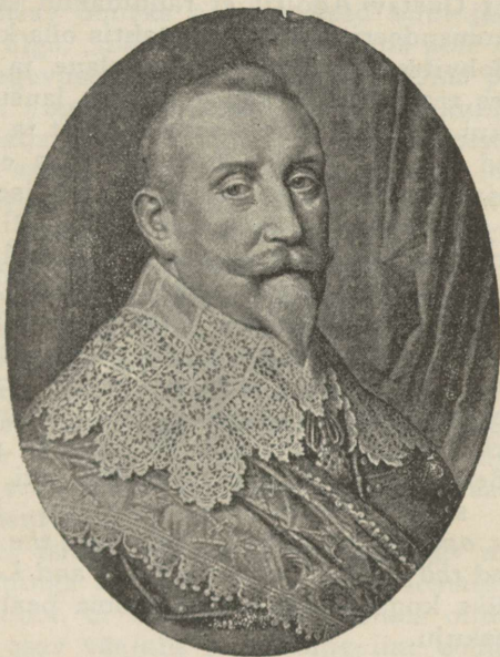
Gustav II Adolf.

veteraanid pidid alla vanduma rootslaste tapvale tule- ja ründetehnikale. Väejuhina ning strateegina jäi kuningas siiski alati väga ettevaatlikuks ja kaaluvaks. Lahingustrateegia pooldajana ei taotelnud ta välivõitlusi siiski mitte alati, vaid ainult juhul, kui võit näis enamvähem kindel või kui lahendus oli saavutatav ainult otsustavas