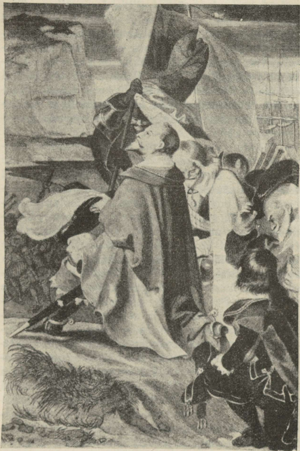
Gustav Adolf maandub Rügenil 1630. a. suvel.