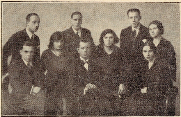
Juhatus 1931. a.