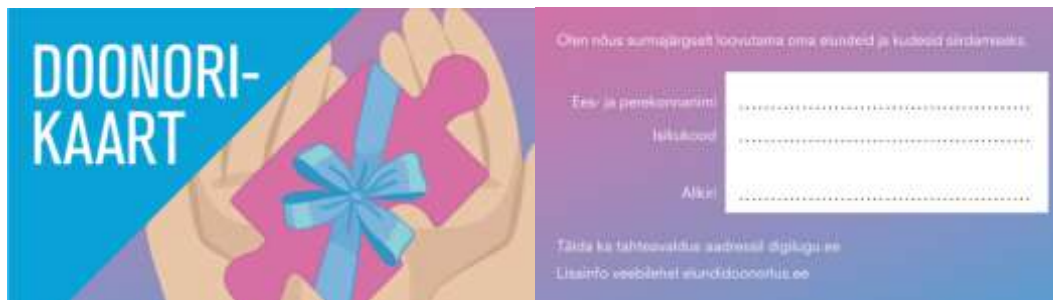
Illustratsioon 1: Eesti doonorikaart paberkujul

Siirdamise temaatika arendamiseks on „Rakkude, kudede ja elundite hankimise, käitlemise ja siirdamise seadusega“ (2020) moodustatud Eestis nõuandev organ Siirdamisinõukogu, mis on seadnud doonorluse ja siirdamise valdkonna strateegilised eesmärgid aastateks 2020–2023 1 ja kus muuhulgas on sõnastatud: