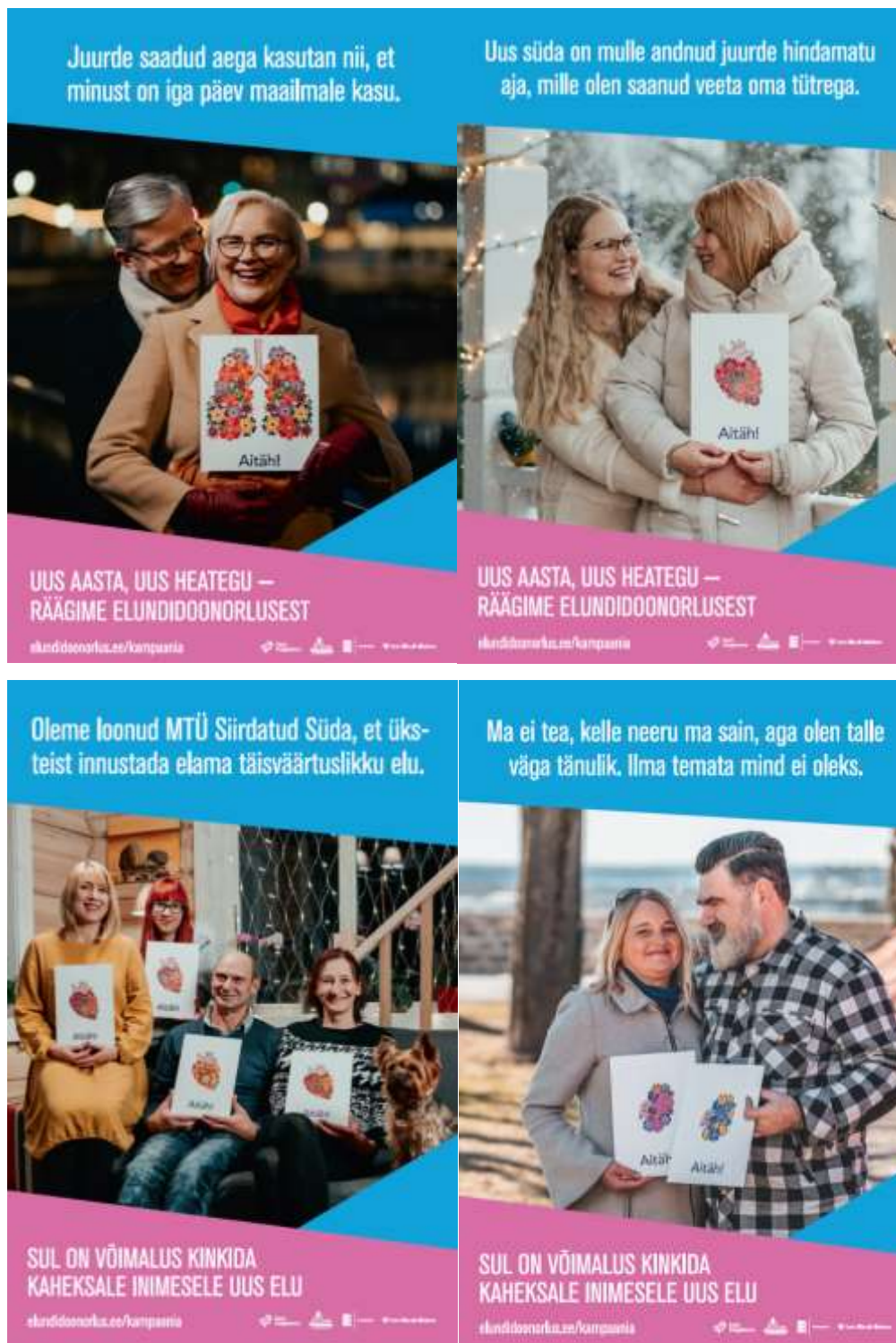
Illustratsioon 2: Kampaania plakatid

Kampaania ajal toimusid jaanuarikuus ka viis teemaõhtut Eesti erinevates linnades, kus esinesid kampaania kõneisikutena nii patsiendid kui ka valdkonnaga igapäevaselt kokku puutuvad arstid ja teised meditsiinitöötajad. Ülevaade teemaõhtutest on leitav lisadest (Lisa 2).