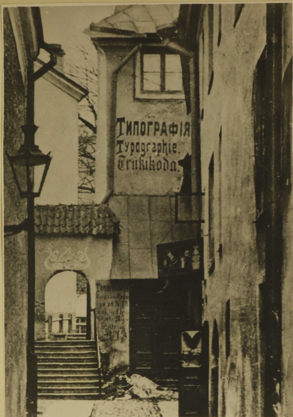
Foto n. 2. „Teataja” toimetuse asukoht Tallinnas Niguliste t. 13.