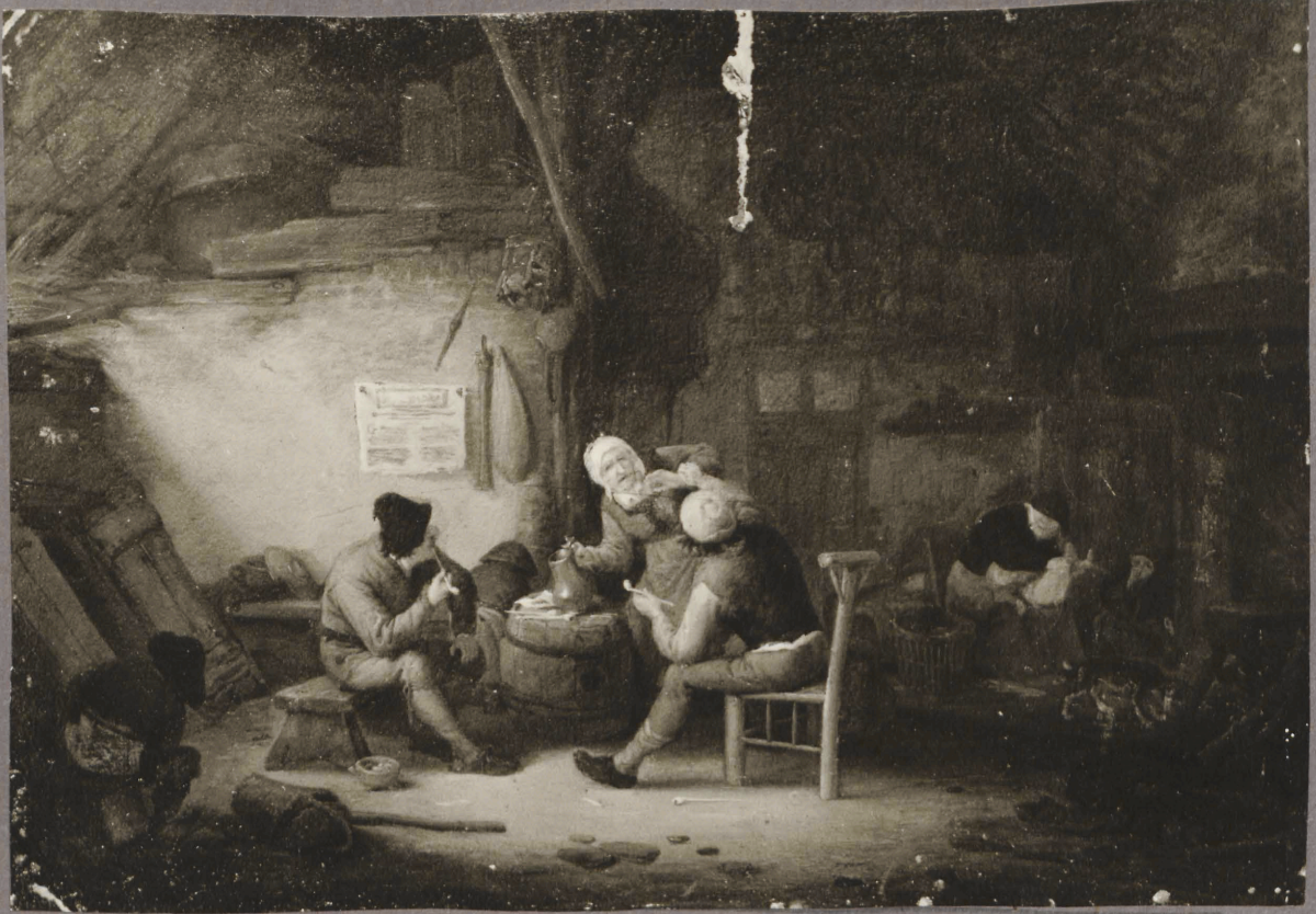
24. A. van Ostade? Riid