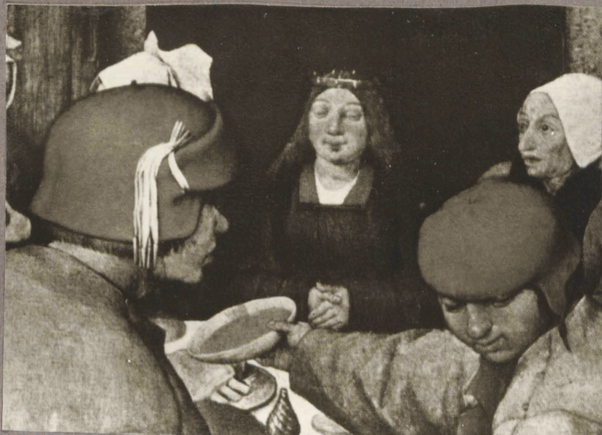
8. P. Brueghel vanem. Talupoja pulm. Detail