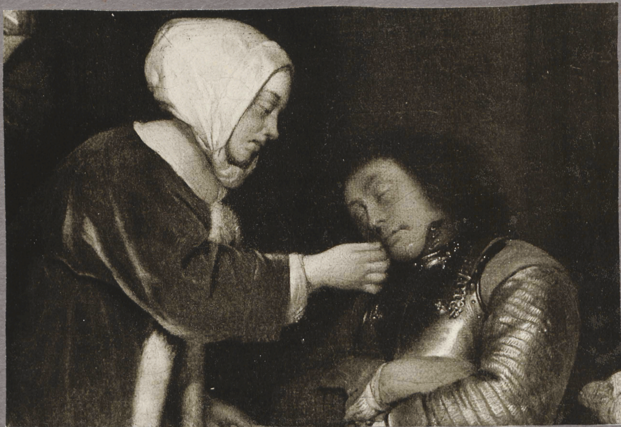
31. g. Terborch? Kiri magavale södurile detail