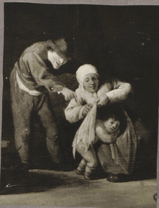
23. A. Brouwer. Perenonastseen. Detail