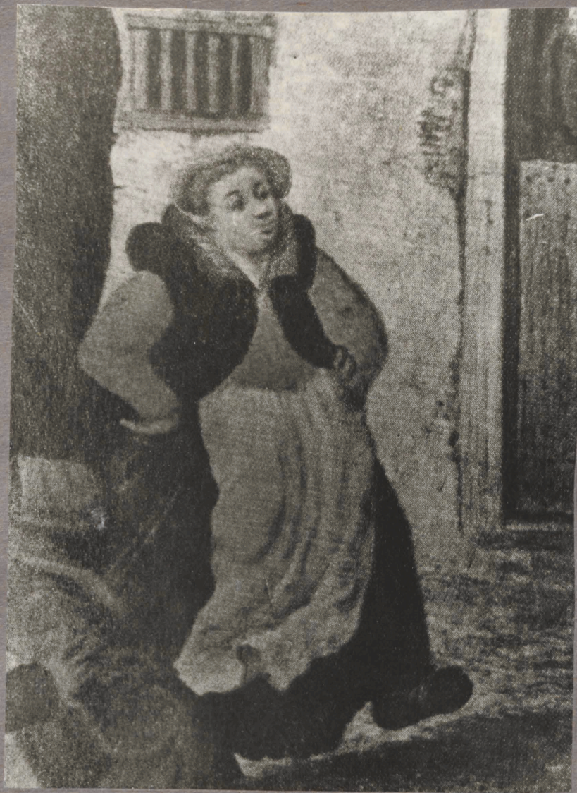
16. D. Vincubocus. Lōbus seltsuond. Detail