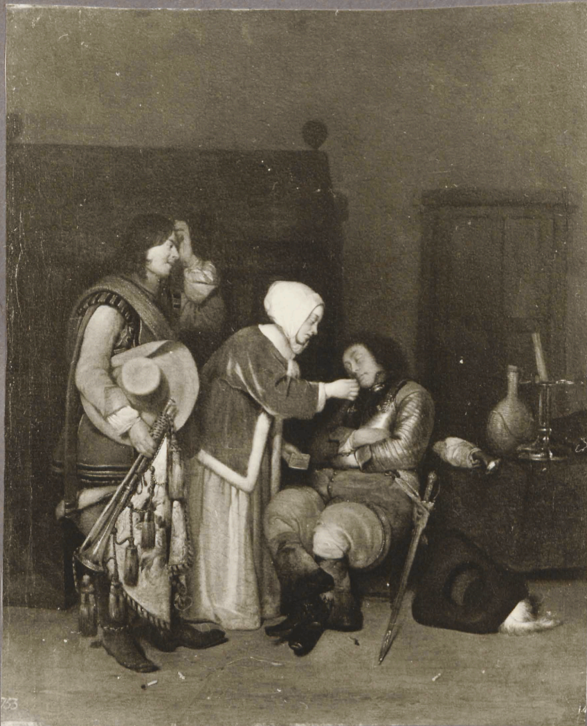
29. g. Terborck? Kiri magavale o Edurele.