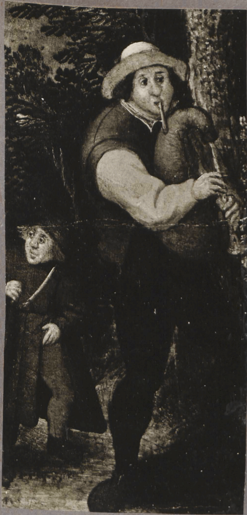
9. P. Brueghel nooema mõjukond. Pruudi saatsine. Detail