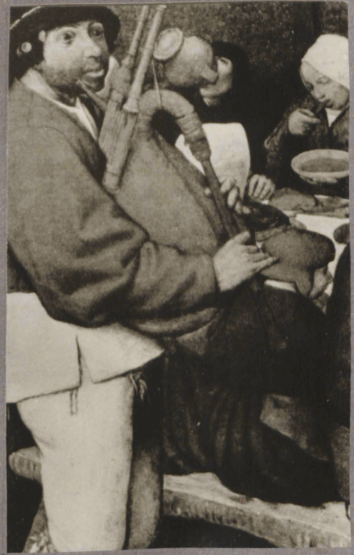
10. P. Brueghel vaem. Talupoja pülm. Detail