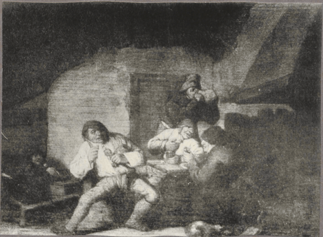
25. A. victoyns. Talumehed joomas