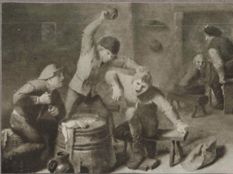
21. a. Broumer. Talupoegade kakelus.