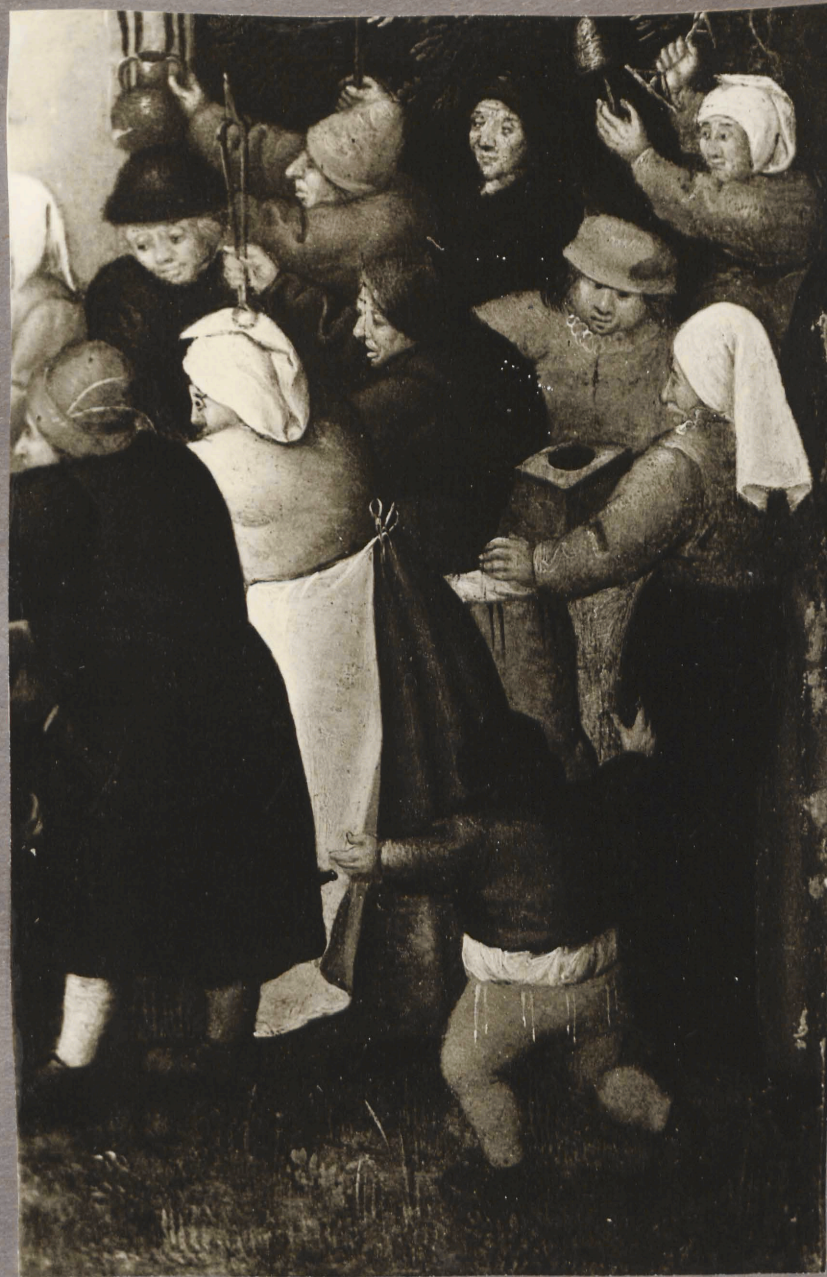
6. P. Brueghel noorema mõpukond. Pul mõpideu. Detail