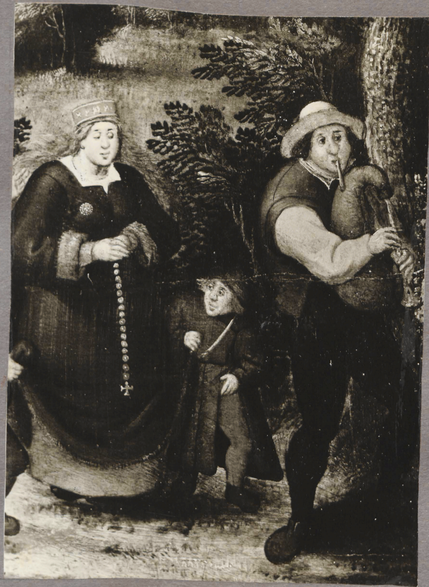
15. P. Bruegel van ouders' nōjenssel. Pruudi oostmisse. Detail