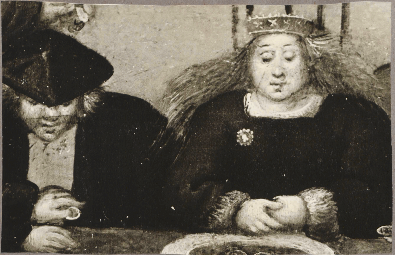
7. P. Brueghel noorema nõiukond. Pulmapüde. Detail