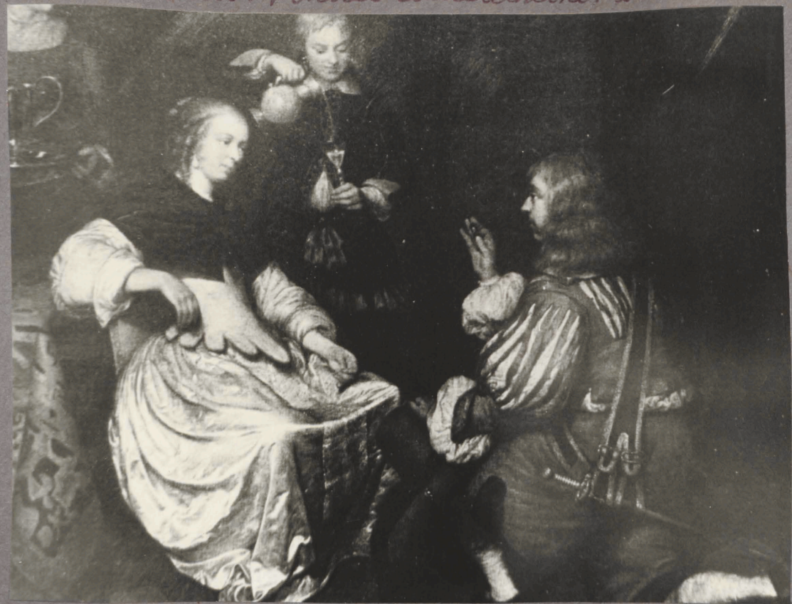
34. C. Metscher. Portret iislandnime. Detail