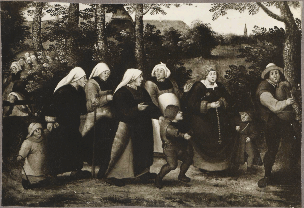
1. P. Brueghel, noorema nõiukond. Priiuidi saatmine