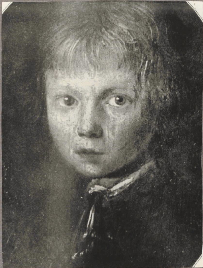
38. J. Dou. Poiss.