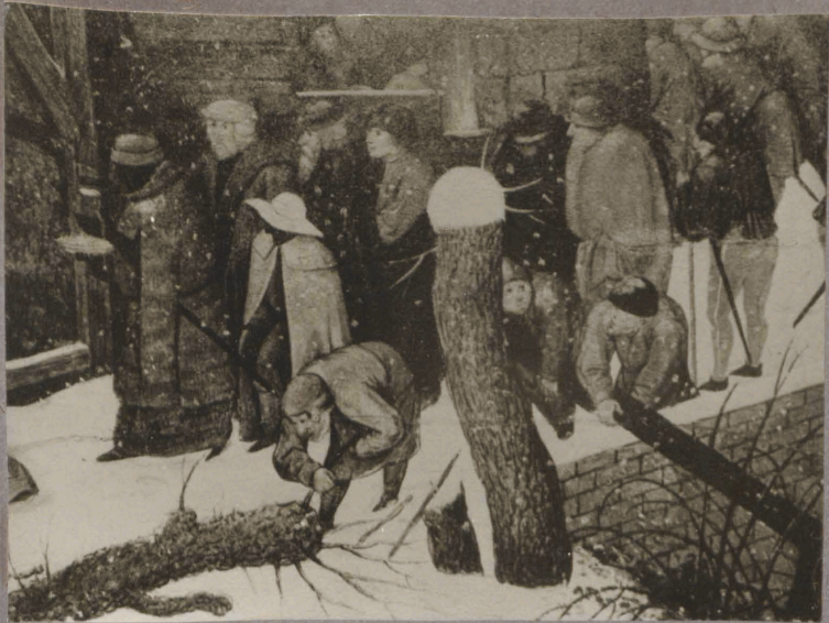
12. P. Brueghel noorem. Tänavade kummardamine