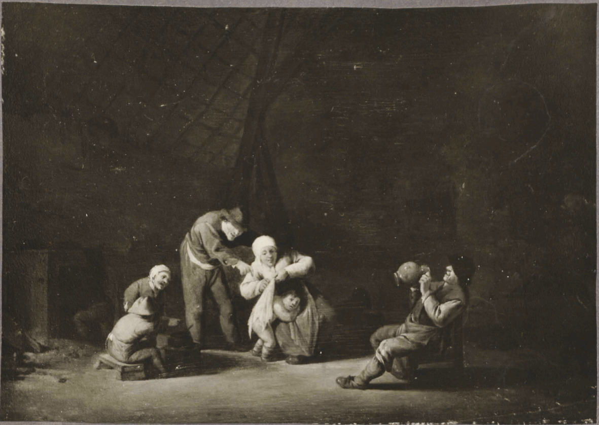
20. a. Broumer? Pere konnaastsen