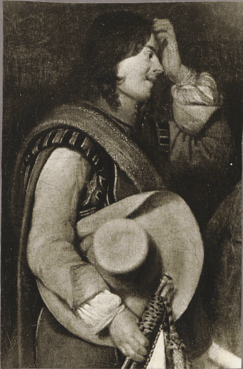
30. g. Terborch? Hiri maganale o duri le. Detail