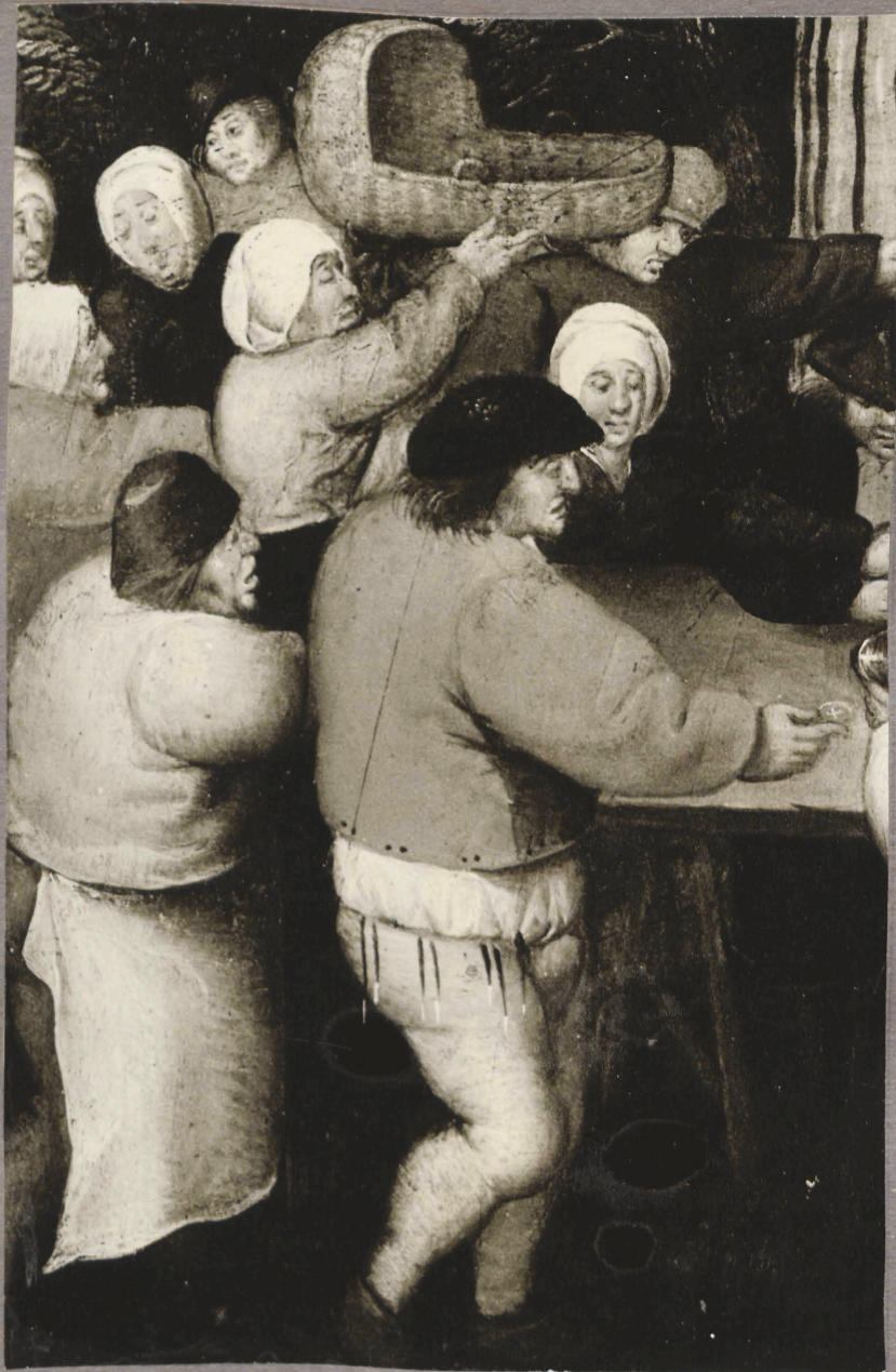
5. P. Brueghel noorema mõpukond. Pul mõpideu. Detail.