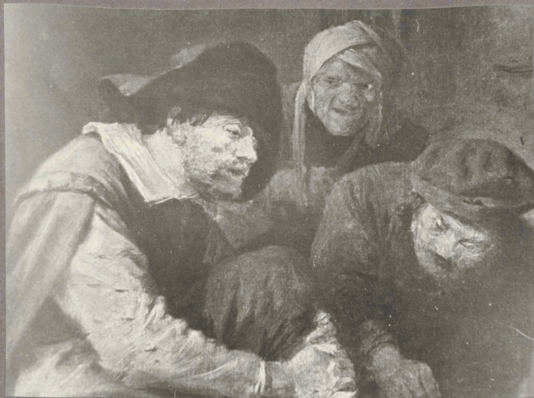
22. A. Brouwer. Jala operatsioon