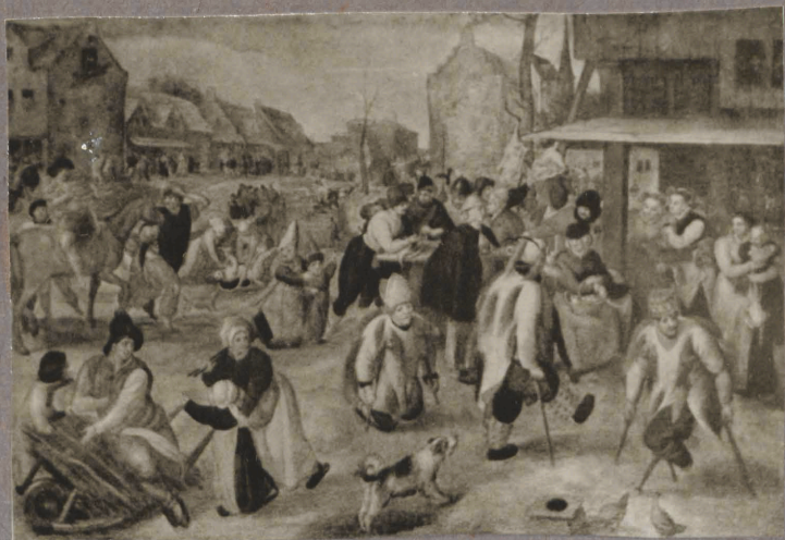
13. M. van Cleve. Piika Martini pidu