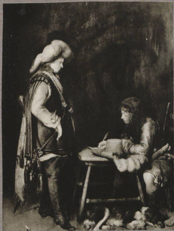
33. g. Teborch. Kiija kirjutar ohvitser