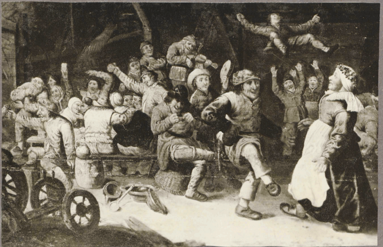
28. Tunduratu 17. sajandi lõpu hollandi kunstnik. Talupeegade pidu. Detall