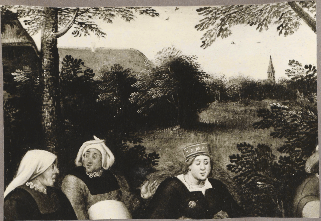
3. P. Brueghel noorema mõjuskond. Pruudi saadmine. Detail