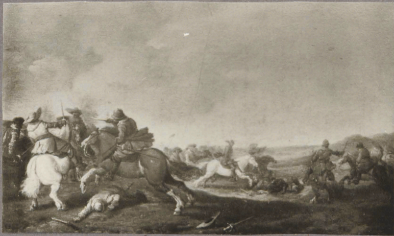
18. P. Palamedes & varem. Daking.