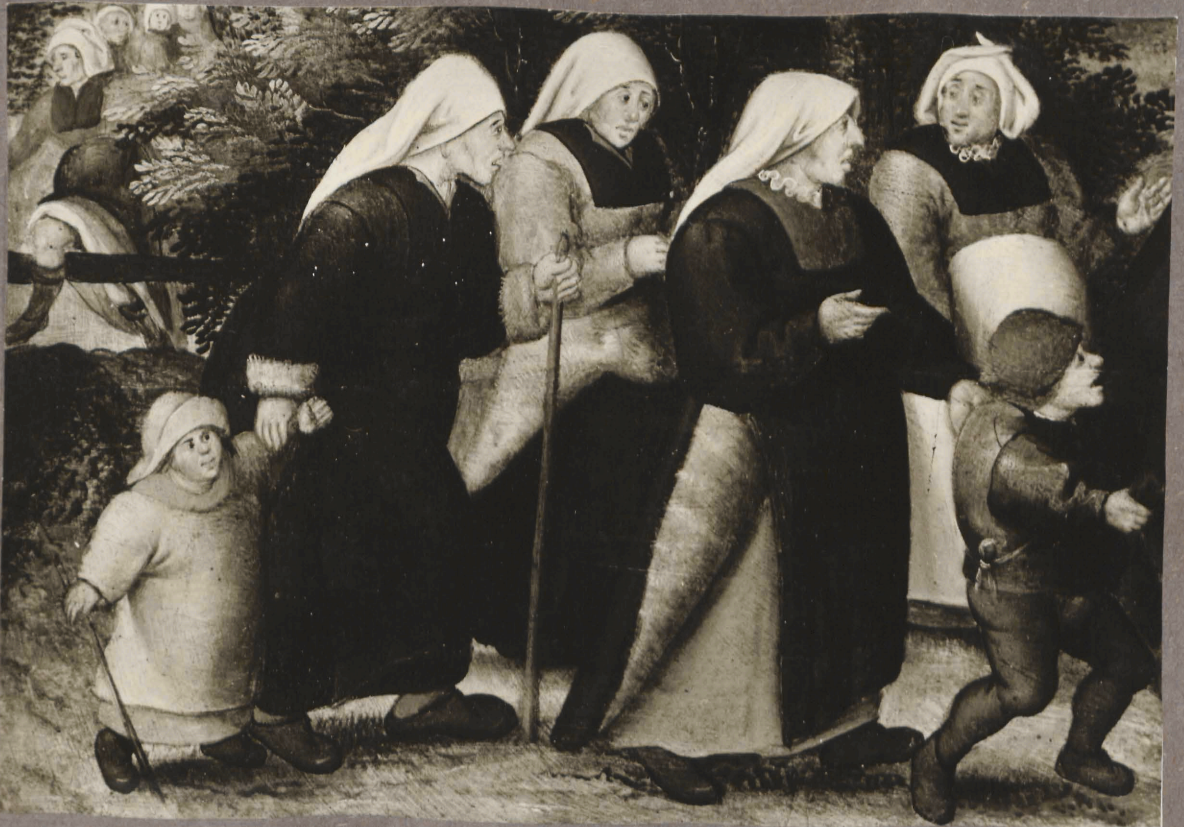
2. P. Brueghel noorema nõiukond. Priiuidi saatmine detail