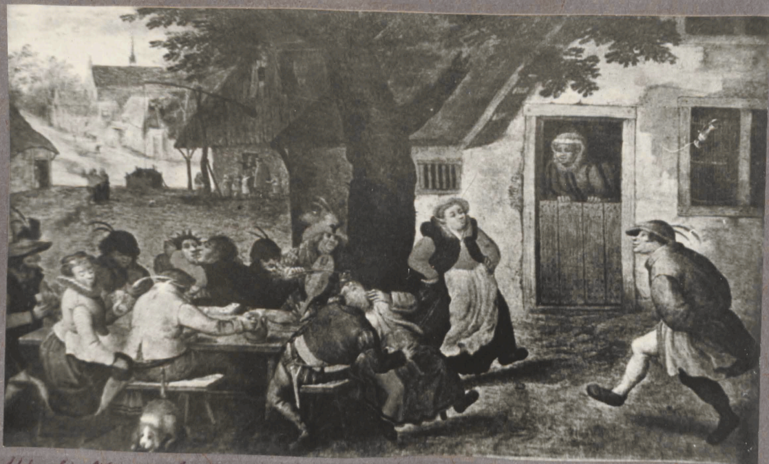
14. L. Wincboons. Lötus aeltoond