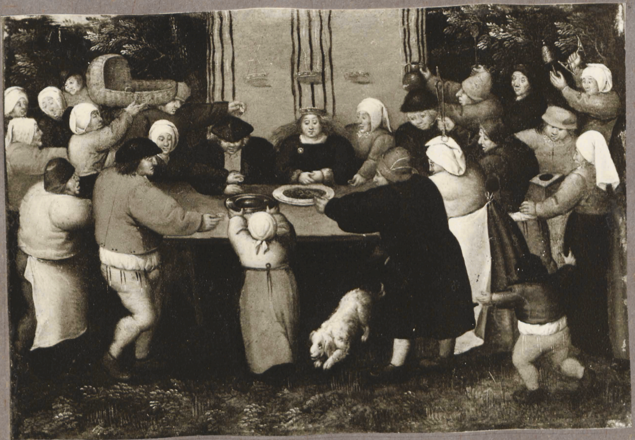
4. P. Brueghel noorema mõjuskond. Püenapööde. Detail