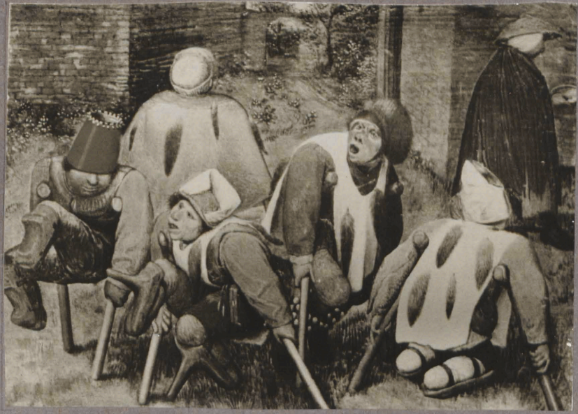
11. P. Brueghel vaem. Sandid