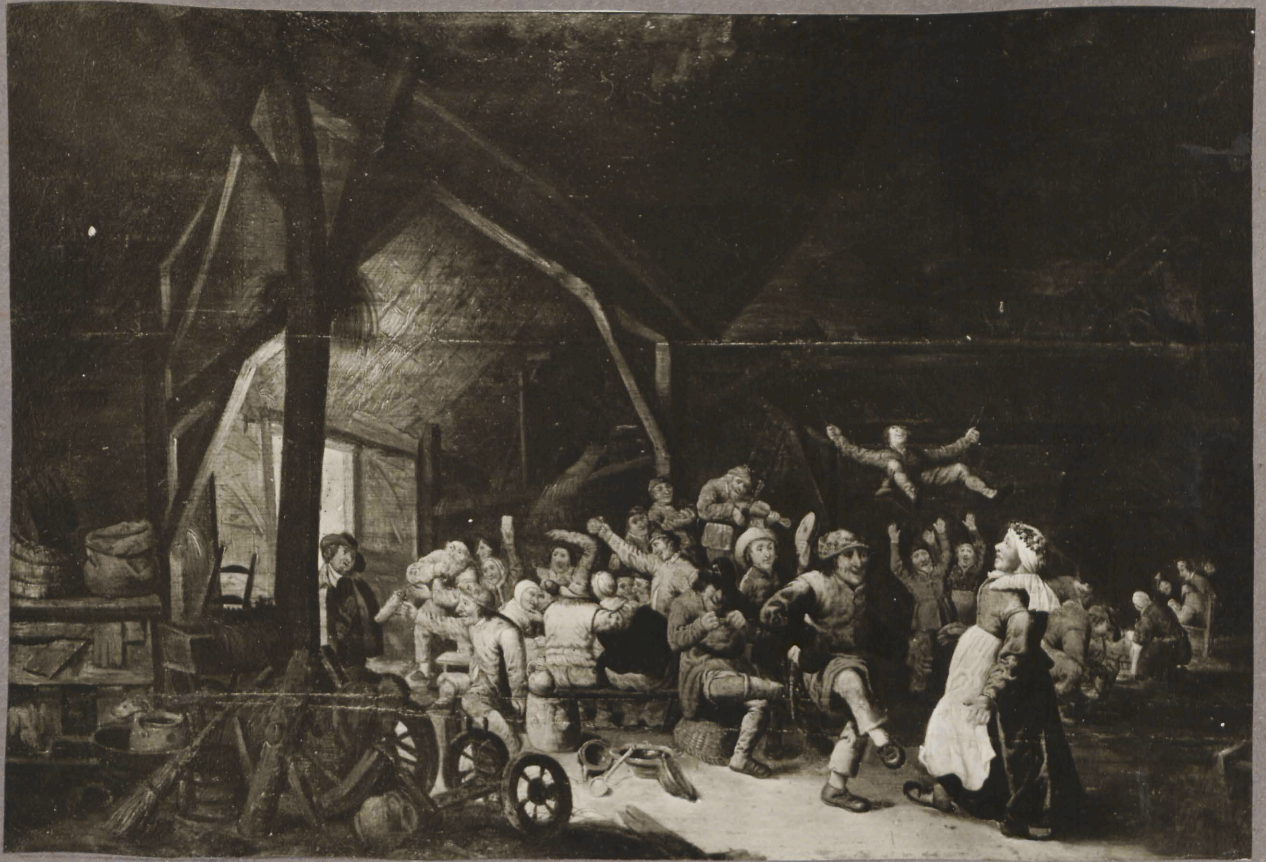
27. Tunduratu 17. saj. lõpu hollandi kunstnik. Talupeegade pidu