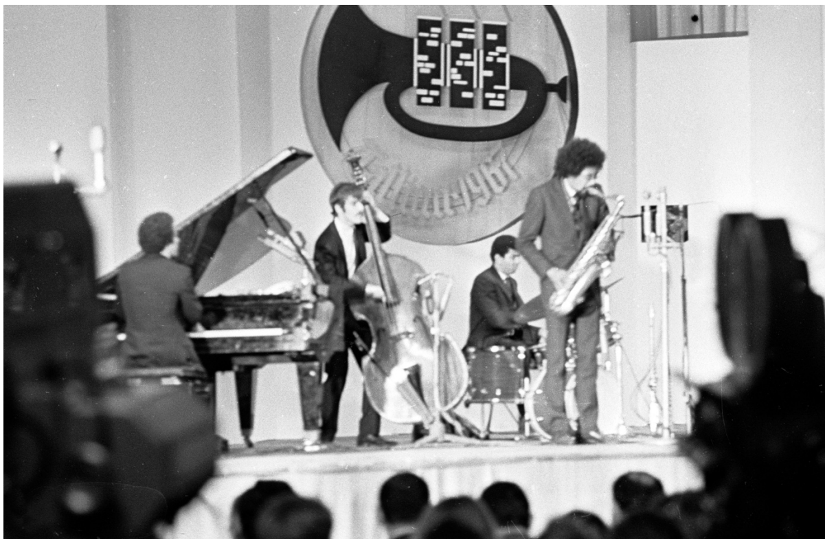
Foto 1. Jazzfestival Tallinn 1967., esineb Charles Lloyd.