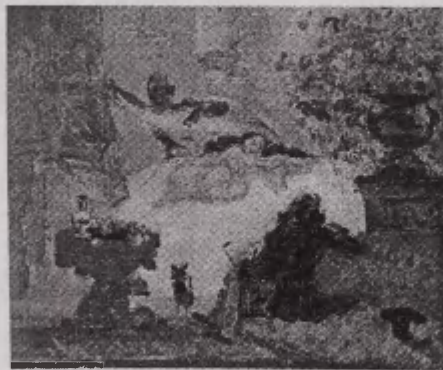
Joonis 2. Cézanne'i „Modernne Olympia”

M. de Montifaud, „L'Artiste”, 1. mai 1874