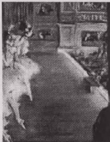
Joonis 5. Degas' „Balletiproov”

Ühest Émile Zola kirjutisest väljaande Le Sémaphore de Marseille 18. aprilli numbris 1874 saame teada, et Degas'l oli 1874. aasta näitusel vähemalt kaks tantsustseene kujutavat maali 11 . Samuti 1874. aasta aprillis dateeritud kirjas täpsustab ta: „Hr. Degas, kes on teiste hulgas välja pannud „Balletiproovi laval” ühe lõuendina, mis mulle muljet avaldasid.”