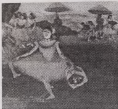
Joonis 3. Degas' „Tantsijanna”

Esiplaanil on tantsijanna, kahel pool tema kõrval figurandid, keegi punase salliga... ning asjad, mis võiksid hea tahtmise korral kuidagimoodi sarnaneda kübaratega... Pigem on need küll päikesevarjud, aga kes teab, inimese pilk, kes püüab kirjutada huvitavalt, võib ehk neid näha väga kummalisel viisil...?