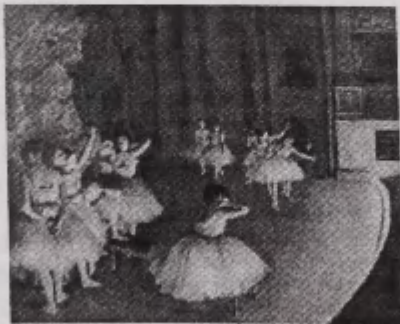
Joonis 4. „Operitantsijannad”

Esimene maal, millele ta kõigepealt mõtles, on toodud joonisel 4: