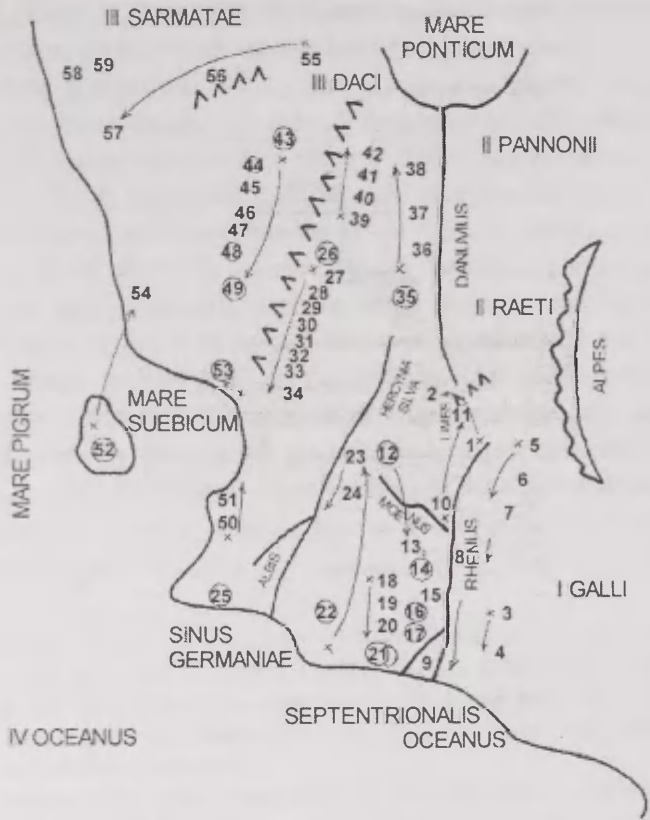
Joonis 1. Tacituse Germaania kaart.