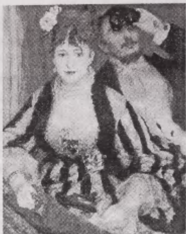
Joonis 1. Renoiri „Loož”

See kõrgemast seltskonnast võetud kuju on jäädvustatud lopsakasse värvikihti veidi karvaste pintslilöökidega. [...]