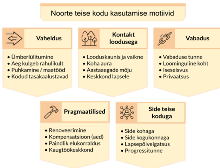
Joonis 2. Noorte teise kodu kasutamise motiivid (saadud kategoriseerimise käigus).