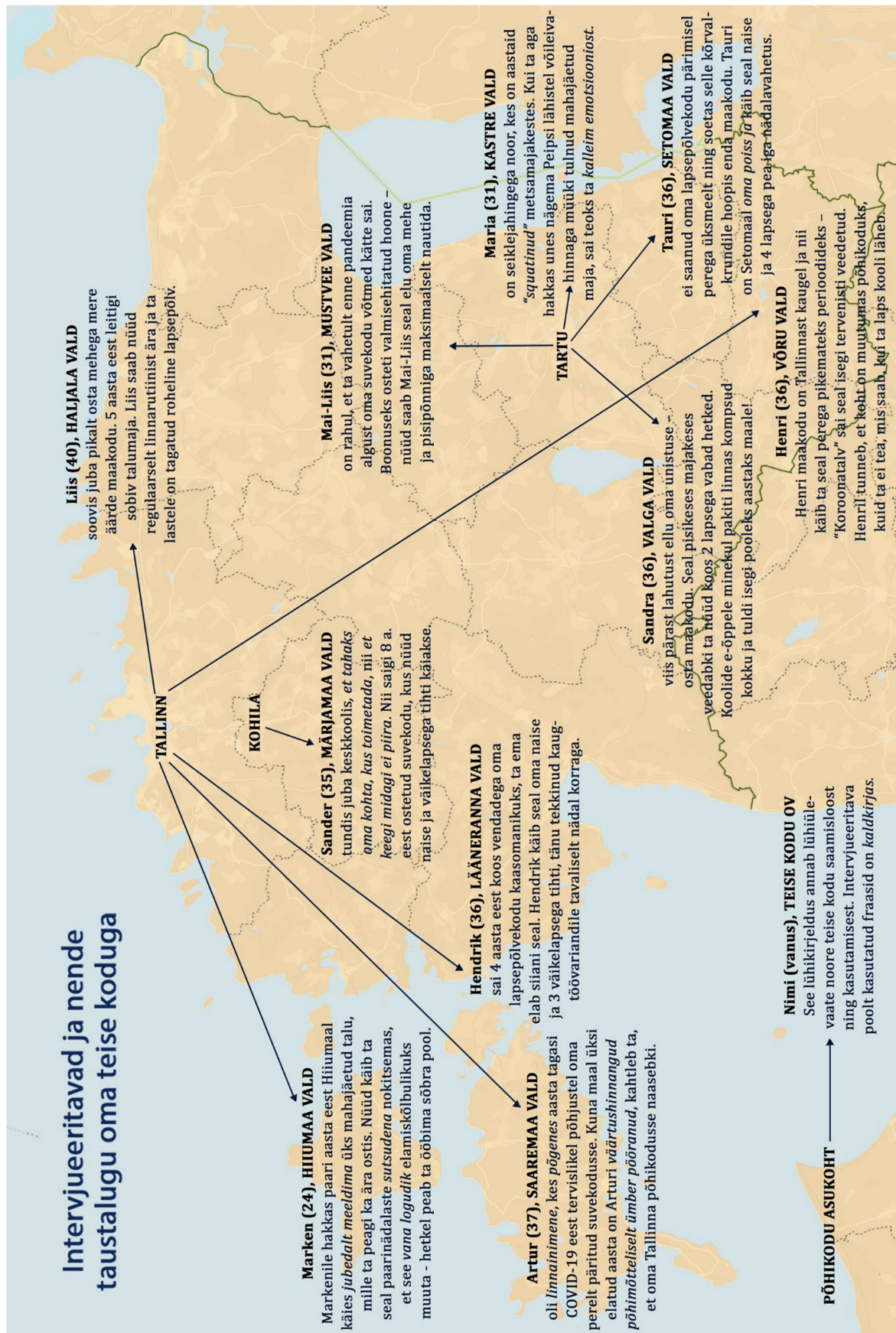
Joonis 1. Intervjuueeritavad ja nende taustalugu oma teise koduga.