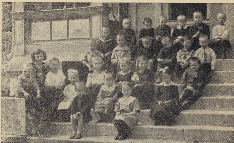
Wiljandi Cesti Naiseltsi 1922 a. talwine lasteaed.