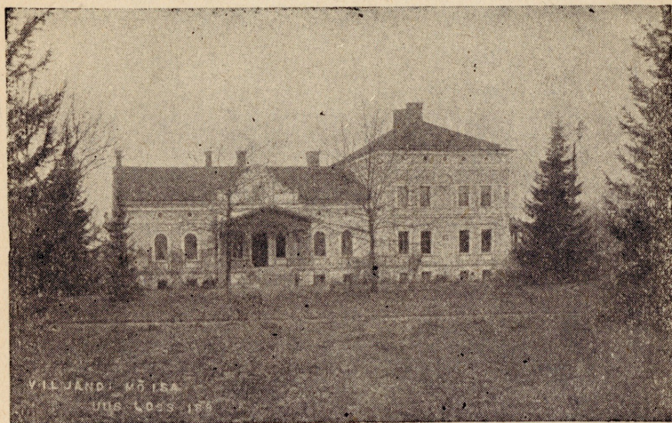
Wiljandi mõisa uus loos, kus asub Wiljandi Eesti Naisseltsi lasteaed.

Seitsmeliikmeline juhatus on ametid omavahel järgmiselt jaganud: