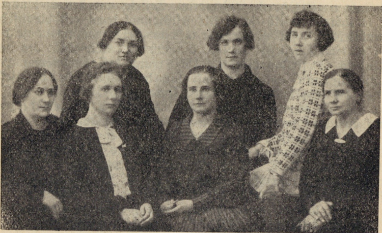
Wiljandi Eesti Naiseltsi 1925 ja 1926 a. juhatus.