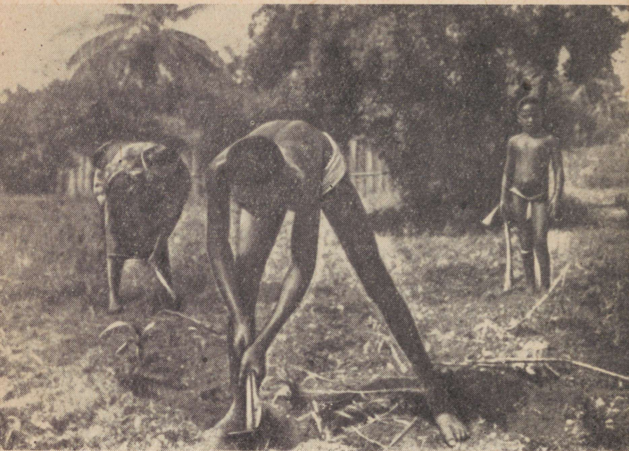
Põldu valmistatakse külviks ette

Kohalikud pealikud või külavanemate nõukogud jagavad maa üksikute, niinimetatud «suurperede» — isapoolsete sugulaste vahel.