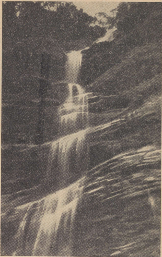
Kosk Togo mägedes

maperioodil aga muutuvad nad sogasteks ja vahutavateks veevooludeks, tulevad üle kallaste ja ujutavad üle suuri maa-alasid.