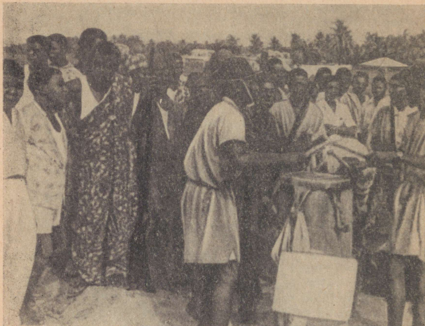
Trummilööjad sõdurid sõltumatusepäeva pidustustel

mad või pealikud. Rajoone ja mõningaid ringkondi juhivad feodaalse ja sugukondliku aristokraatia esindajad. Nelja provintsi eesotsas seisavad prantsuse ametnike asemel togolastest inspektorid.