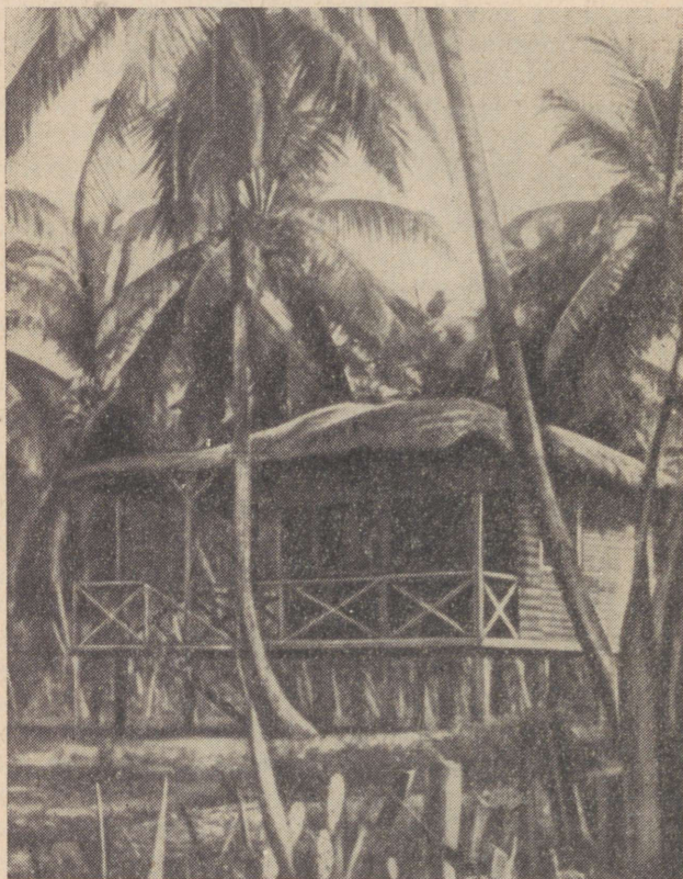
Kookospähklite korjaja onn

valmistatud kõrge piirdeaia ja õuega. Õuel asuvad viljahoidla, toiduvalmistamise lõukad ja mõnikord ka laut. Kõigil Togos elavatel rahvastel ja suguharudel täidab viljahoidla aset koonusetaolise katusega savisilinder, mille kõrgus on 2—2,5 meetrit, läbimõõt ligi 1,5 meetrit. Õuele kaevavad eved mitu väikest basseini, kus kuival aastaajal säilitatakse vett. Nagu kõik teised Aafrika rahvad, nii on ka eved suured puhtuse armastajad. Nad pesevad endid mitu korda päevas, eriti hoolikalt pestakse end pärast tööd. Kui seepi ei ole (seepi veetakse sisse peamiselt Prant-