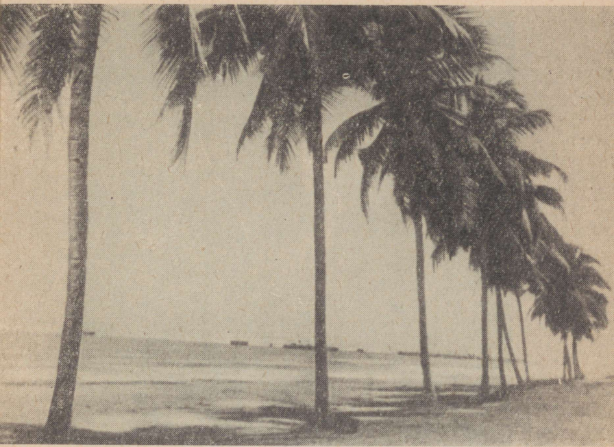
Ginea lahe rannikul

Ükski Togot külastanud turisi ei möödu ükskõikselt sellest looduse pärlist.