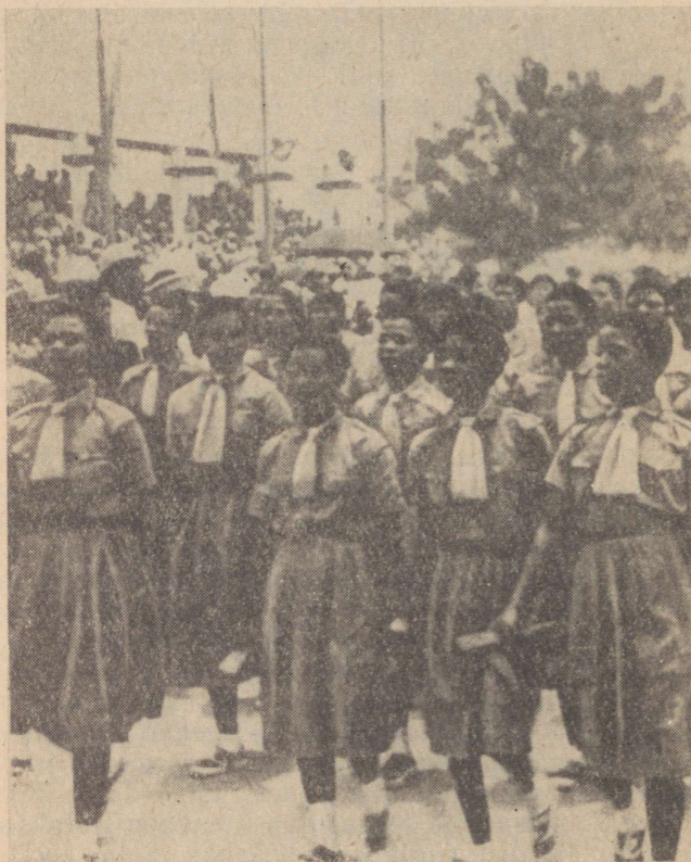
Togo noorus pidupäeval

Tuhanded inimesed olid sunnitud elatusvahendite leidmiseks rändama naabermaadesse, peamiselt Gaanasse.