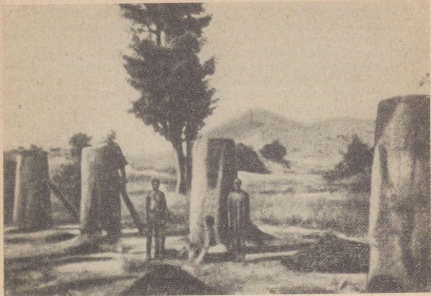
Raua sulatamine kodutöenduslikul teel

(750—900 tonni aastas), Be seebitehas (210 tonni majapidamisseepi aastas), koprakuivati ja Lomé piimatööstus.