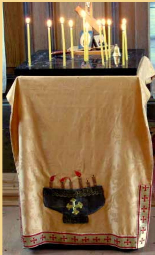
Tänapäevane surnutelaua lina. Autor: Epp Haabsaar

Minu magistratöö eesmärk on kirjeldada Lääne-Eesti, saarte, Pärnumaa ja Tallinna õigeusukiriku tekstiilide valmistamisel kasutatud tehnikaid, püüda hinnata nende vanust ja seisukorda.