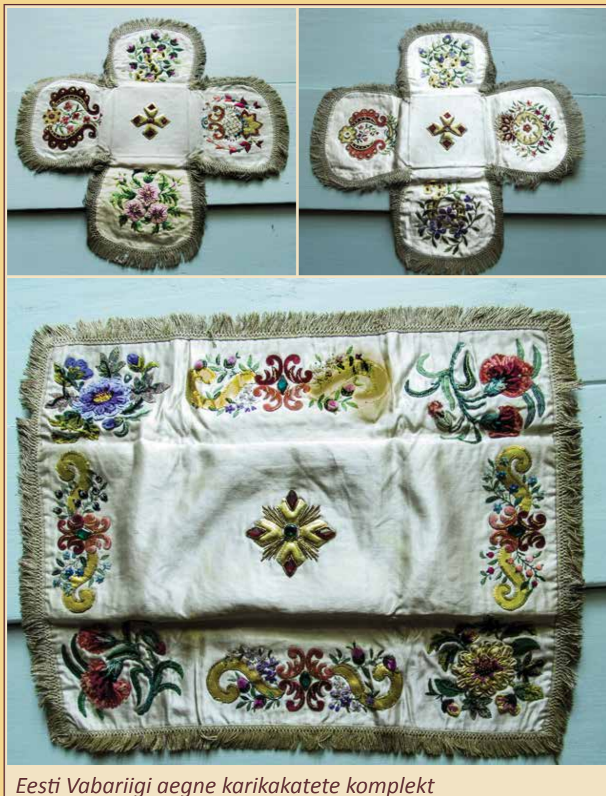
Eesti Vabariigi aegne karikakatete komplekt