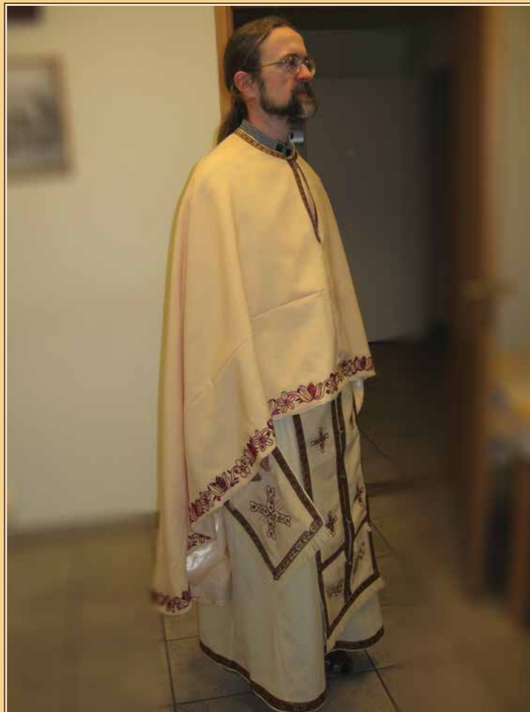
Tänapäevane rahvuslik tikandis preestrirüü komplekt. Autor: Madli Sepper

Õigeusukiriku tekstiilidel, eriti vaimulikurüü pisidetailidel on oma tähendus. Kirikutekstiilide ajaloolisest arengust ja tähendustest, sealhulgas liturgilistest värvidest on juttu magistratöö esimeses osas.