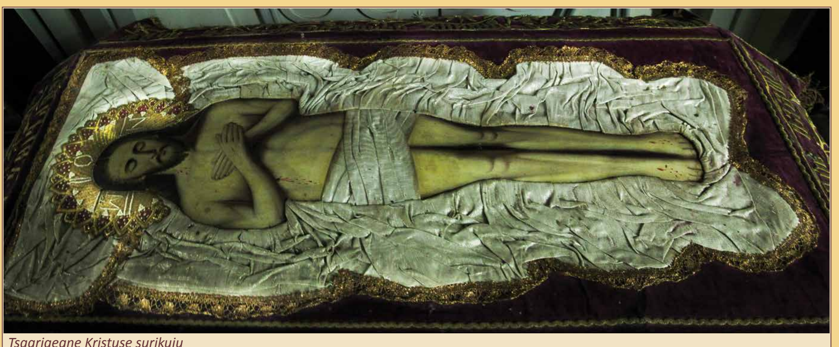
Tsaariaegne Kristuse surikuju