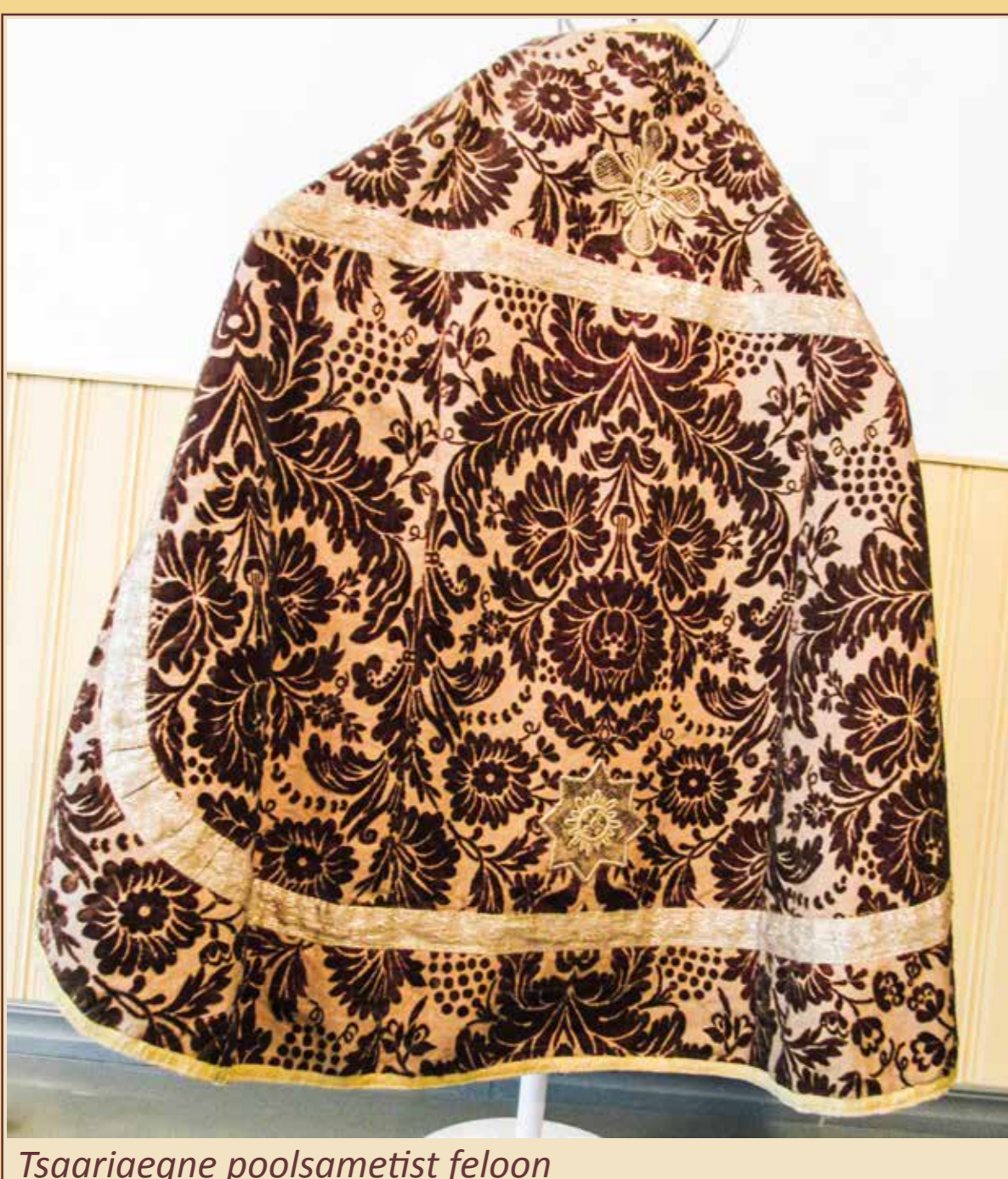
Tsaariaegne poolsametist feloon

Magistratöö viimases osas tutvustan ühe 20. saj alguse preestrirüü taastamisest kasutamiseks.