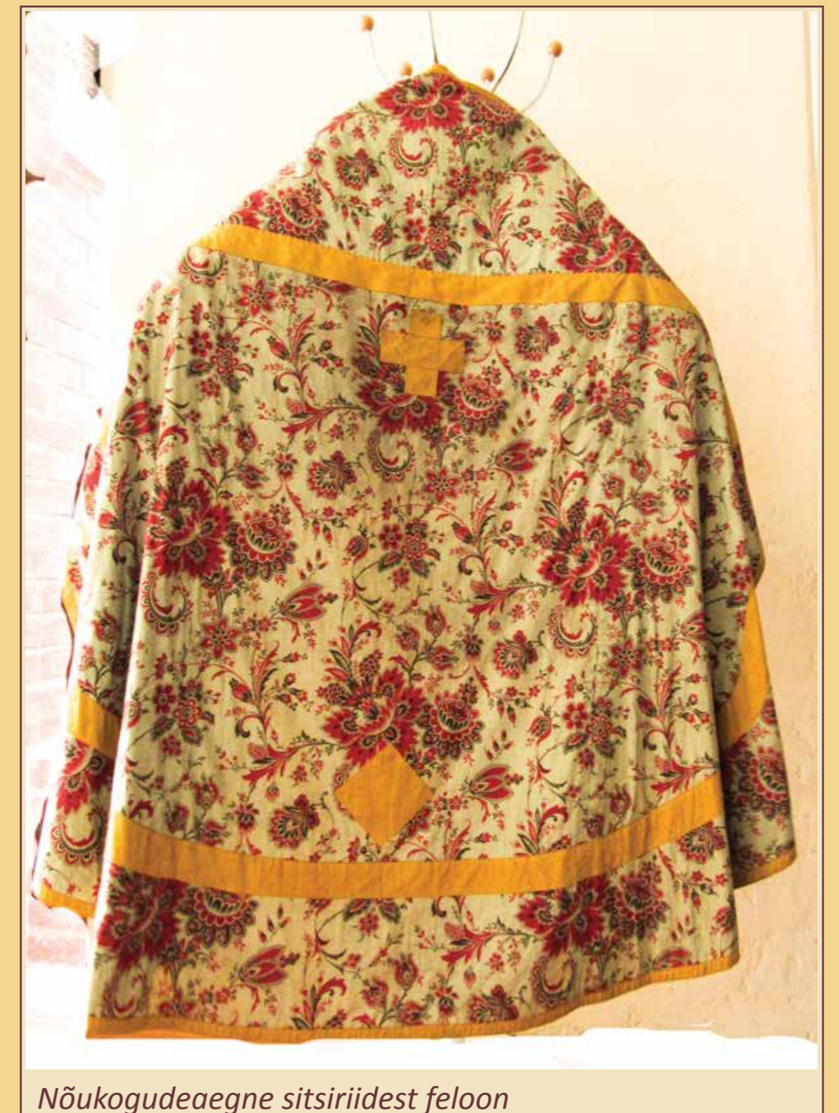
Nõukogudeaegne sitsiriidest feloon