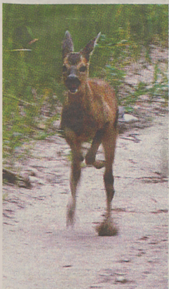
Känguru metsateel? Ei, hoopis eksinud kitsetall.