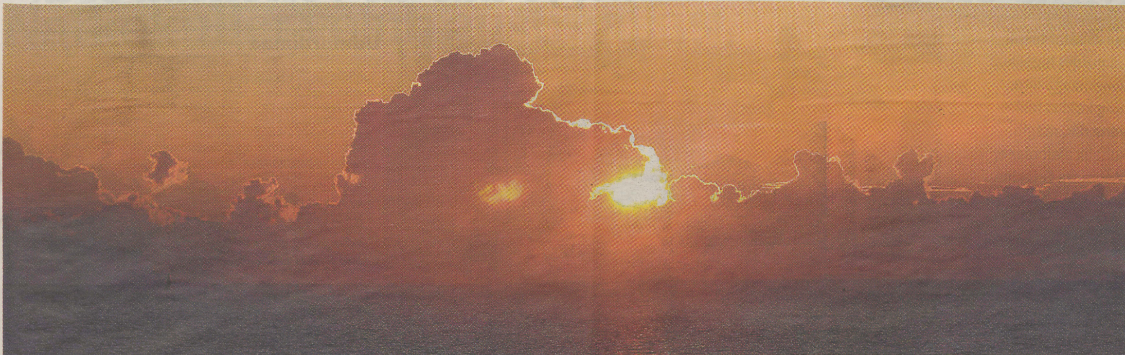
Päike ja pilved mängivad kulli, päikesele sel suvel kuigi palju asu ei anta. Tihtipeale õnnestub valguskeral välja ronida alles loojangu eel.