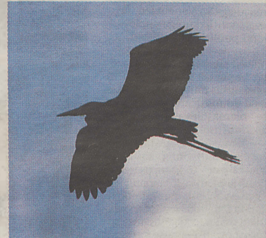
Küürakas. Taeva all tiirutavad haigrud toidavad hoolega poegi.