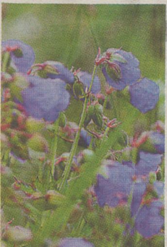
Kellukate aeg on käes.