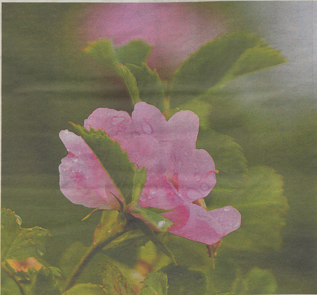
...õitseb roos rannaliival. Vastpuhkenud kibuvitsaõied on suurema osa ajast pisarais.