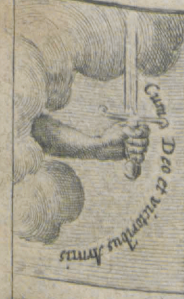
De de vromme

Sweedsche 88. OORLOGHEN dat sijn De gedenckwerdichste daede, geschiet, in Duytslād: en wacrom DER SWEDĒ CONING, Ch rt . van Saxen en stenden des Rycks, de waepenē tegen. KEYSERL ke MAYEST e hebben aengenomē.