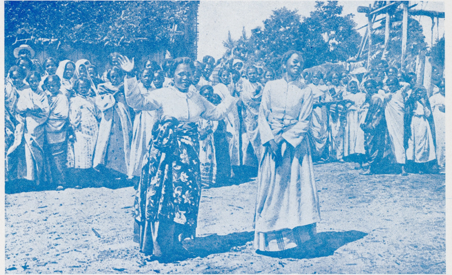
Madagaskari päriselanikkude tants.