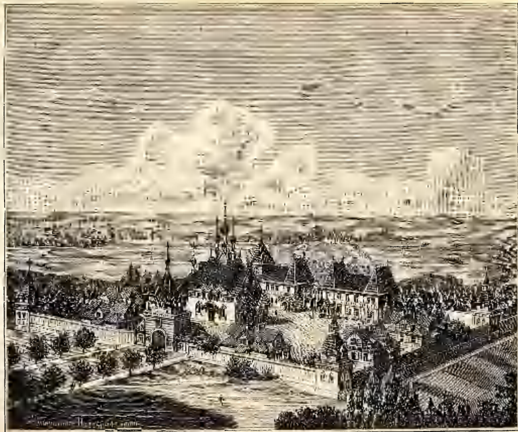
Видъ Пюхтицкаго монастыря по исполненіи предположенныхъ въ немъ работъ.