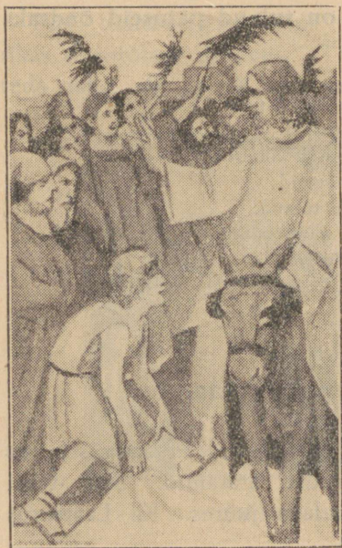
Jeesus läheb Jeruusalemma.

Ühes oma jüngritega ja teiste palverändajatega tuli Jeesus Jeruusalema lähedale. Jõudes Peetvage alevini Õlimäe kohal, kutsus ta kaks jüngrit ja ütles neile: „Minge lähedalolevasse külasse! Seal leiate kinniseotud eesli. Päästke ta ja tooge siia! Kui keegi teilt küsib, miks te päästate eesli, kostke: Issandale on seda tarvis, — küll ta siis lubab." Jüngrid läksid. Nad leidsid eesli ja töid selle Jeesusele. Siis laotasid nad riided eesli selga ja panid Jeesuse sinna istuma. Paljud laotasid oma riided teele, mida mööda Jeesus sõitis, teised raiusid puude oksid ja heitsid