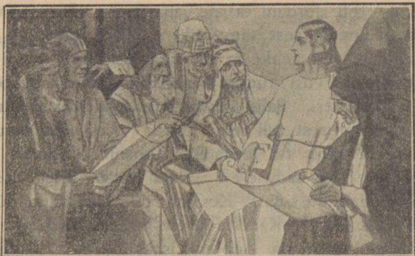
Kaheteistkümne-aastane Jeesus templis.

miks sa meie nõnda oled teinud? Vaata, su isa ja mina oleme sind õieti vaevaga otsinud." Jeesus kostis: „Mis see on, et teie mind olete otsinud? Eks teie teadnud, et ma ses pean olema, mis mu Isa päralt on!" Nad ei mõistnud aga tema sõnu. Siis läks Jeesus tagasi Naatsaretti ja kuulis vanemate sõna. Ta kasvas tarkuses, pikkuses ja armus Jumala ja inimeste juures.