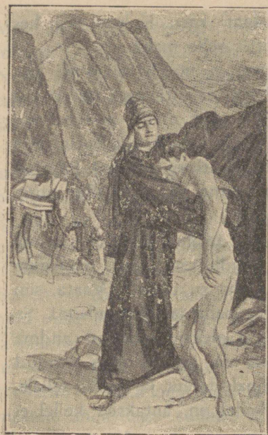
Halastaja Samaria mees.

päeval edasi matkas, andis ta peremehele kaks rahatükki ja ütles: „Kanna hoolt tema eest! Ja mis sa veel peaksid kulumata, selle tasun sulle tagasi tulles!“ Nüüd ütles Jeesus käsutundjale: „Keda pead sa neist kolmest selle ligimeseks, kes oli sattunud röövlite „kätte?“ Käsutundja vastas: „Seda, kes tema peale halastas.“ — „Mine ja tee nõndasamuti,“ käskis teda Jeesus.