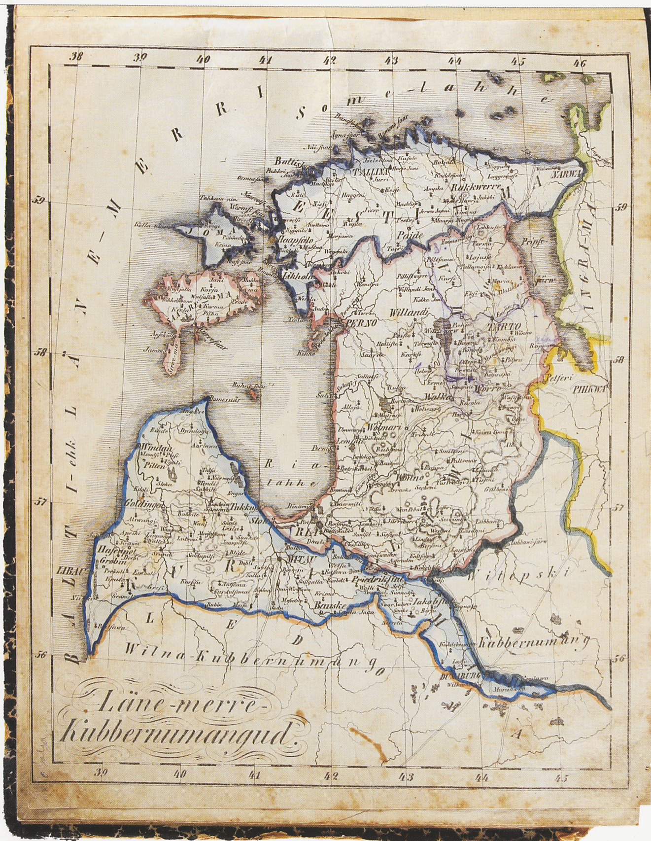
Maa-Kaardi-Ramat, kus sees 16 Maa Kaarti. Pärnu, 1859. Maa-Kaardi-Ramat, kus sees 16 Maa Kaarti [=An atlas containing 16 maps]. Pärnu, 1859.