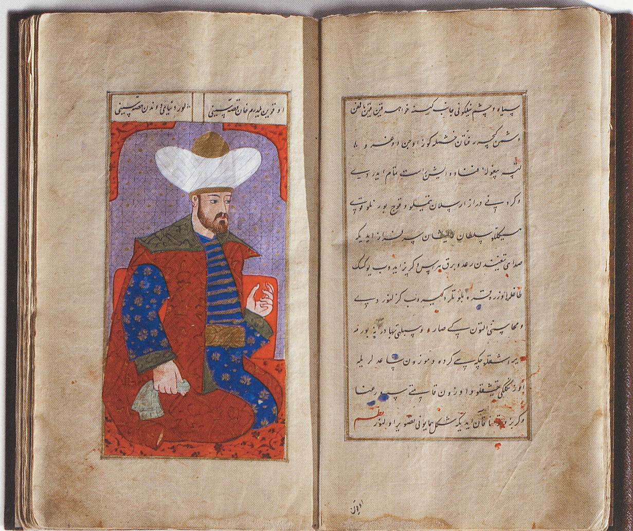
Ahsan at-taqwim. 1592. Käsikiri, miniatuurmaal. Ahsan at-taqwim. 1592. Manuscript, miniature painting.