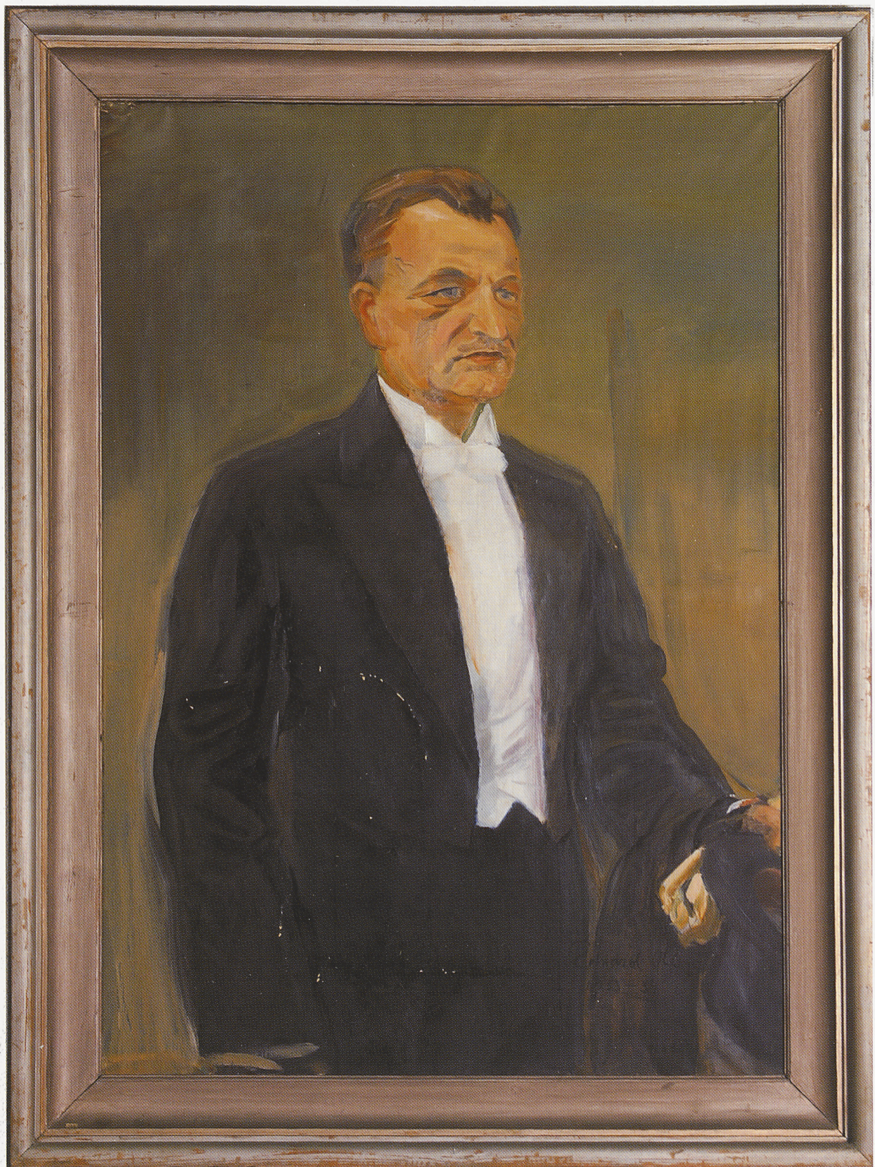
Ole, E. Johan Köpp. Õli, lõuend. 1934. Johan Köpp. By E. Ole. Oil, canvas. 1934.