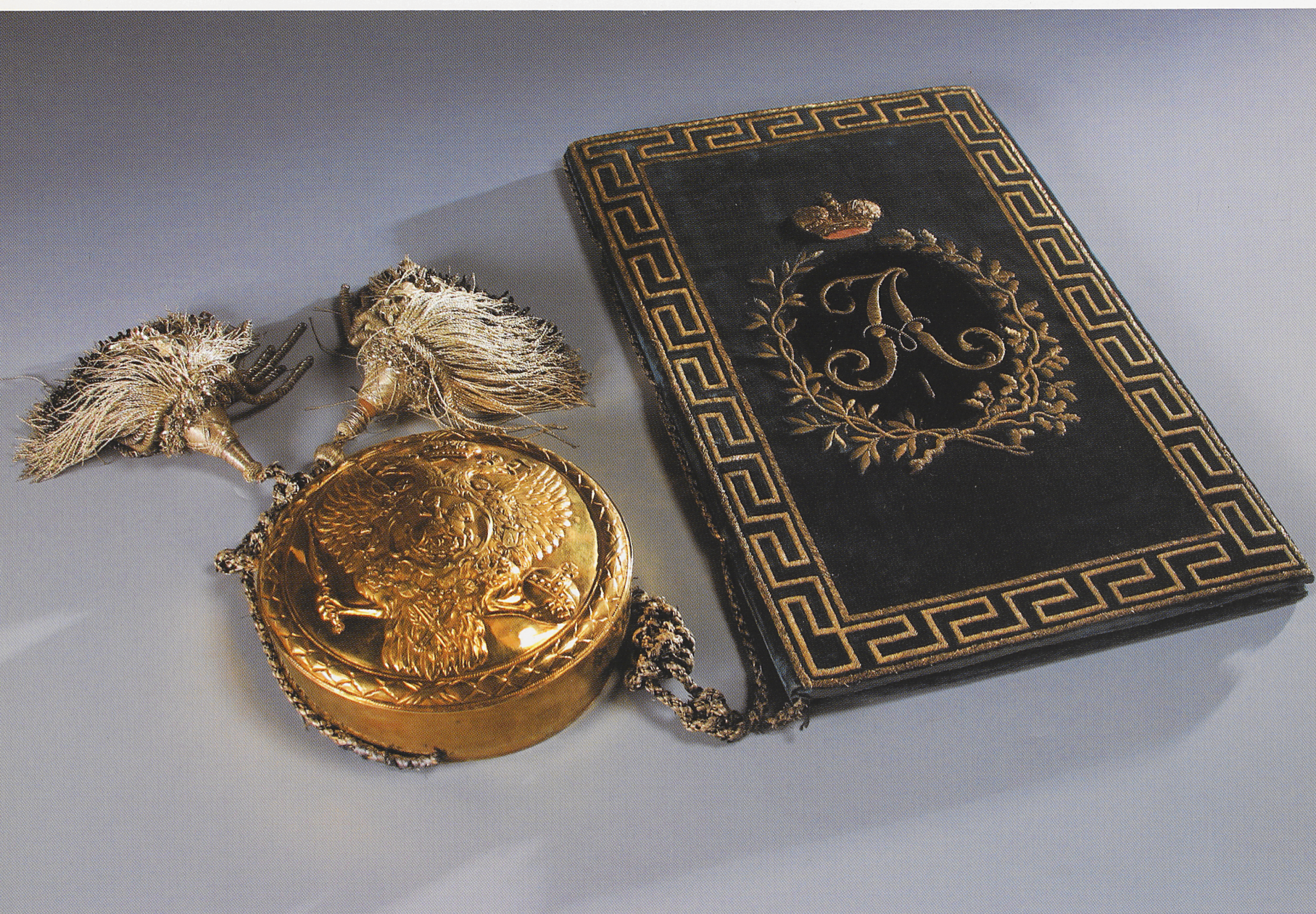
Keiserliku Tartu Ülikooli asutamiseakt. 1802. Foundation Act of the Imperial University of Tartu. 1802.