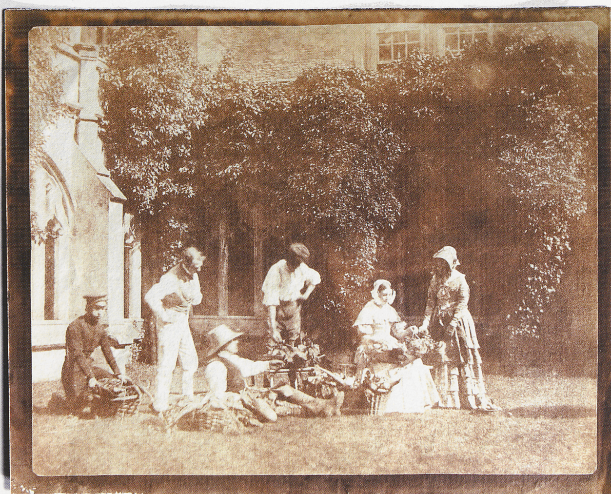
Grupp inimesi Lacock Abbey lossi taustal. 1840. a-d. A group of people by Lacock Abbey. The 1840s.