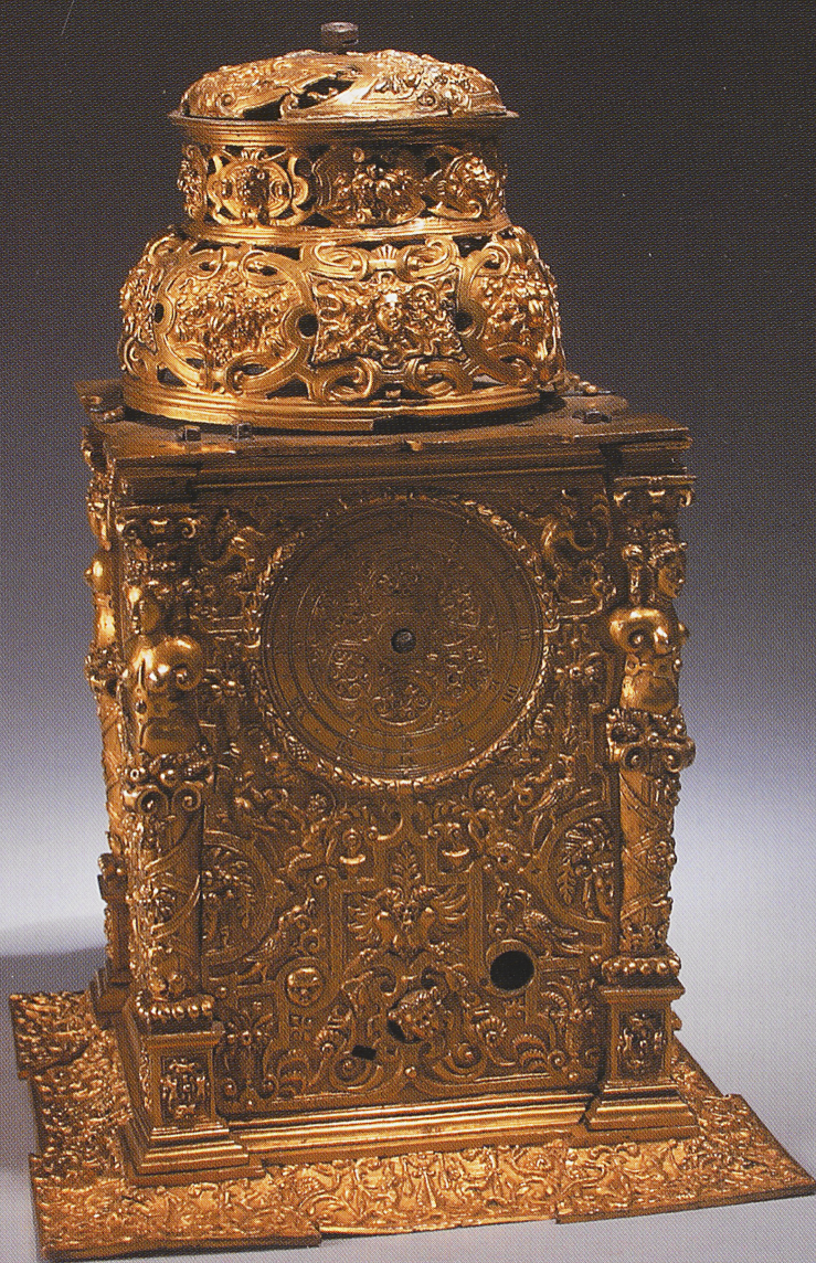
Jeremias Metzgeri valmistatud lauakell. 1564. Pronks. A table clock made by Jeremias Metzger. 1564. Bronze.