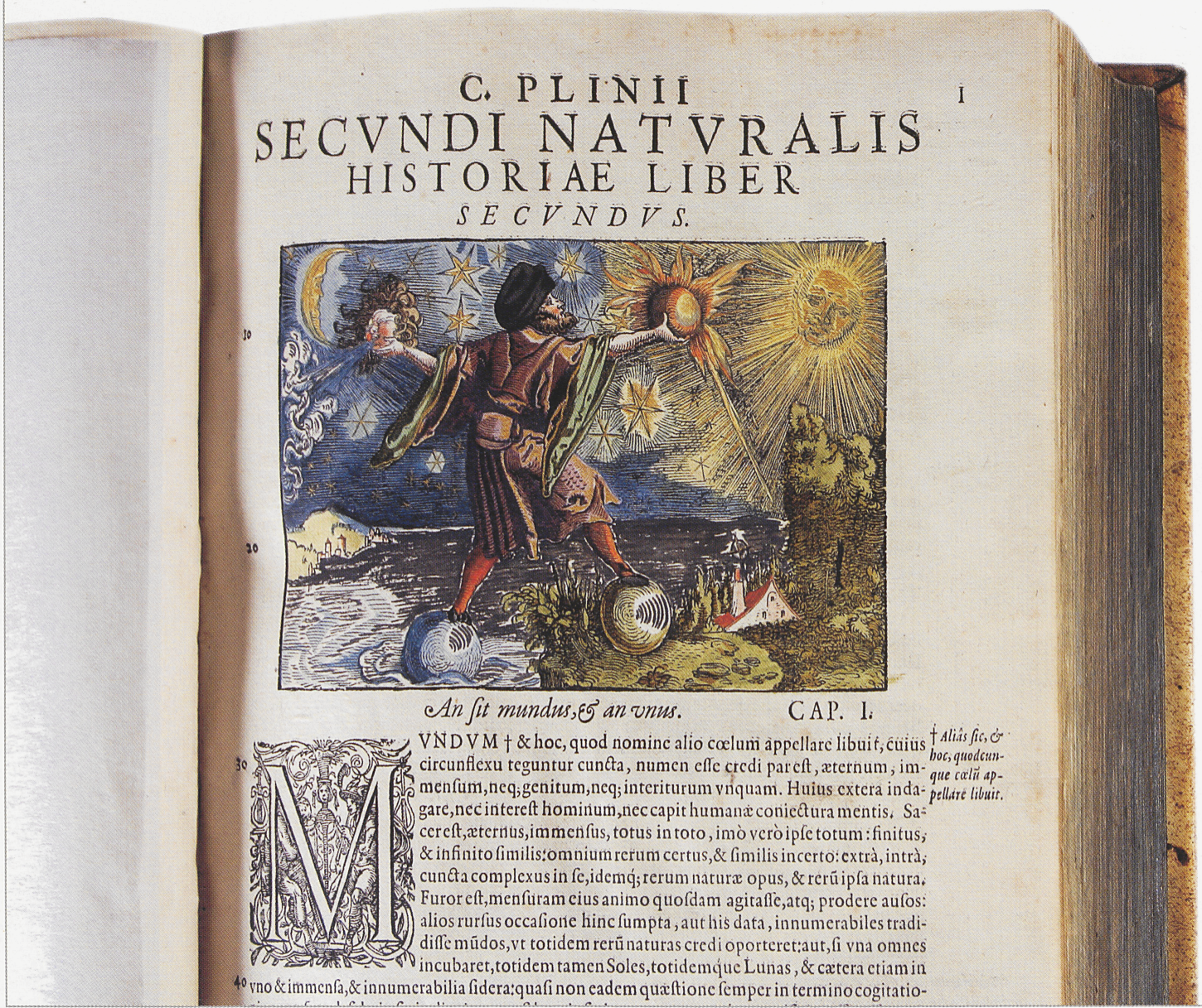
Gaius Plinius Secundus. Historia mundi naturalis. Frankfurt, 1582. Koloreeritud illustratsioon. Gaius Plinius Secundus. Historia mundi naturalis. Frankfurt, 1582. Coloured illustration.