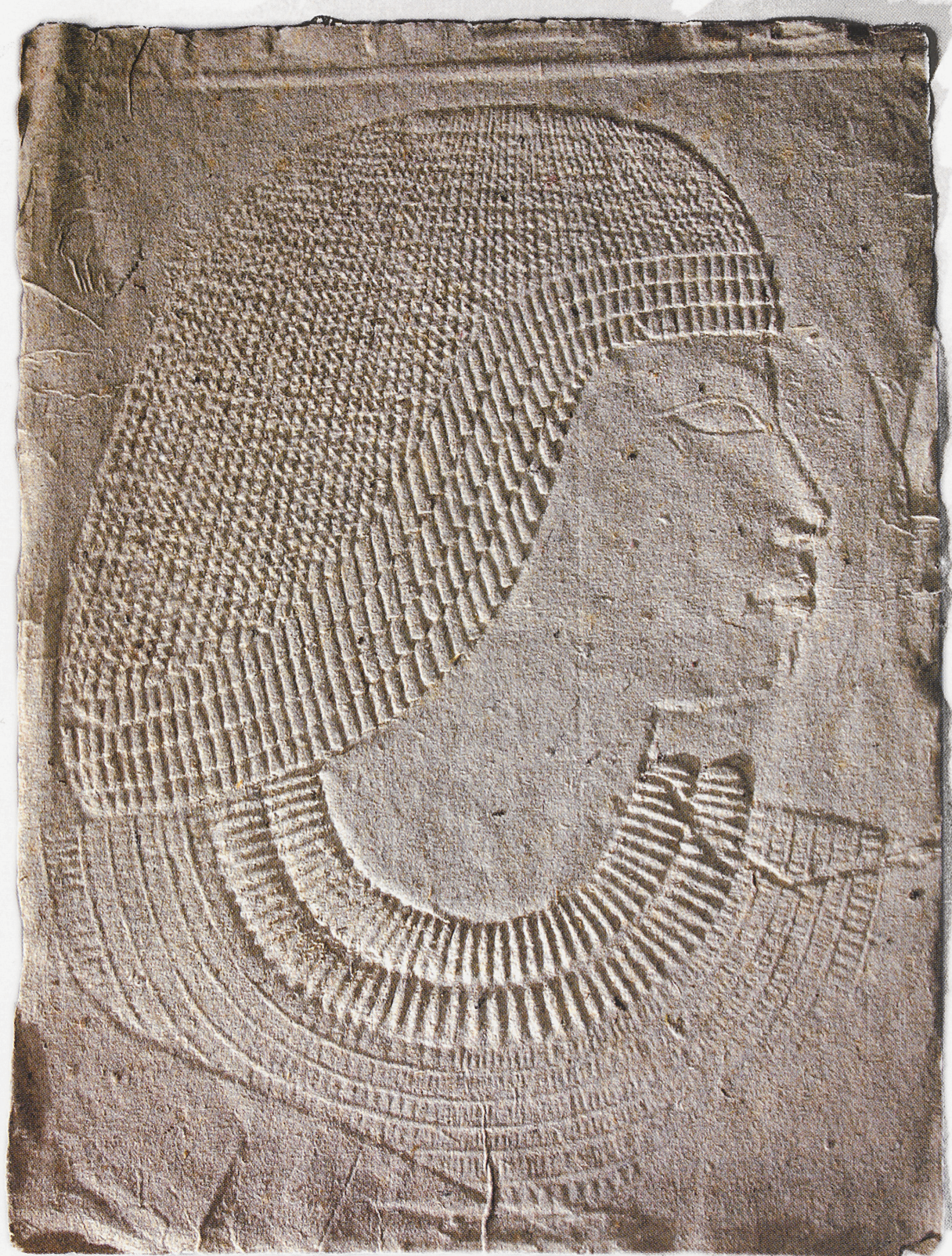
Teeba üllikute hauakambrireljeefi pabertõmmis. 1900. a-te algus. A paper cast of a relief from a crypt of Theban superiors. Early 1900s.