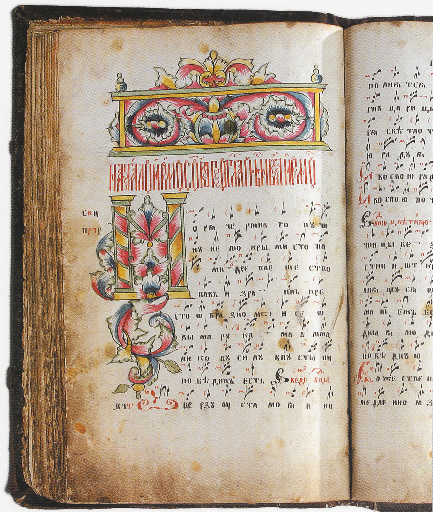
Ирмологий, крюковой. 1833. Käsikiri. A church songbook of the Old Believers. 1833. Manuscript.