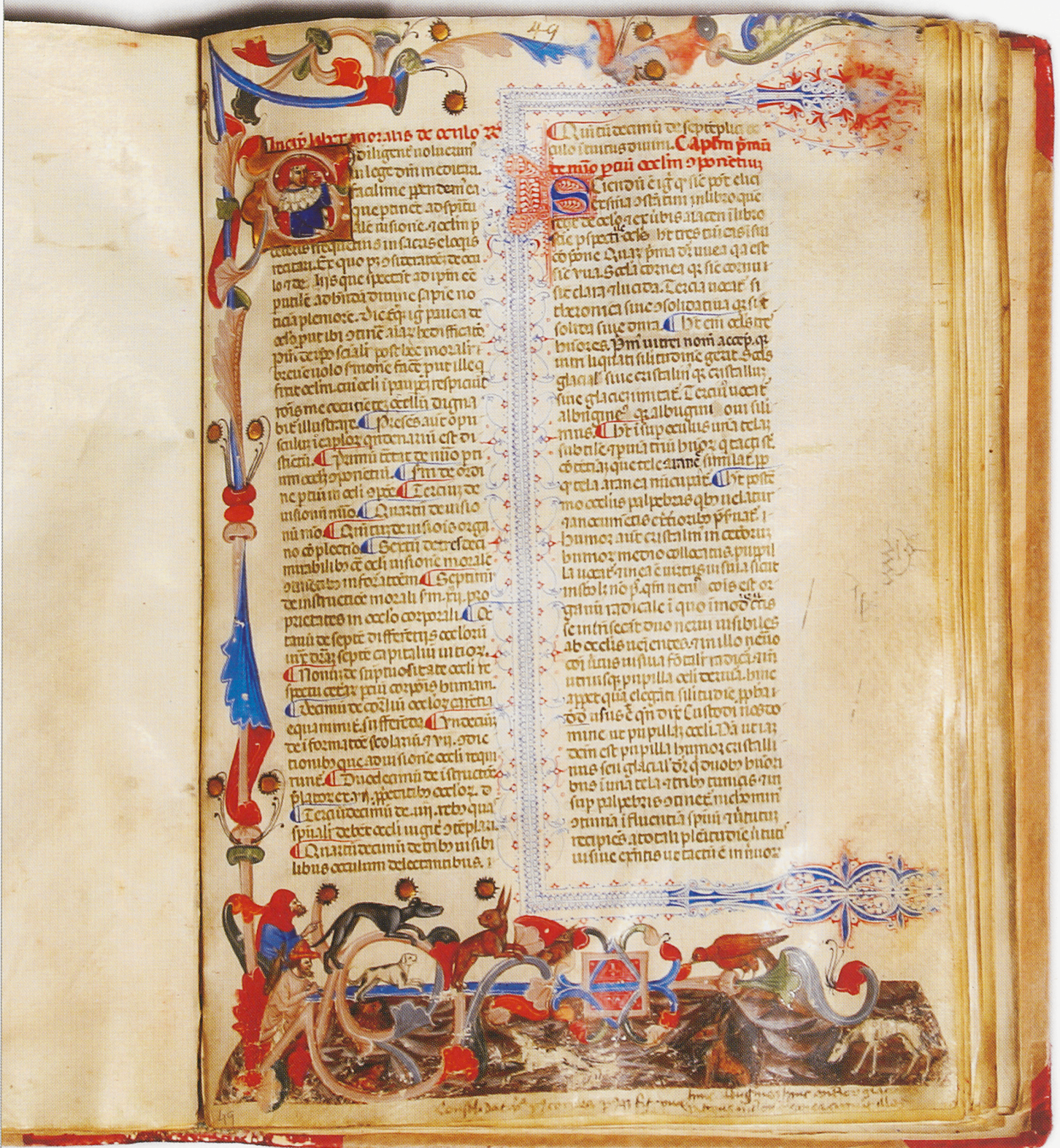
Limoges'i Petrus. Liber moralis de oculo. Itaalia. 14. saj. 1. p. Pärgamentkäsikiri. Petrus de Limoges. Liber moralis de oculo. Italy, the 1st half of the 14th century. Parchment manuscript.