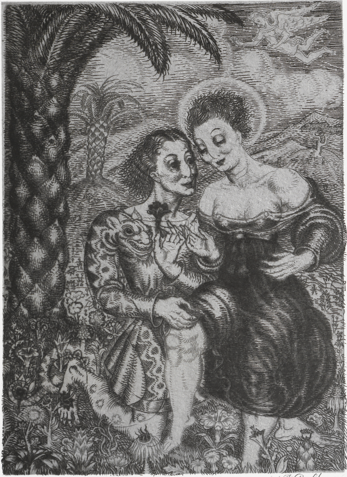
Pouchkine, A. La Gabriellide. Paris, 1928. Illustratsioon: E. Viiralt. Pouchkine, A. La Gabriellide. Paris, 1928. Illustration by E. Viiralt.