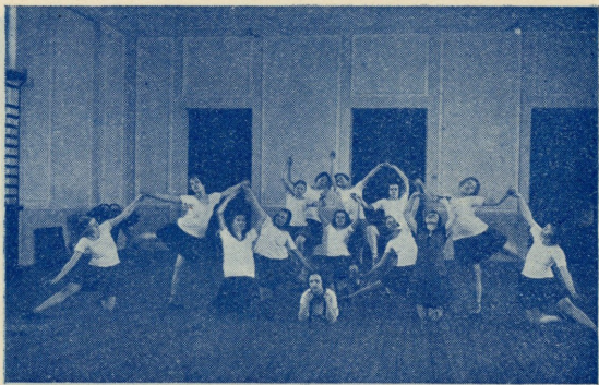
Noorte võimlemise grupp.

Teatavasti töötavad Ühingu juures juba neli aastat hääde tagajärjedega eneseharimise ringid ehk noorte klubid, milles ülesandeks on noorte tütarlaste igakülgne arenemine ning otsekohene ettevalmistus järjest teravamaks muutava eluvõitluse vastu. Girl-Roservide (nii nimetatakse neid noori tütarlapsi) liikumine sai alguse a. 1885 Ameerikas, kuna ta nime ja välised märgid omandas alles a. 1917. Ringid on rajatud omavalitsuse printsiipidele. Nende liikmed valivad eneste keskelt juhatuse ja toimekonnad, kes klubi mitmekesisist tööd kor-