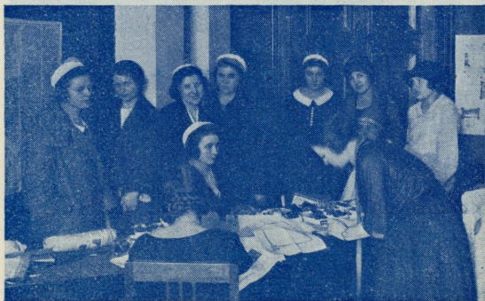
Üliõpilastele käsitööde väljaandmine.

Nõuandjaks on igal ringil n. n. juhataja, kes oma nõu ja jõuga ringile toeks on. Ringid töötavad asjatundlikke isikute juhatusel. Ringide tegevuskava ripub ära ringide liikmetest enestest. Tervitatud on eneseavaldus liikmete poolt kas referaatide, kõnede, muusika, luule ehk mingisuguste muude võimiste näol, kuid ikka niisugusel kujul, et nad liikmetele kooraks ei ole ja koolitööd ei takista. Sellepärast lubatakse ainult neid õpilasi ringi liikmeks olla, kes koolile sellest teatanud ja sealt selleks nõusoleku saanud. Ettekandeid, loenguid ja kursusi peetakse niihästi üldhariduslistest, kui ka eriti naise tegevusse puutuvais ainetes, misjuures majanduslised kulud Ühingu