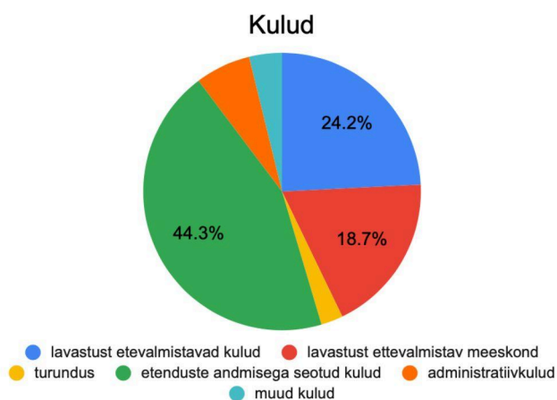
Joonis 1. Lavastuse “Häärber” kulud