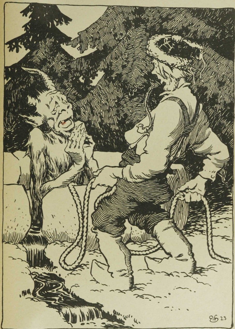
Тянет он, тянет, вытянул глядь, на веревке чорт.