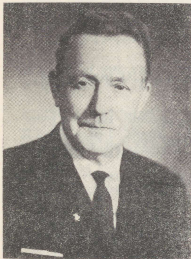
Eesti NSV teeneline kultuuritegelane Salme Valgemäe Заслуженный деятель культуры ЭССР Сальме Валгемяз