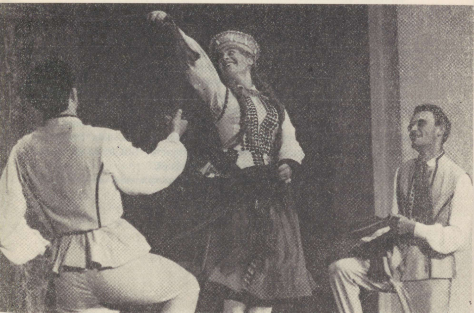
Riia Polütehnilise Instituudi tantsuansambel «Vektors» Танцевальный ансамбль «Векторс» Рижского политехнического института