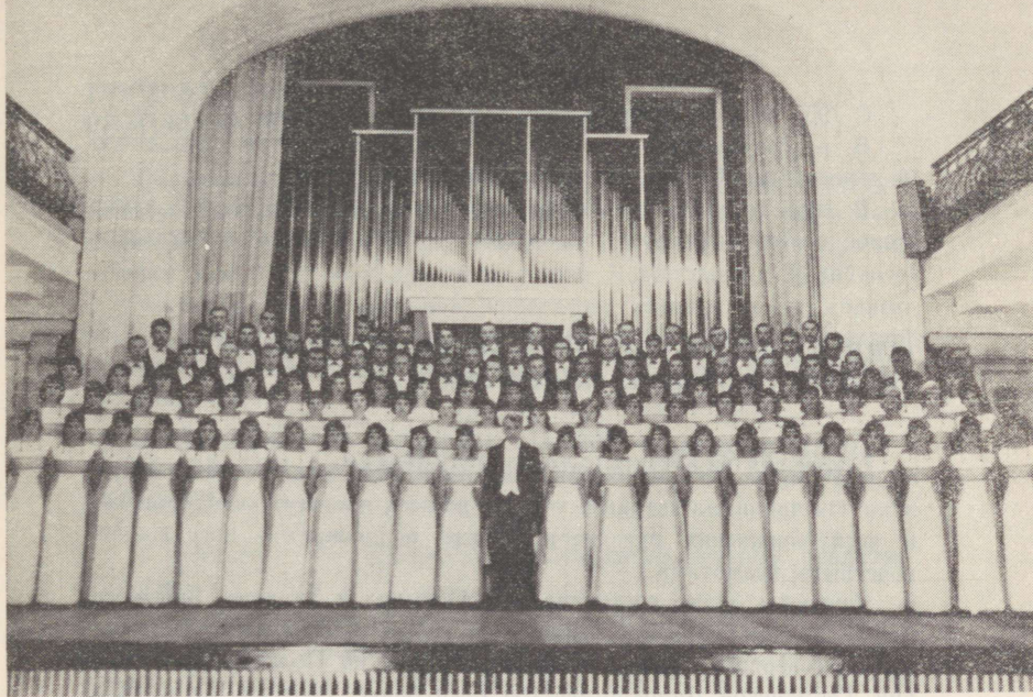
Каунасе Політехнісe Інституі акадeміліне коор «Јауныстe» Академічeскі хор «Јуныстe» Каунасскогo політeхнічeскогo інст- тута