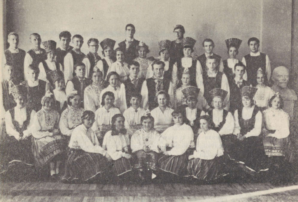
Tallinna Polütehnilise Instituudi tantsuansambel «Kuljus» Танцевальный ансамбль «Кульюс» Таллинского политехнического института