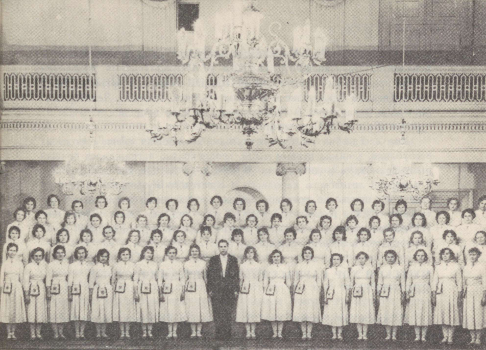
Eesti NSV Teaduste Akadeemia Naiskoor Женский хор Академии Наук Эстонской ССР