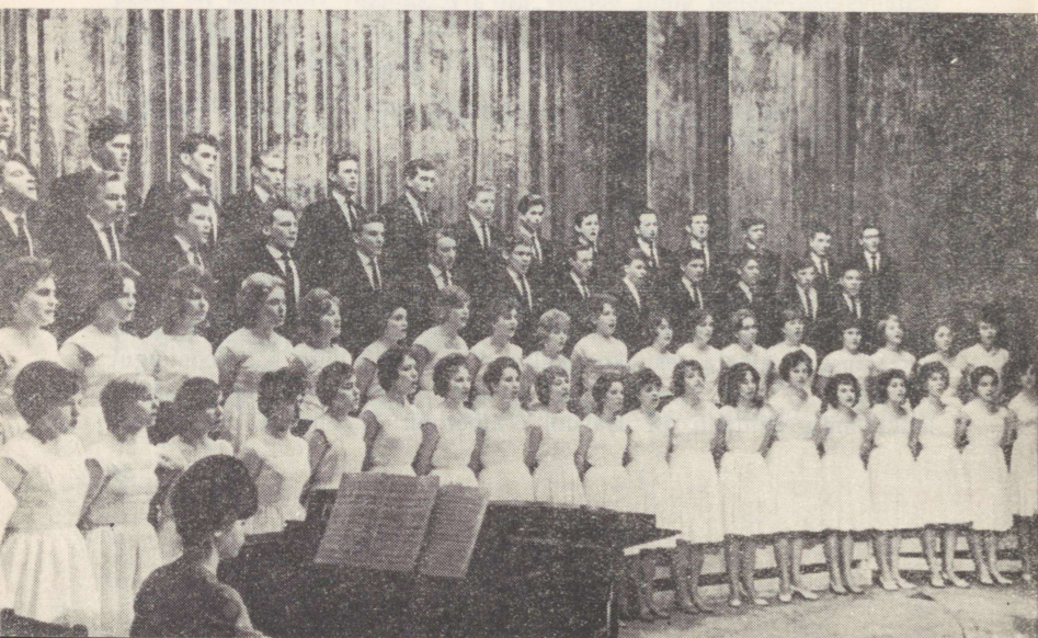
V. I. Lenini nim. Valgevene Riikliku Ülikooli rahvakapell Народная хоровая капелла Белорусского государственного университета им. В. И. Ленина