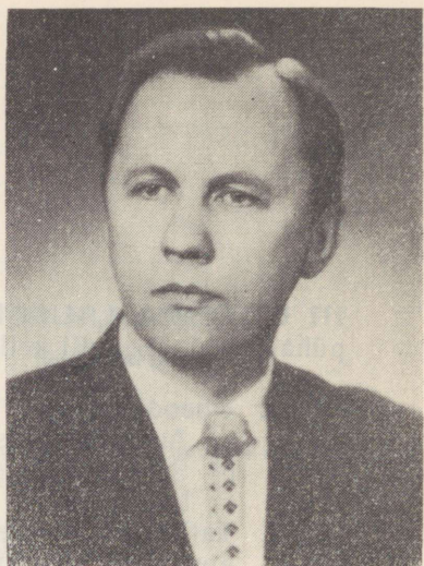
Leedu NSV teeneline kunstnik Pranas Sližys Заслуженный артист Лит. ССР Пранас Слижис