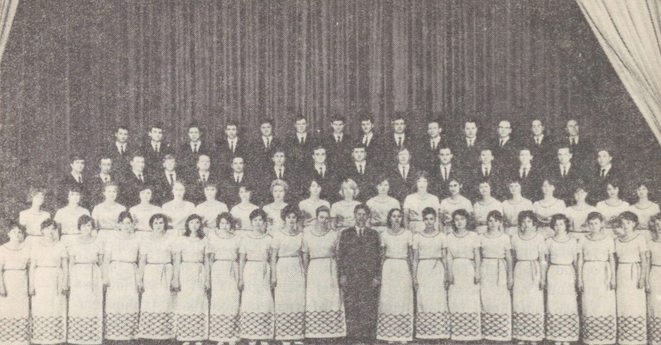
Kiievi Polütehnilise Instituudi rahvakapell Народная хоровая капелла Киевского политехнического института