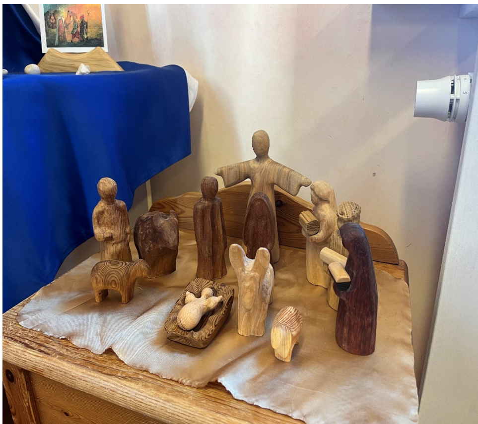
Joonis 7. Vikerkaare lasteaias kolmekuningapäev.

Selle laua kõrval asub väiksem laud, millele on asetatud lihtsad puidust figuurid, mille tähenduse ja rolli kohta pean veel täpsemalt uurima (vt joonis 7)..