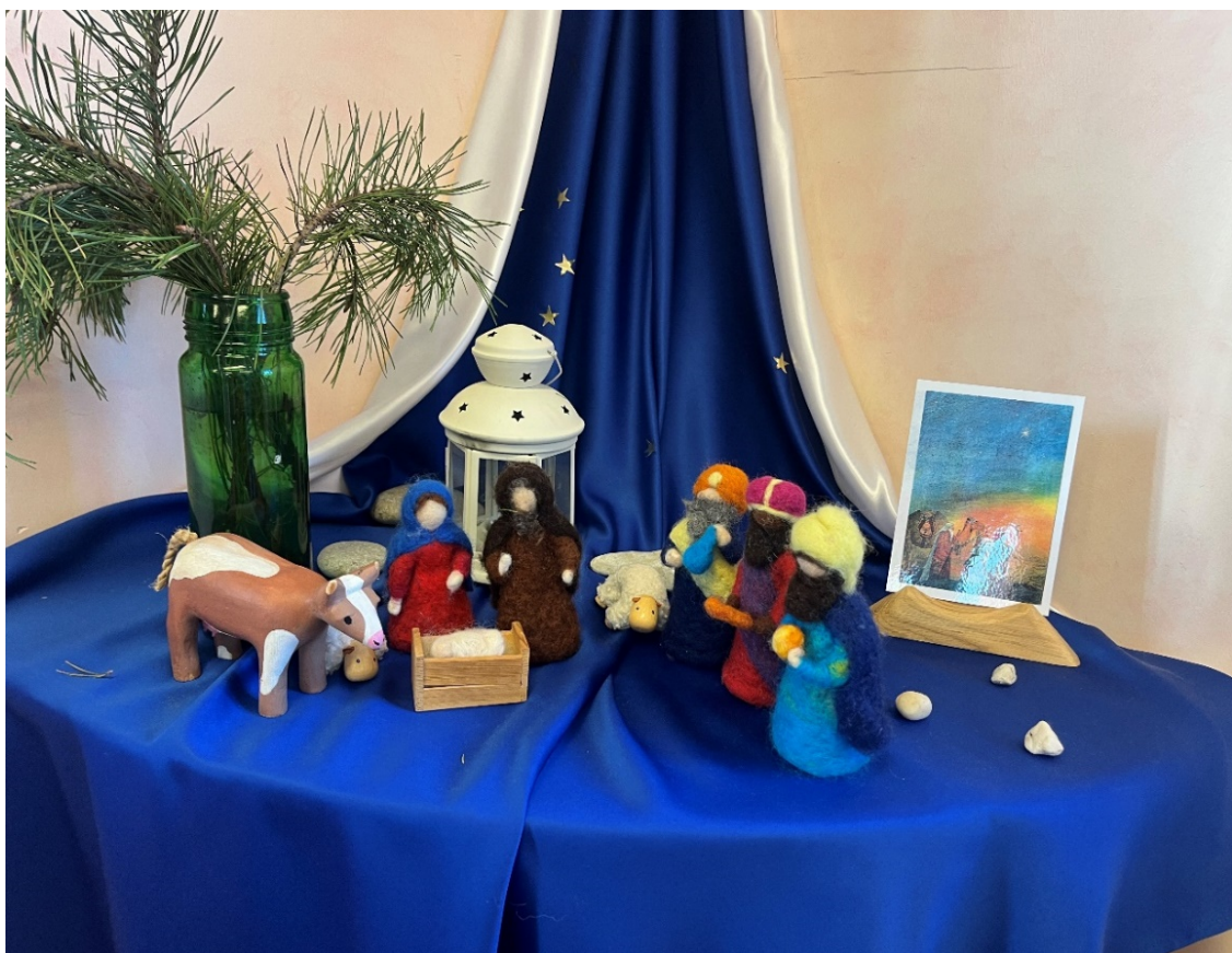
Joonis 6. Vikerkaare lasteaia kolmekuningapäev.

Seejärel istuti koos põrandale ringi ja lapsed vaatasid ning uurisid kingitusi lähemalt. Õpetaja pani korraks viiruki suitsema ja rääkis selle puhastavast tähendusest. Õpetaja selgitas, et kuld tähistab kuninglikkust, täht aga sümboliseerib valgust, mis elab igapäevaelu südames. Üks lastest küsis Heroodese kohta ja õpetaja selgitas, et Heroodes kartis kaotada oma trooni ning Jeesuse perekond pidi seetõttu põgenema Egiptusesse. Seepeale jagasid mõned lapsed, et on ise Egiptuses käinud, mis tõi vestluse isikliku mõõtme. Päevaring lõppes püsti tõustes ja koos loetud salmiga: „Armas sõber, armas vend, me oleme head sõbrad. Aitäh, tänase päeva eest.” See lõpetas kolmekuningapäeva väärrika ja tähendusliku meeleoluga – lapsed olid tegevuste kaudu mitte üksnes vaatajad, vaid sisulised osalised, kes kogesid ühist tähendust ja kuulumist. Minu tähelepanu köitis piduliku moega laud, kuhu oli nüüd lisandunud ka kolm kuningat, rikastades selle sümboolset kujundust (vt joonis 6).