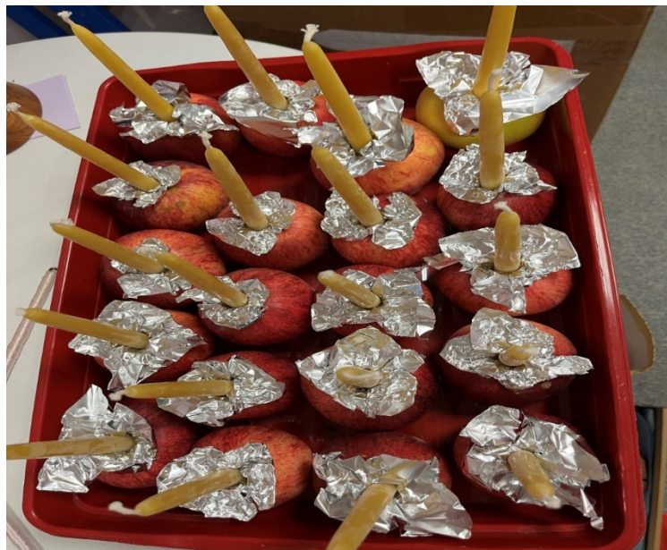
Joonis 2. Koidutähe lasteaia advendispiraal.

Enne rituaali viis üks õpetaja mind õpetajate tupp, kus ta sättis iga lapse jaoks valmis õuna ja väikese küünla (vt joonis 2). Selle vaikse toimetamise ajal jagas ta mulle rahulikult advendispiraali sümboolset tähendust – kuuseokstest spiraal tähistab lapse sisemist teekonda, mille lõpus süüdatakse küünal valguse ja soojuse sümbolina. Õun, millesse küünal asetatakse, sümboliseerib valguse edasiandmist. Need väikesed, kuid tähendusrikkad elemendid muudavad rituaali lapse jaoks nähtavaks ja kogetavaks – läbi liikumise, valguse ja lõhna.