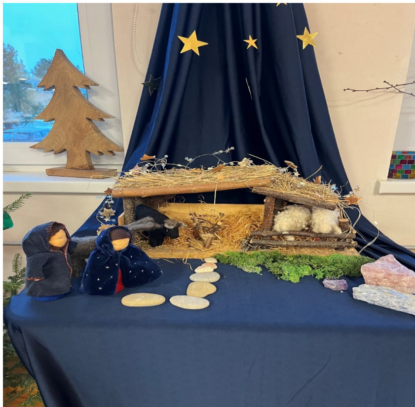
Joonis 4. Koidutähe jõulumäng.

sinisele kangale oli lisandunud rohkem kuldseid tähti, lisaks lambad, roheline sammast ja kivid. Sõim oli veel tühi, oodates Jeesuslapse sündi, mis sümboliseeris adventiaja ootust ja ettevalmistust (vt joonis 4).