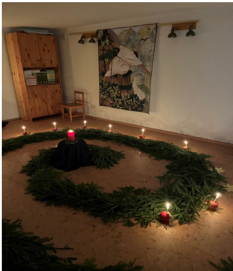
Joonis 3. Vikerkaare lasteaia adventispiraal.

Väikeses ruumis võis viulimäng kohati mõjuda liiga valjult, erinevalt waldorflasteaiast, kus muusika oli osa ühisest laulmisest, luues pehmema ja loomulikuma ülemineku rituaali sisse. Sarnaselt waldorflasteaiale tajusin ka siin adventiringis, et siin on meil aega. Mõlemas lasteaias astus rituaali esimesena täiskasvanu, luues oma liikumise ja kohaloluga rituaali rütmi, meeolelu ja tähenduse. On tajutav, et kõiges, mida tahetakse, et laps õpiks – olgu see rahu, keskendumine või austus pühaliku hetke vastu –, peab õpetaja olema esmalt ise eeskujuks.