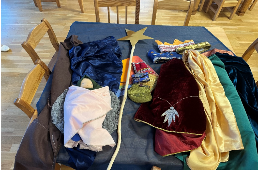
Joonis 5. Koidutähe lasteaia kolmekuningamäng.

Etendus algas ühise liikumisega sõime poole, lauldes tähest, kel valgus südames. Kõige ees kõndis laps, kes kandis inglikostüümi ning hoidis pika varre otsas kuldset tähte – tema järel sammusid kolm kuningat ning seejärel ülejäänud lapsed. Kõik liikusid aeglases ja tähenduslikus rütmis, laul saatis igat sammu. Laulmine ei olnud ainult liikumise taustaks, vaid kandis tegevust – lauldi teel olles, Jeesuslapse juurde jõudes, tema ees peatudes ja kummardudes, mis andis märku, et lapsed tunnetasid hetke sügavamat tähendust. Laul lõi pühaliku atmosfääri, mis täitis ruumi vaikse soojuse ja keskendumisega. Sõime ees lauldud laul oli kui austusavaldus – lapsed seisatasid ja osalesid vaikselt imetluses. Ühel hetkel jäi ingli kostüümi kandnud laps sõime juurde seisma, justkui jäädes perekonda valvama.