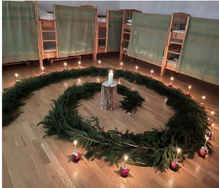
Joonis 1. Koidutähe lasteaia advendispiraal.

Enne rituaali viis üks õpetaja mind õpetajate tupp, kus ta sättis iga lapse jaoks valmis õuna ja väikese küünla (vt joonis 2). Selle vaikse toimetamise ajal jagas ta mulle rahulikult advendispiraali sümboolset tähendust – kuuseokstest spiraal tähistab lapse sisemist teekonda, mille lõpus süüdatakse küünal valguse ja soojuse sümbolina. Õun, millesse küünal asetatakse, sümboliseerib valguse edasiandmist. Need väikesed, kuid tähendusrikkad elemendid muudavad rituaali lapse jaoks nähtavaks ja kogetavaks – läbi liikumise, valguse ja lõhna.