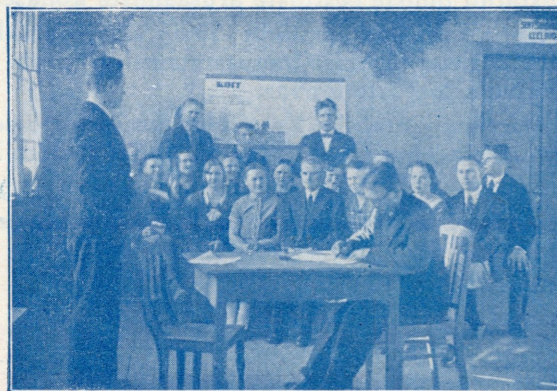
Nõnda toimusid õpiringide töökoosolekud.