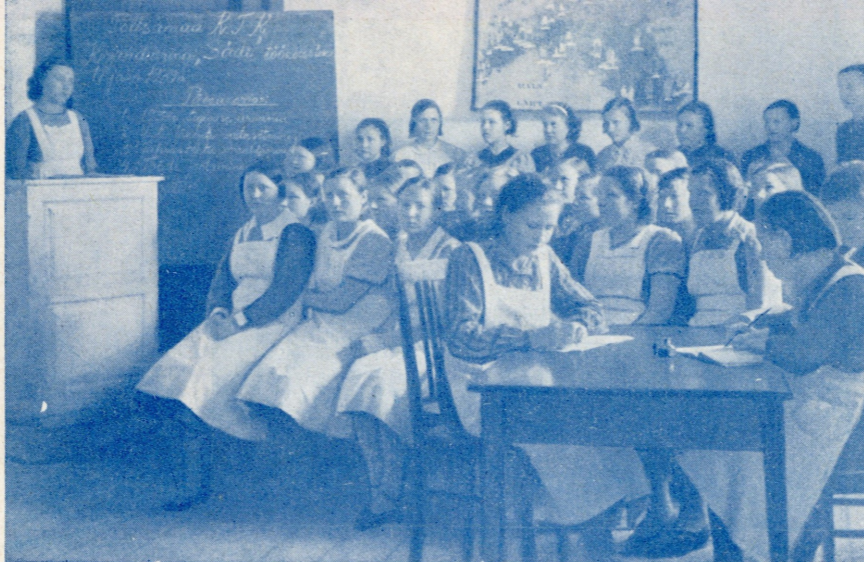
Kirjanduse õpiring tegevuses.