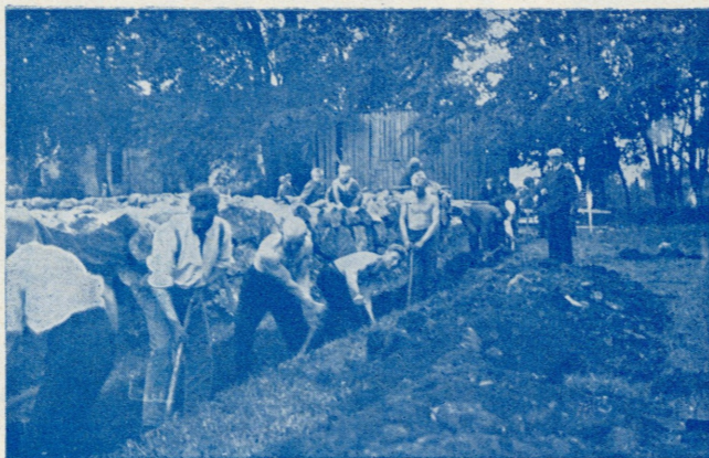
Ühiselt seltsimaja alust rajamas.