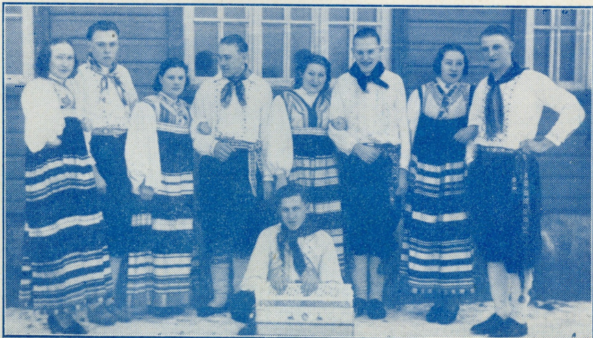
Rahvatants oli üheks lemmikharrastuseks.