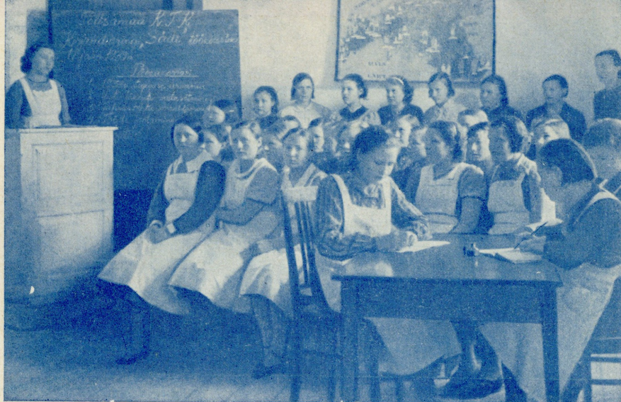
Kirjanduse õpiringi tegevuses.