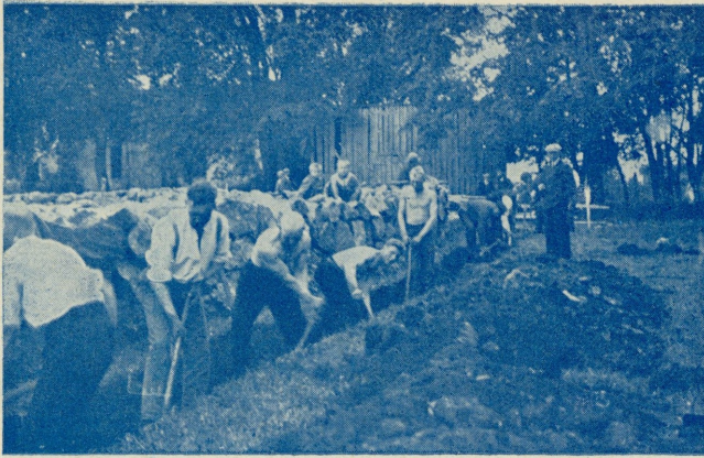
Ühiselt seltsimaja alust rajamas.