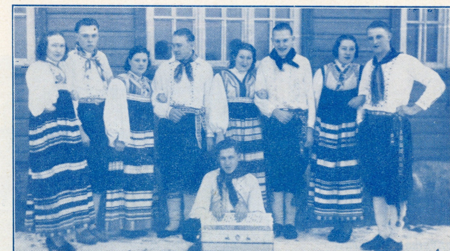
Rahvatants oli üheks lemmikharrastuseks.