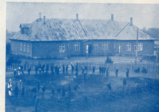
Rahvamaja ümbrust kaunistamas.