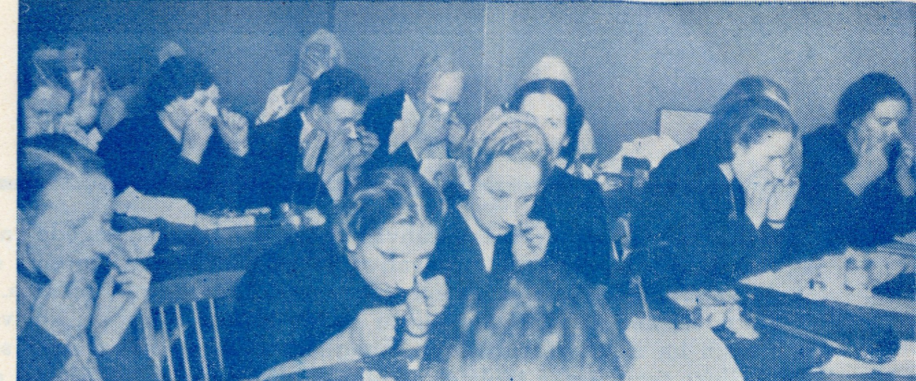
Näitejuhtide kursuse töö on hoos.

17 rahvamajale väärtusega Kr. 10 719.17.