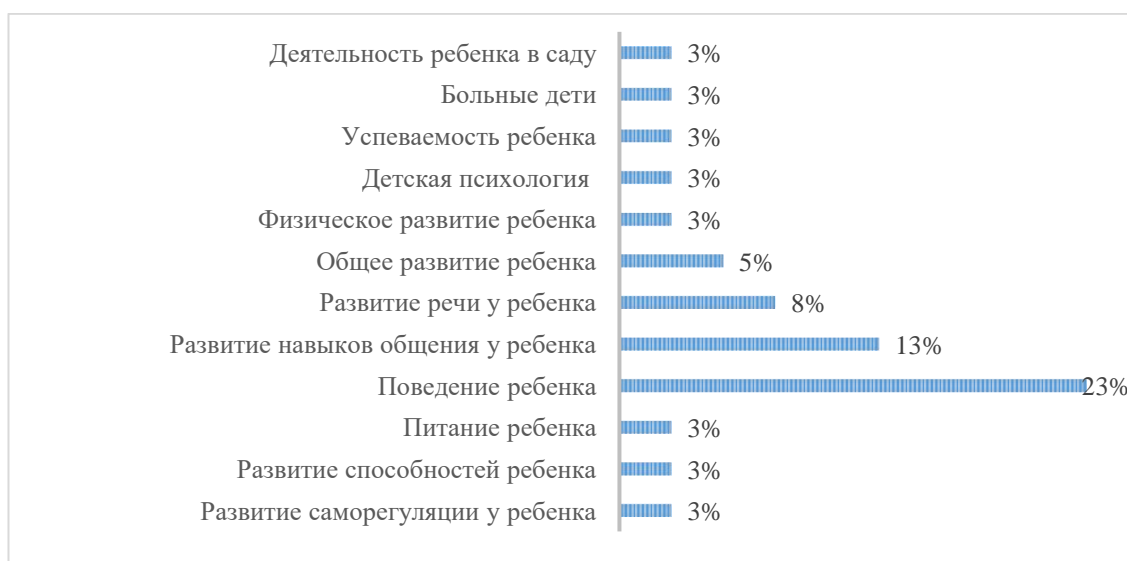
Рисунок 6. Тематика консультационных встреч с педагогом (мнение родителей).

воспользовались предложенной возможностью, и 67,5% определили перечень волнующих их вопросов следующим образом (см. рисунок 6).