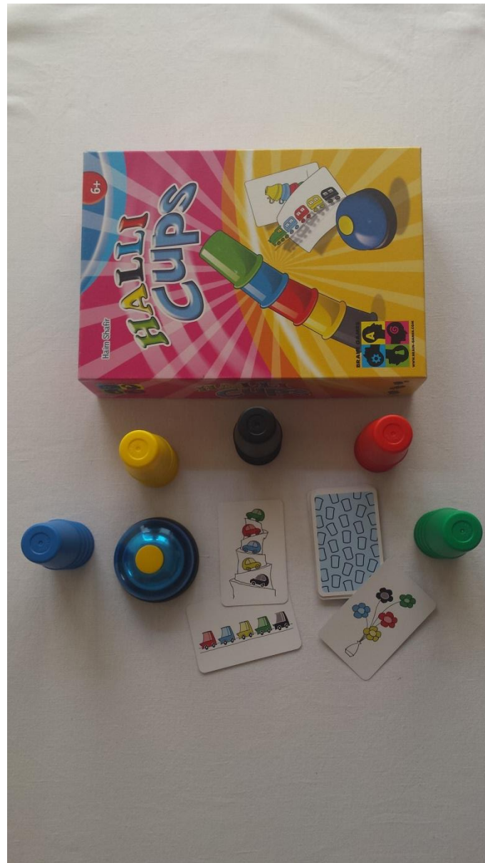
Lisa 1. Foto lauamängu „Halli Cups“ mänguvahenditest