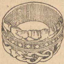
Sõrmus (hõbe). Et- nograafiline —Jär- vamaalt. Spiraali keeratud lohe. 8,7 g, dm. 22 mm.

Kui seda tabelit võrrelda eelpool- toodud kuutabeliga, kus näidatud, mil