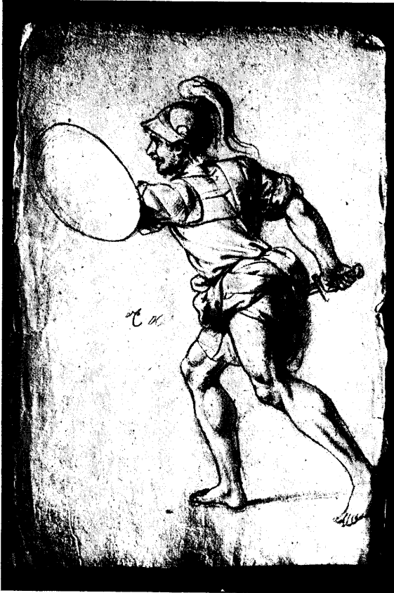
Dessin de Le Brun n° 28937.

bleau. La position des jambes est différente. Ces deux figures font l'effet de deux variantes d'un même thème. L'Alexandre devant les reines des Perses est une autre variante que j'ai déjà signalée.