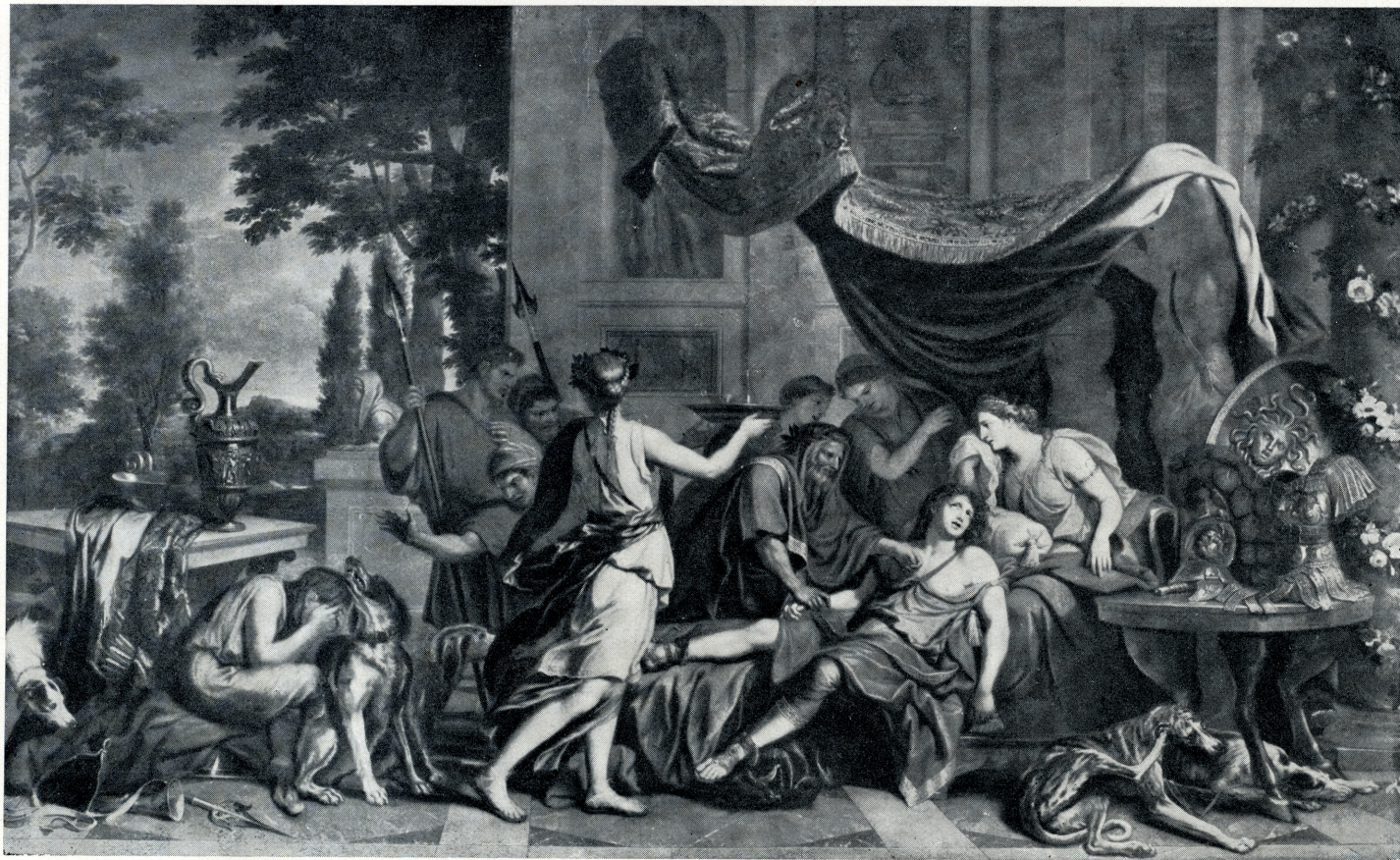
La Mort de Méléagre.