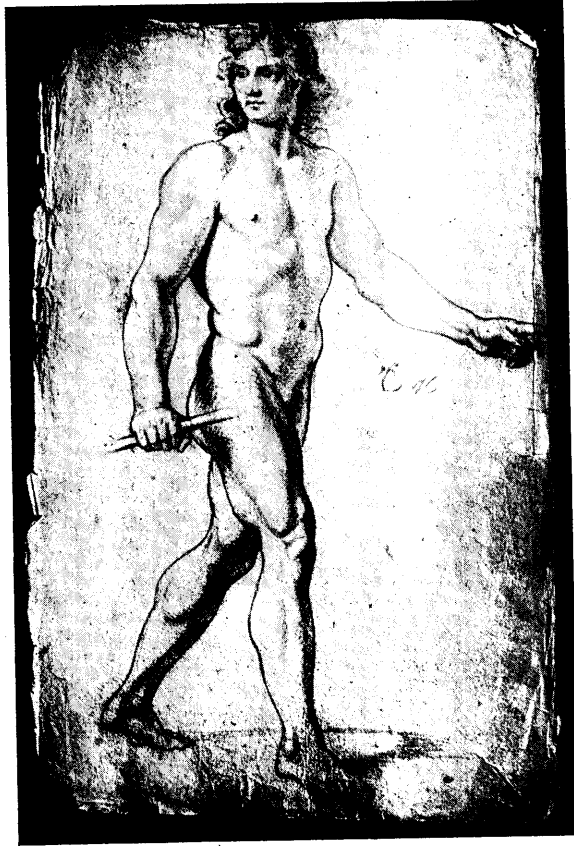
Dessin de Le Brun n° 28028.

qui ajoute à mes présomptions favorables. C'est une figure nue d'homme jeune représentée dans une action toute semblable à celle d'Alexandre. Les figures ne se recouvrent pas exactement, mais pourraient être aisément substituées l'une à l'autre. Le Brun a toujours gardé l'habitude d'étudier ses figures nues, même