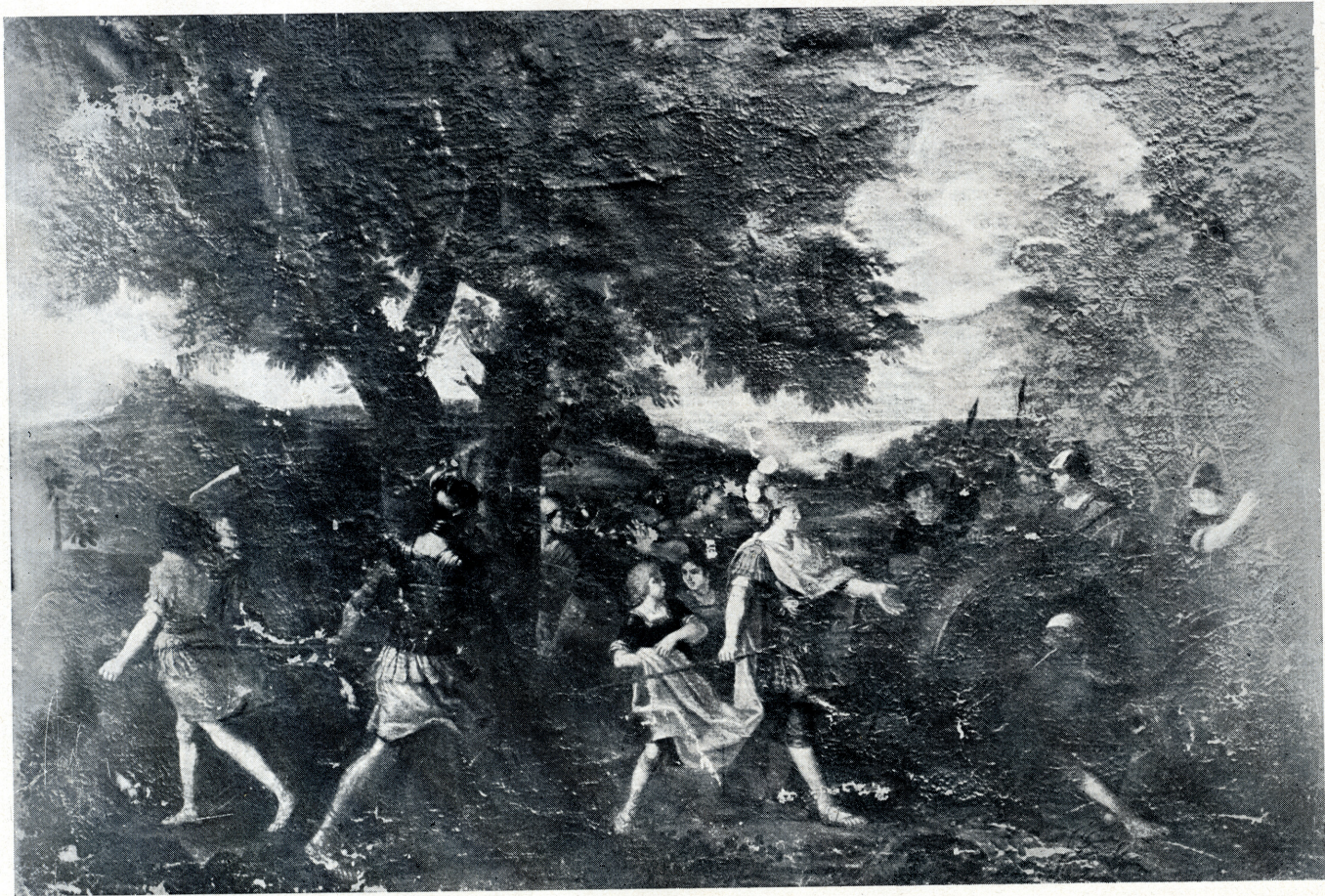
Alexandre et Diogène (la toile avant la restauration).