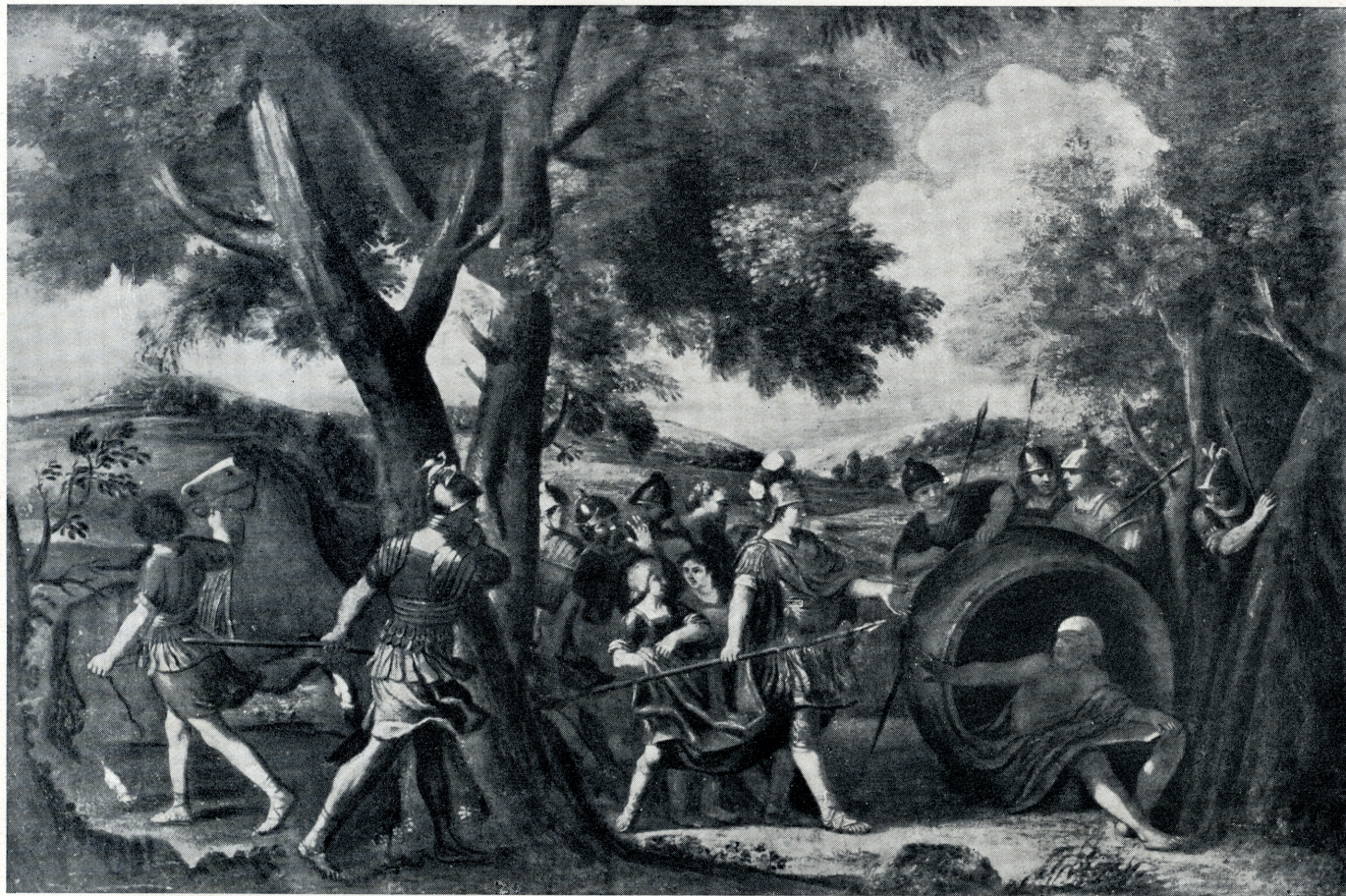
Alexandre et Diogène (après la restauration).