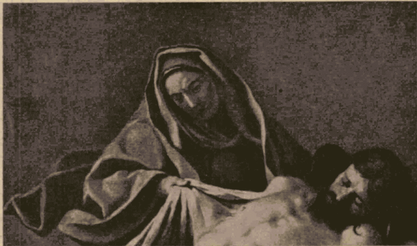
La mort du Christ (détail).

présente un jeu d'angles et de cassures bien faciles à analyser. Rapprochons-le de la draperie de Méléagre mourant. On tombera, je crois, aisément d'accord pour découvrir dans les plis près du genou une succession d'angles obtus ayant sensiblement les mêmes ouvertures que ceux du manteau d'Alexandre, avec des brisures pareillement arrondies. L'analogie de style est plus patente cependant avec la draperie de la vierge dans le „Christ“ mort du Louvre. La comparaison nous intéresse ici d'autant plus que cette dernière peinture est de quelques années antérieure au „Diogène“