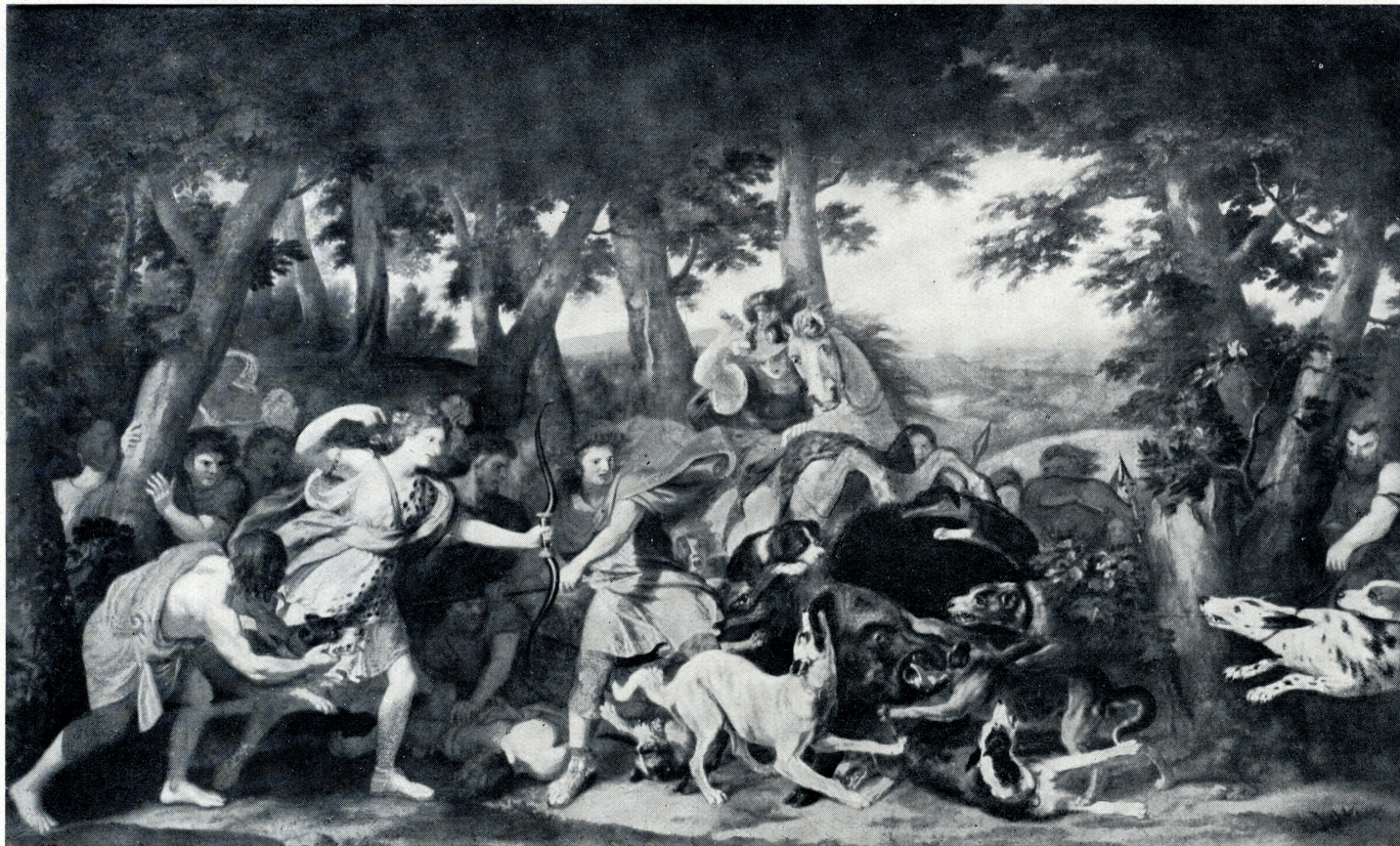
La Chasse de Méléagre.