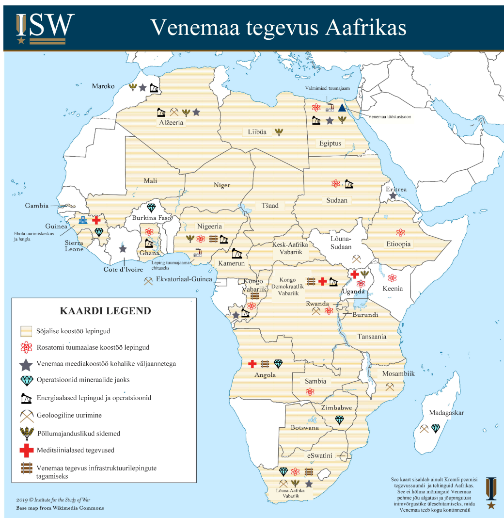
Joonis 2. Venemaa tegevus Aafrika riikides 2019.

Neljandaks kasutab Venemaa oma mõjutustegevuse osana ära Aafrika läänevastaseid meeleolusid, kujutades Aafrika avalikkusele Läänt kui imperialistlikku ja ekspluateerivat jõudu, samas kui Venemaa on imperialismivastane ning toetab mitmepoolsust ja mittesekkumist. Venemaad kujutatakse Lääne liberaalsetele väärtustele vastanduvat jõudu, mis on avatud kõikide Aafrika riikidega suhtlemisele ning erinevalt Läänest ei sea nendega koostöö tegemisele karne eeltingimusi (Issaev et al. 429; Antwi-Boasiako 2022, 474). Nimetatud pehme jõu mehhanismid moodustavad oma märgatava rolli tõttu kolmanda kategooria, mida töö tippkohtumiste sõnavõttudes ja avaldustes analüüsib.