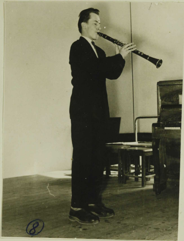
Leo Nõmm I Keskkooli klarinetisolist (saavutas nooli- meede vabariiklised isetegevuse ulvvaatu- sed 1959. a. I uohas)