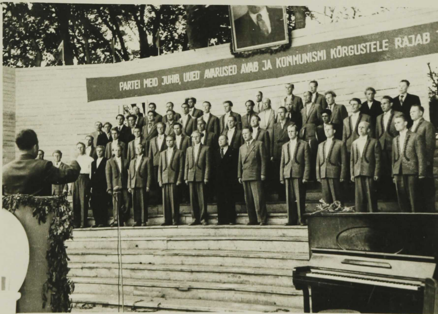
Kingissepa, Rajooni Kultuurimaja meeskoor.