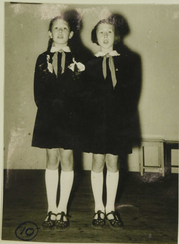
õed Tõkmanid Mihelkonna M-kol. kol. (saavutand vaba- riiklised ulvvaatuse I uohas)