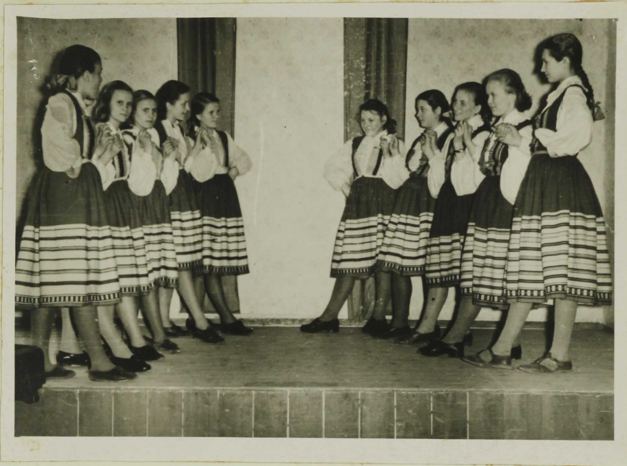
Pioneeride nojad rahvodaansuring