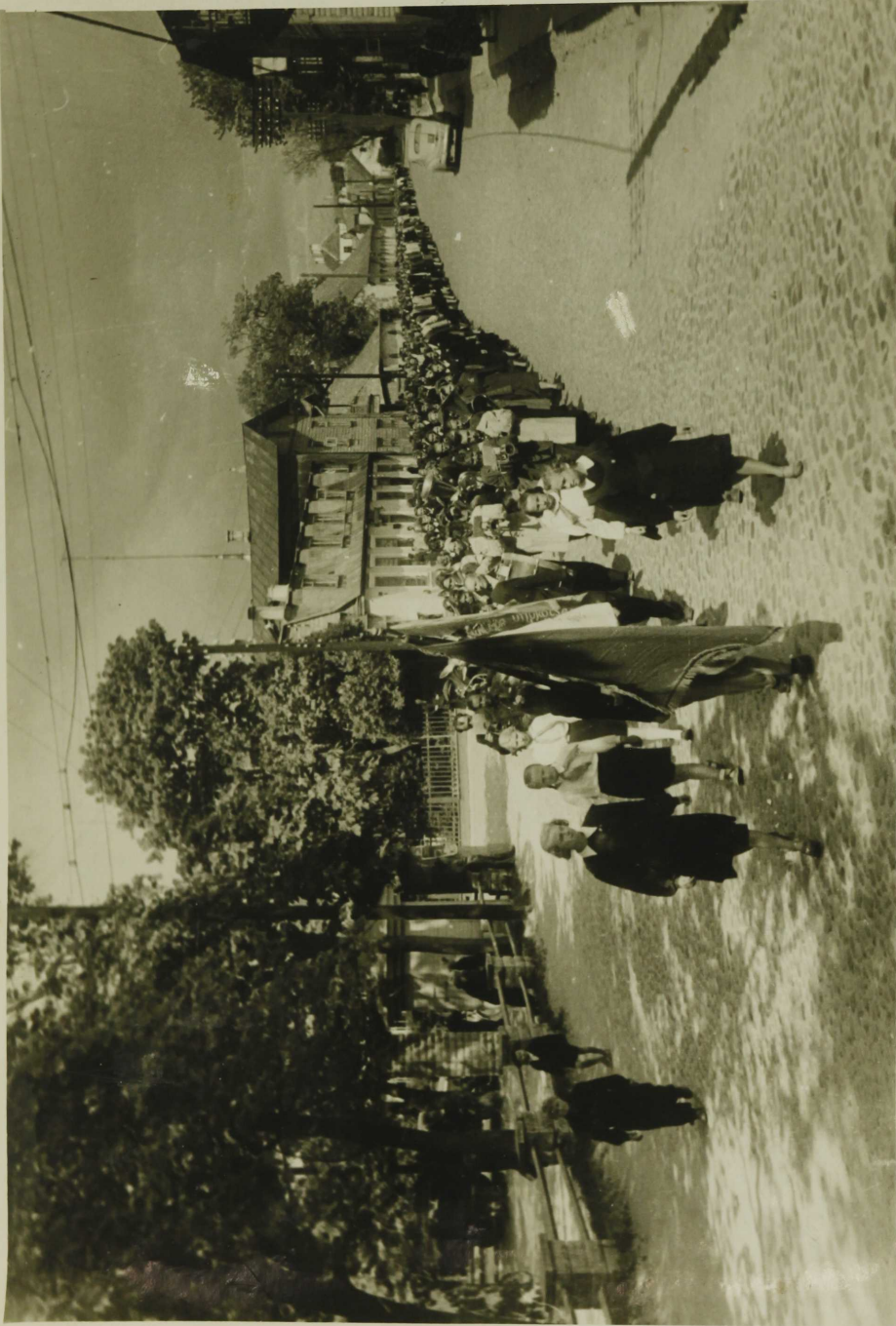
I Kansakoulis on traditsioonis saanud viima - se koolipäevale korraldada pidulik kongkääri läbi linna.