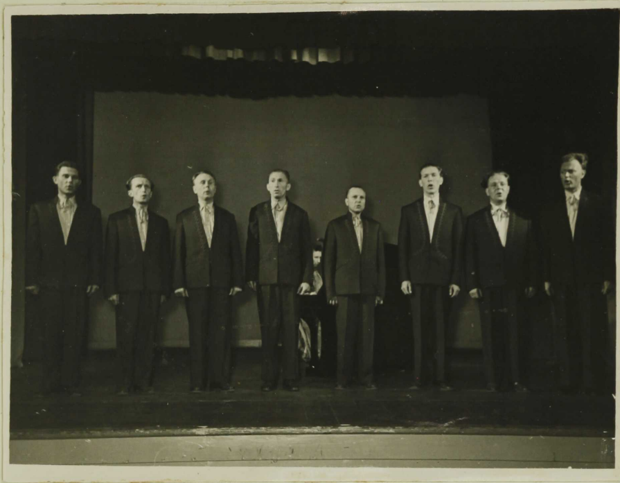
Rajooni kultuurimaja meeskvaritett