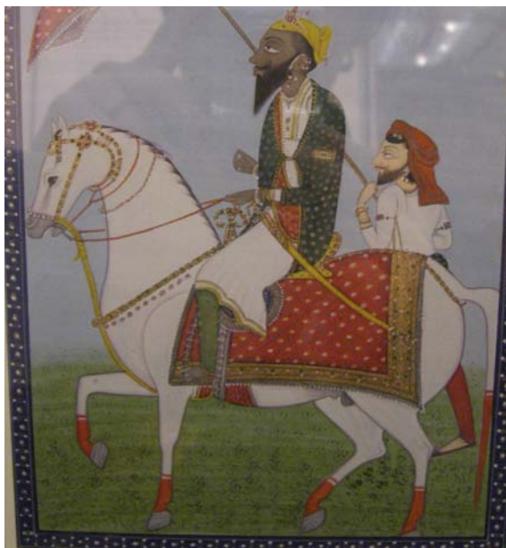
Hennatatud hobune, 18. saj India miniatuur, Victoria ja Alberti muuseum.