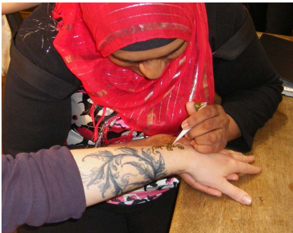
Henna pealekandmine. Sinine taimekujutis on indigo.