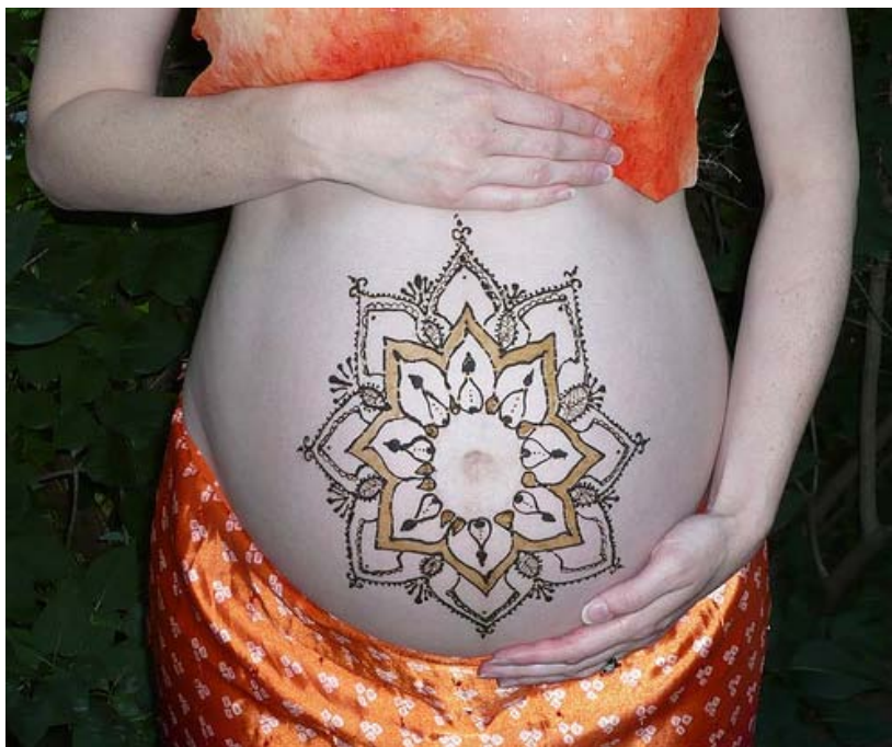
Belly-blessing. Kahekordne toonimine.