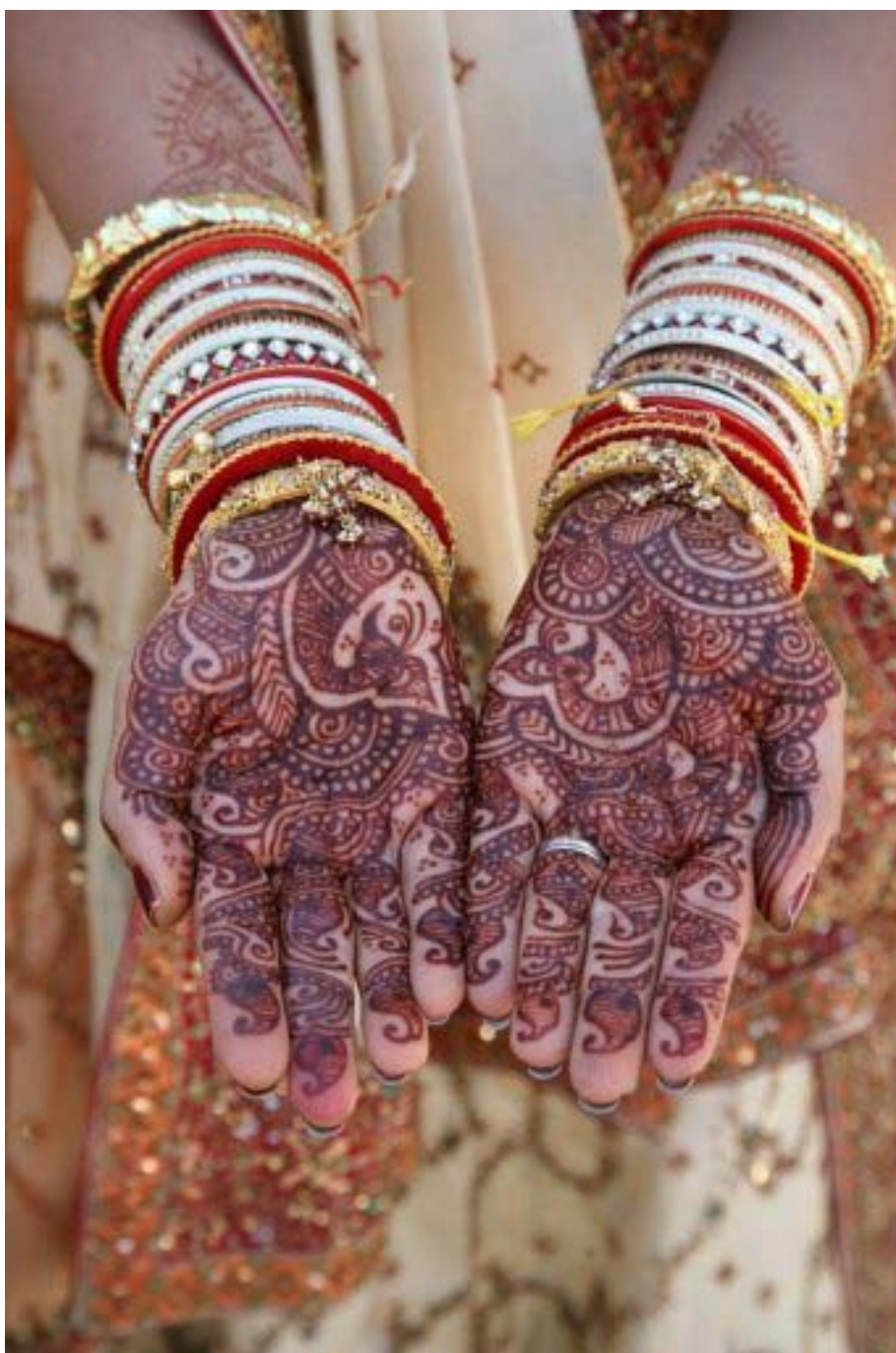
India pulmahenna. Autor: Kim Brennan