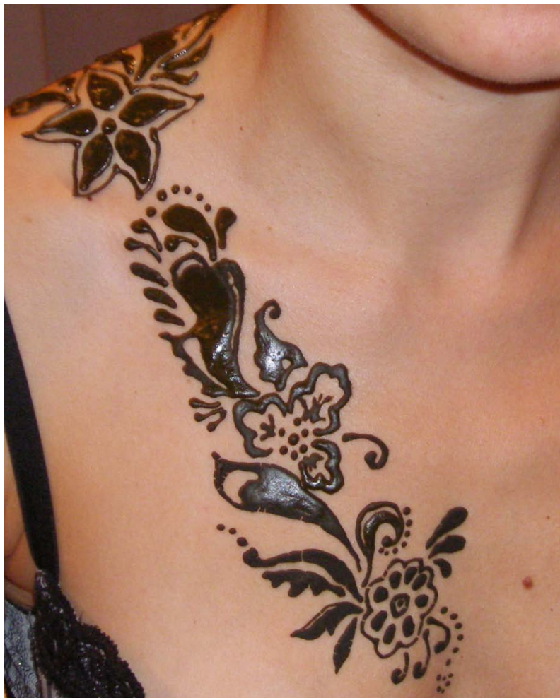
Islami stiilis taimornament, pasta peal. Autori erakogu