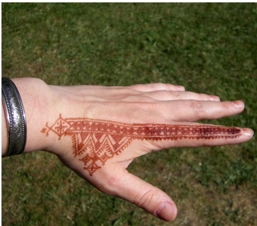
Põhja-Aafrika stiil.