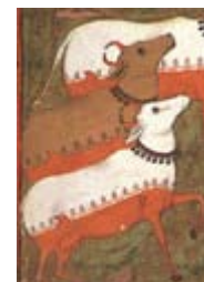
Hennatatud lehmad