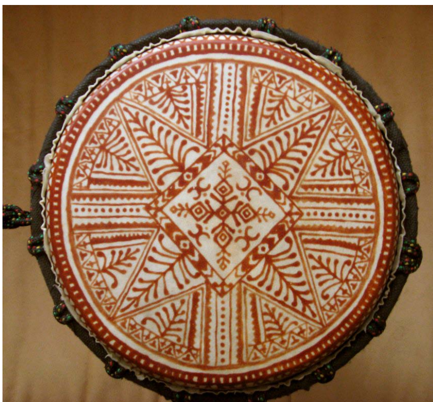
Hennatatud trumm, Põhja-Aafrika stiil ja Eesti koekirjade segu. Autori erakogu