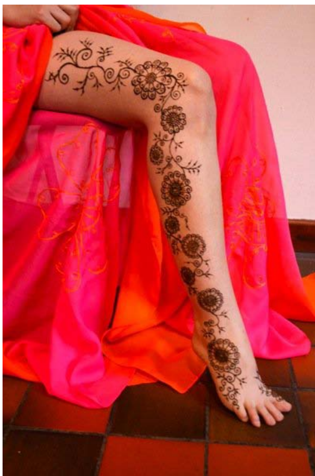
Kaasaegne henna. Autor: Catharine Hinton.