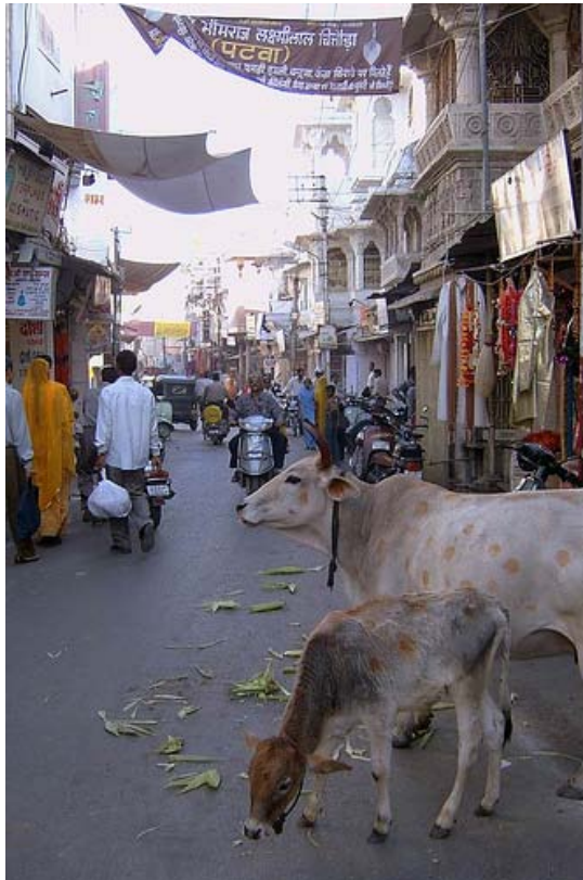
Hennatatud lehmad, ilmselt nahahaiguse tõttu.