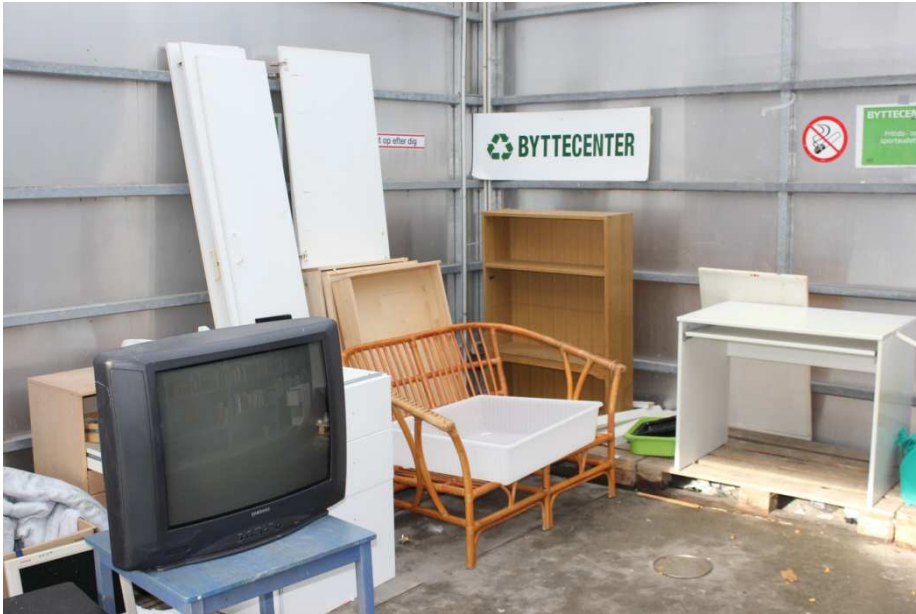
Foto 4. Vahetuskeskuse mööbli ladustamiseks ette nähtud ala.