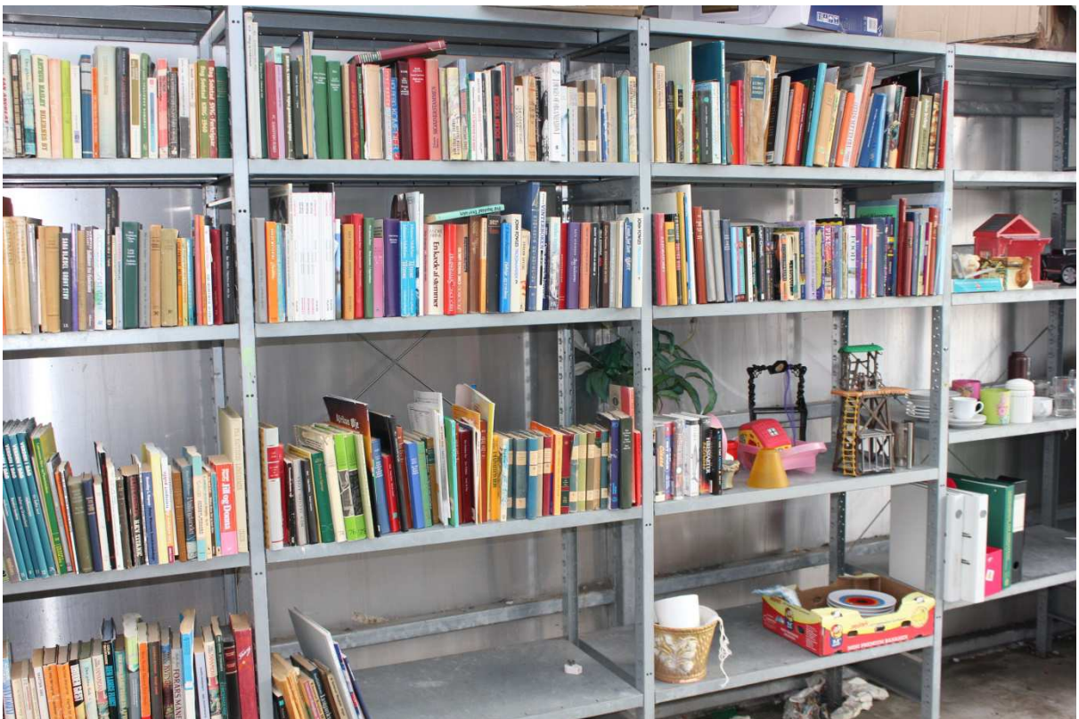
Foto 5. Vahetuskeskuse raamatute jaoks ette nähtud riiulid.