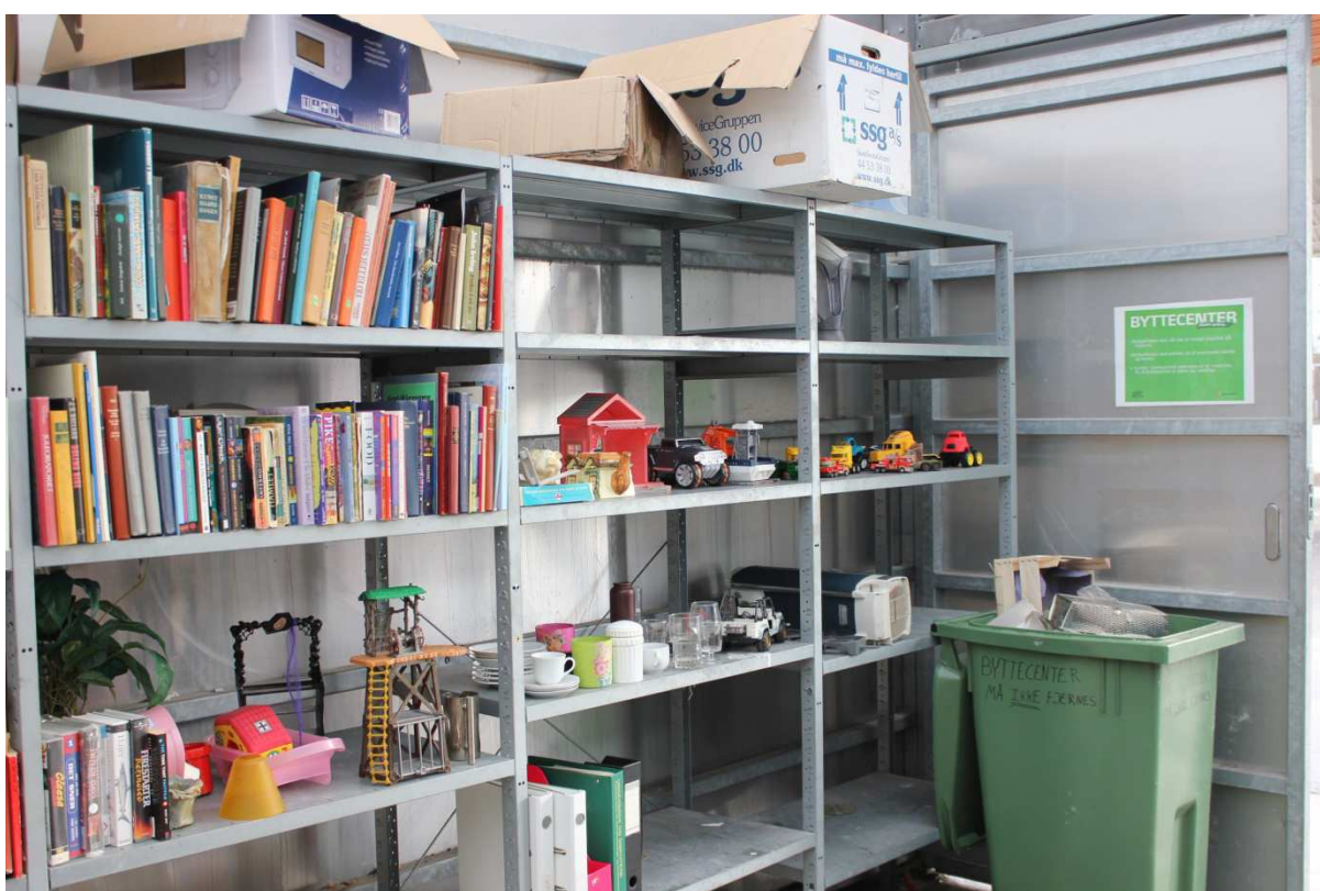
Foto 3. Vahetuskeskuse väiksemate objektide ladustamiseks ettenähtud riiulid.