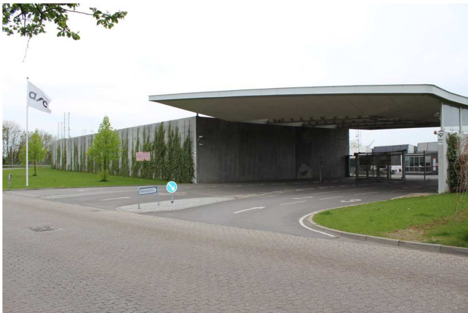
Foto 2. Sissesõit Borgervængeti vahetuskeskusesse.