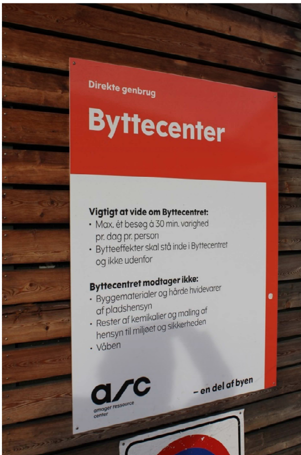
Foto 7. Vahetuskeskuse reeglistik.