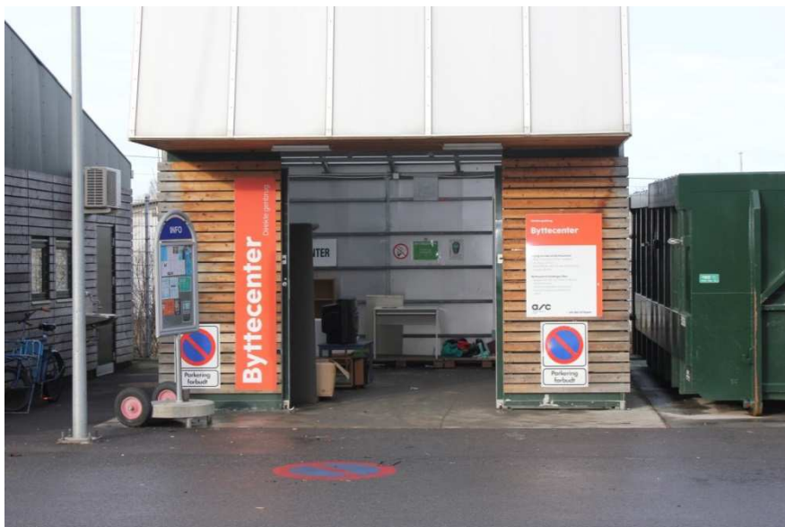
Foto 1. Borgervængeti vahetuskeskus.

Kopenhaagenis tegutsesid välitöö tegemise ajal ehk 2014. aasta lõpus ning 2015. aasta alguses neli ARC vahetuskeskust, mis oma asukoha tänava järgi kandsid Vermlandsgade, Kulbanevej, Borgervængeti ja Bispeengeni nimetust. Välitööks sai valitud Borgervængeti vahetuskeskus (vt fotot 1). Parema ülevaate saamiseks olen põgusalt külastanud ka teisi vahetuskeskusi.