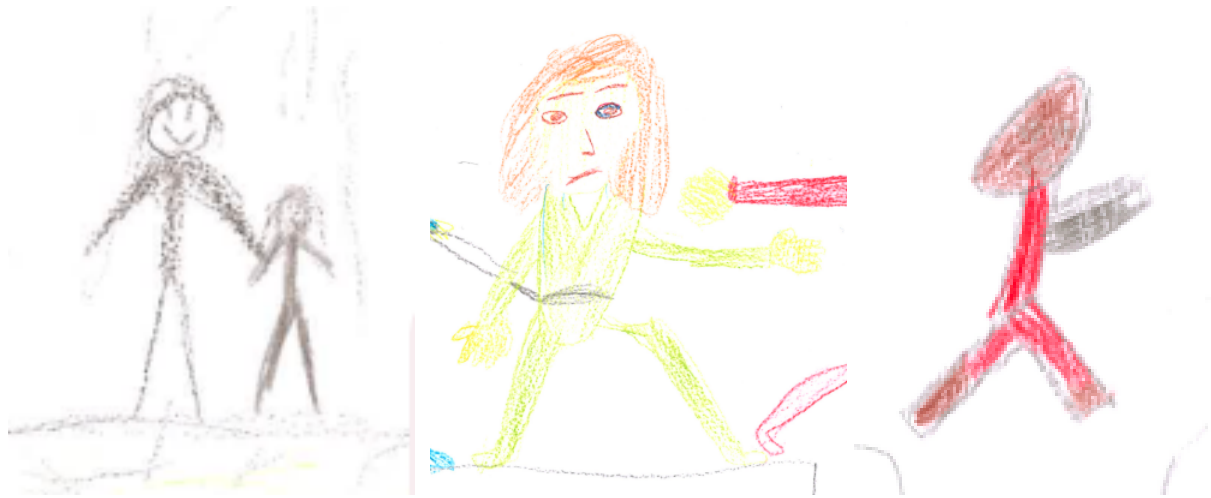
Lisa 2. Positiivselt kodeeritud emotsiooniga näo, negatiivselt kodeeritud emotsiooniga näo ja kodeerimata jäetud näo näited.