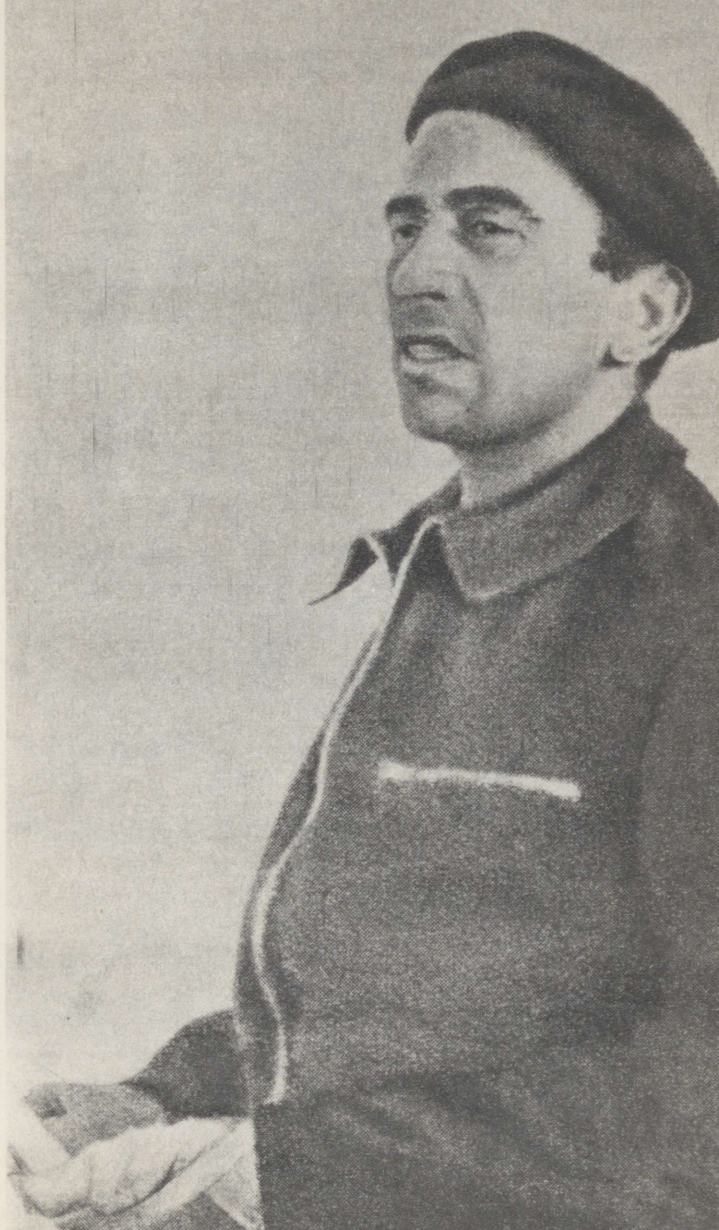
Luigi Longo Hispaania kodusõja päevil.