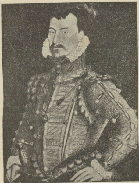
Lord Robert Dudley.

Robsart'i õnnetu surm 1560. a. sügisel põhjustas kuul- duste tekkimist, nagu oleks Dudley surmanud oma abikaasa Elisabethi kaasteadmisel, et luua endale või- malusi abiellumiseks kuningannaga. Olles teadlik ava- liku arvamuse vaateist, ei riskinud Elisabeth abielluda Dudley'ga. Rahva poolehoidu eelistas ta isiklikule