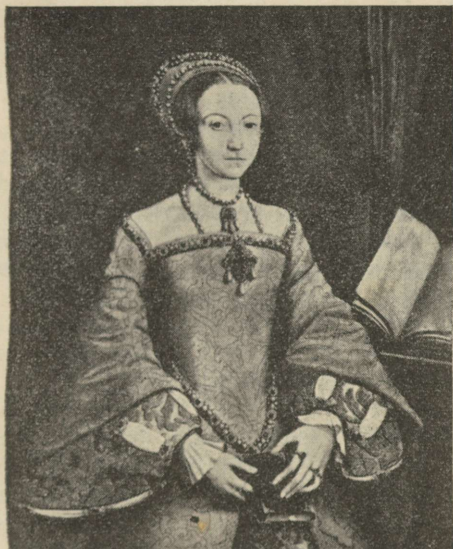
Elisabeth umb. 13-aastasena.

gemale. Ilusa välimuse ja meeldiva esinemise tõttu lootis ta abiellumisega rajada tee oma tõusule. Kandi- daatiteks valis ta endale Henry VIII mõlemad tütred, printsess Mary ja Elisabethi. Kohe pärast Henry VIII surma Thomas Seymour nõutas regent-nõukogult luba abiellumiseks Elisabethiga. Nõukogu liikmed, eriti