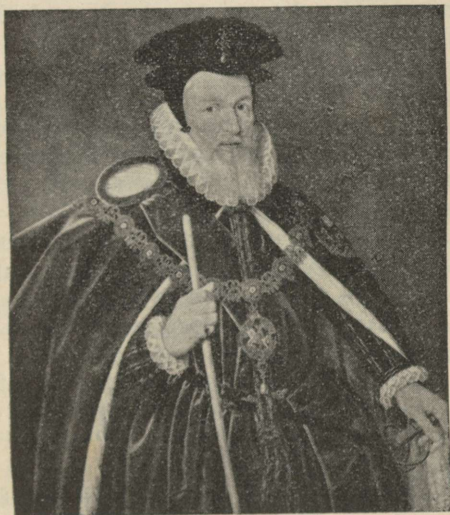
William Cecil, lord Burghley.

Kuninganna Mary surm vabastas Inglismaa aastaid kestnud survest. Rõõmutunne valdas rahvast. Needsamad kirikukellad, mis kuue aasta eest olid triumfeerivalt kuulutanud Mary troonileastumist, teatasid nüüd võidurõõmsalt inglasile ta valitsuse lõppu.