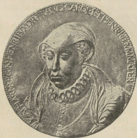
Katariina di Medici.

meelepaha inglise rahvas abikaasaga, kes oleks avalikult osa võtnud seni riigis keelatud katoliku jumalateenistusest. Ta soovis, et Anjou hertsog vähemalt ametlikult alluks anglikaani kirikule, leides, et hertsogil olevat kerge kohaneda uue kirikuga, mille rituaalne külg ei erinevat palju katoliku kiriku omast. Guise'ide mõjustusel, kes koos paavsti ja Philipp II-ga agiteerisid abielu vastu, oli Anjou hertsog järeleand-