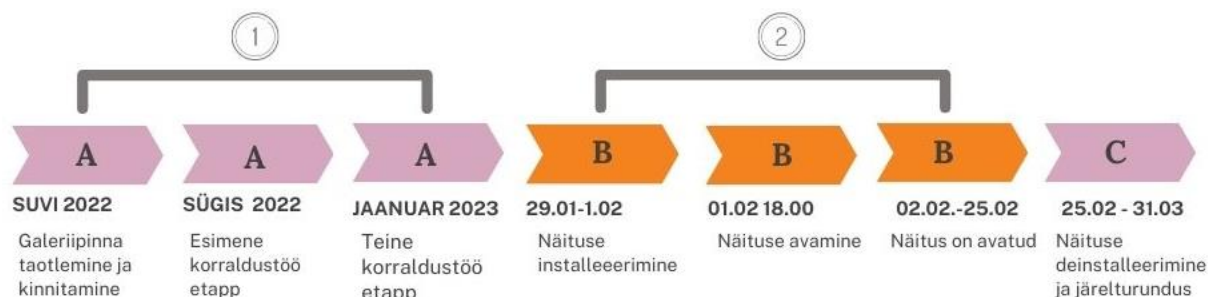
Joonis 1: Korraldustöö etapid

Mind kutsuti antud näituseprojekti juhtima 2022. aasta oktoobris. Sellele eelnevalt olid kunstnikud ühiselt läbi viinud näituseprojekti Saksamaal ning kogedes korralduse keerukust, soovisid nad Eestis näituse edasiarendusel kaasata protsessi ka kultuurikorraldaja. Esiteks on näituse korraldamisega väga palju tööd ning abikäed on teretulnud ning teiseks kipub inimeste vahel, kes on projektis samal positsioonil, tekkima konflikte. Seega liitusin protsessiga teises etapis, kui Pärnu Linnagalerii oli juba näitusepinna kinnitanud ning seega olid korralduskoht ning osalevad kunstnikud paigas.