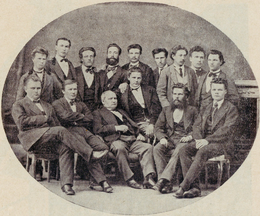
Grupp EÜS-i liikmeid 1874. a.