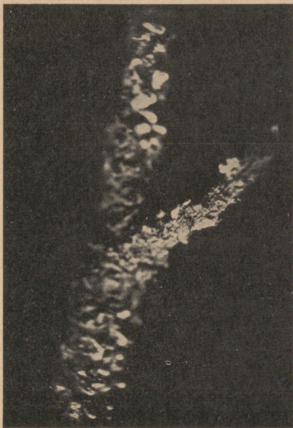
Pilt. 2. Peridermium pini f. corticola kevadeoste põied kuueaastasel männioksal. Sporenlager des Kiefernblasenrostes im Juni an dem 6-jährigen Kiefernweig.

Huvitav on seejuures, et eoste põiekesed leidusid tüvel peaaegu eranditult männaste kohal, s. o. kõrvalokste kinnituskohal. Val-