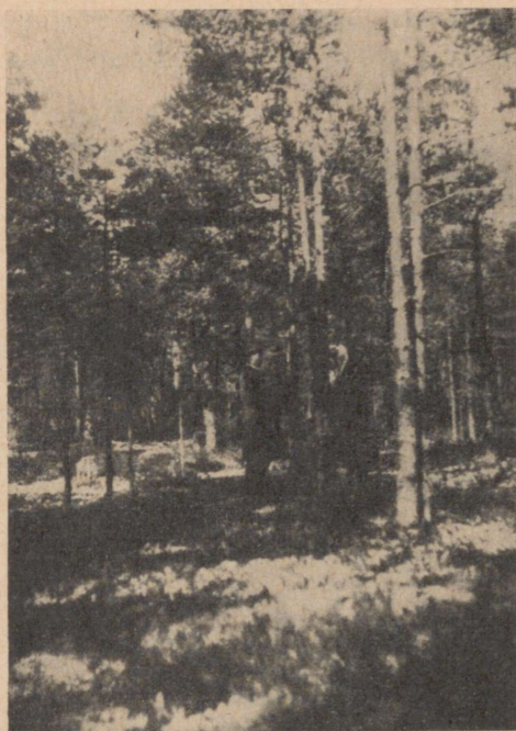
Pilt 6. 45-aast. männipuistu. Keskm. kõrgus — 8 m. Täius — 0,5. Puistu hõredus on põhjustatud peamiselt koorepõletikust. Sagadi metsandik, kv. 65. 45-jähriger Kiefernbestand, Mittelhöhe 8 m. Bestockungsgrad 0,5, welcher vom Kiefernblasenrost bedingt ist. Forstrevier Sagadi, Jag. 65.

Viimane proov erineb esimestest sellega, et puud on võrdlemisi suuremad ja koorepõletik omab paljudel puudel harilikku ilmet: s. t. haigestumine on alanud tüve ühel küljel ja on pikemaaline,