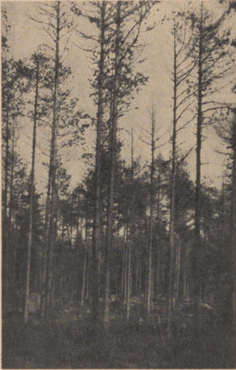
Pilt 9. 45-a. männipuistu. Fidonia piniaria ja Peridermium pini poolt vigastatud. Puude kuivamisel kaasa mõjunud Myelophilus piniperda . Käsmu vahtkond, kv. 19.

milline asjaolu tõendab, et niineüraskidki teevad siin oma tööd. Kuivanud puid koorides võis igal pool koore all märgata Myelophilus piniperda käike. Pilt oli seega järgmine: männilookleja ja männikoorepõletiku tõttu vigastati ladvakasv suurel määral, sellele järgnes niineüraski täiendava toitmise puhul ellujäänud ladvakasvude