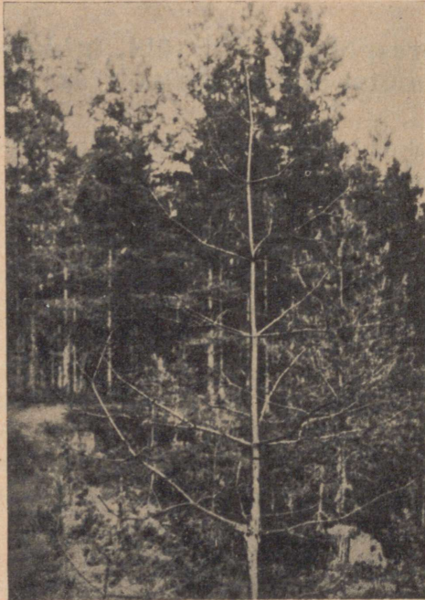
Pilt 1. Koorepõletik 20-aast. männil. Seene asukoht 7. aastakasvu pealmises osas. Käsmu vahtkond.

Eoste laialipudenemisel oli ladvaosa veel täiesti roheline, alles augustikuu teisel poolel muutusid pealpool vigastatud kohta okkad kogu ladva ulatuses punaseks. Punased okkad püsisid puu küljes