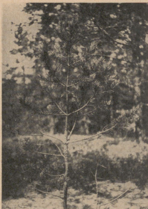
Pilt 7. 15-a. männi ladvaosa. 6. aastakasvu alumises osas on koorepõletik; latv pealpool haigestumist on veel roheliste okastega. Kronenteil einer 15-jährigen Kiefer. Am Basalteil des 6. Jahrtriebes befindet sich der Herd vom Kiefernblasenrost, oberhalb desselben sind die Nadeln noch grün.

avaldanud mõju pikkusekasvule. Tüve läbimõõt haigestunud kohal kõigub 2—4 sm vahel, üksikutel juhtudel tugevamatel hea kasvuga puudel tõuseb see isegi üle 5 sm. Haigestunud kohal läbimõõd kooretursumise tõttu on umbes 1—1½ sm paksem läbimõõdust allpool haigestunud kohta.