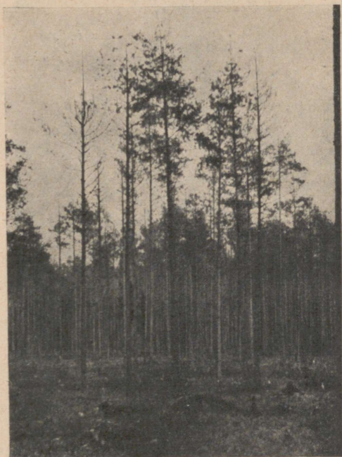
Pilt 8. 35-a. männipuistu. Haigestunud Fidonia piniaria ja Peridermium pini tagajärjel ja lõplikult hävinud Myelophilus piniperda rüüste puhul. Käsmu vahtkond, kv. 20.

35-jähriger Kiefernbestand, der infolge Fidonia piniaria und Peridermium pini kränkelte und durch Myelophilus piniperda völlig einging. Schutzbezirk Käsmu, Jag. 20.