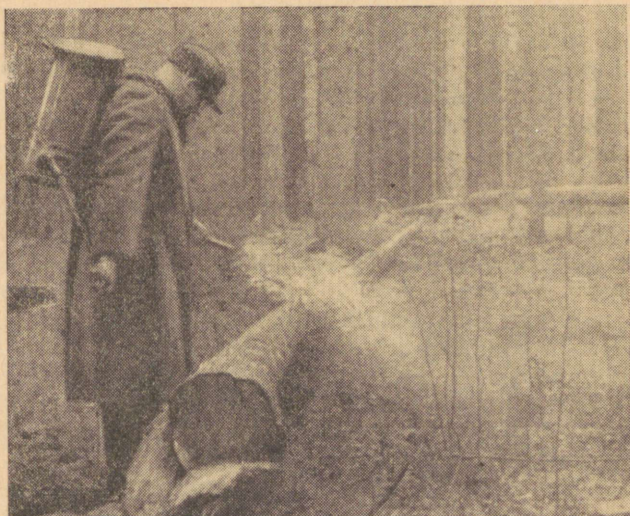
Joon. 2. Püünispuude tolmutamine heksaklooraani preparaadiga Peedu metskonna Kulbimäe vahtkonnas (I grupi metsas).