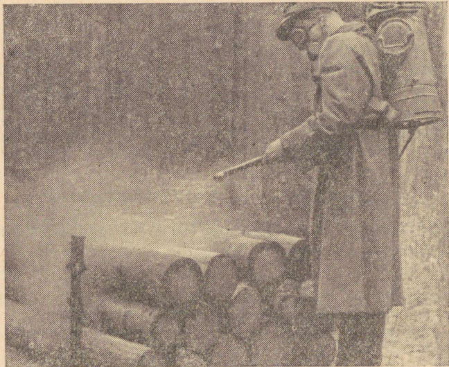
Joon. 3. Sanitaarraie materjalide tolmutamine heksakloraani tolmpreparaadiga Peedu metskonna Kulbimäe vahtkonnas.