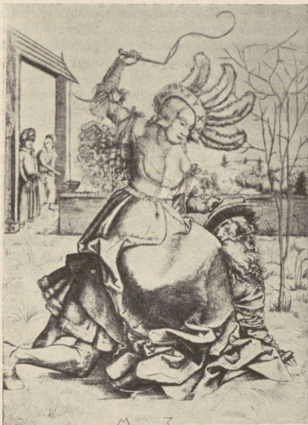
Aristoteles ja ta naine Phyllis (karikatuur antiikse anekdoodi järgi).

suur, asendatagu laste tapmise õel tegelus abordiga; ja „abort toimugu enne, kui on alanud aistimine ja