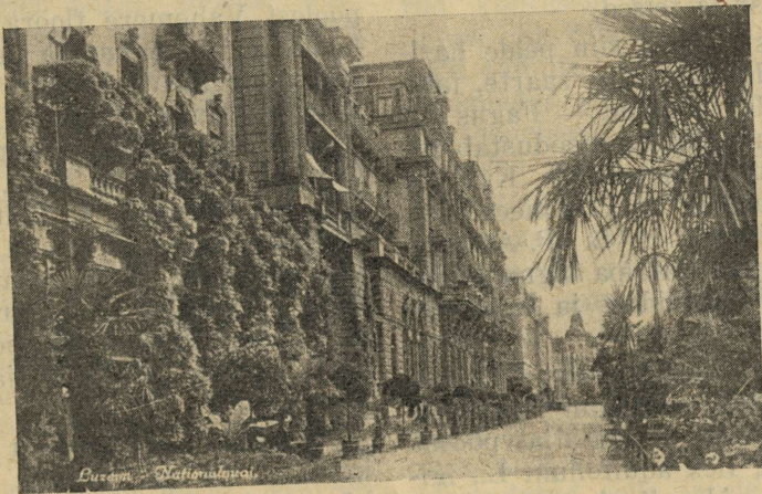
Luzern, Nationalquai. Šveitsi tinnadele tüübiline tänava ja majade dekoratsioon.

Sagedase dekoratsioonipuuna esineb siin ka meil nii haruldane ja ga-