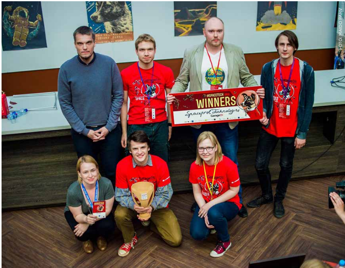
TÜ NOORTE MATERJALITEADLASTE LOODUD SPACEPROT TECHNOLOGIES TÖÖRÜHM.