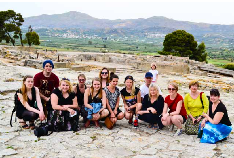
KLASSIKUTE REISELTSKOND DIKTE PLATOOL.

» Kuna õõbisime Kreeta koor- ja sadamalinnas Herso-nissoses, kus turismihooaeg oli alles algamas, sai meie rühmast õige pea kohalike lemmik. Kellele meeldisid meie õhtused laulud muulil (üks paadimees pakkus meile ilusa laulu eest suisa banaane), kellele blondid eesti tüdrukud, kellele aga meie huvitava ja sädistava keele kõla. «Tere, eestlased, teen teile soodsad hinnad!» kõlas peaaegu iga nurga peal.