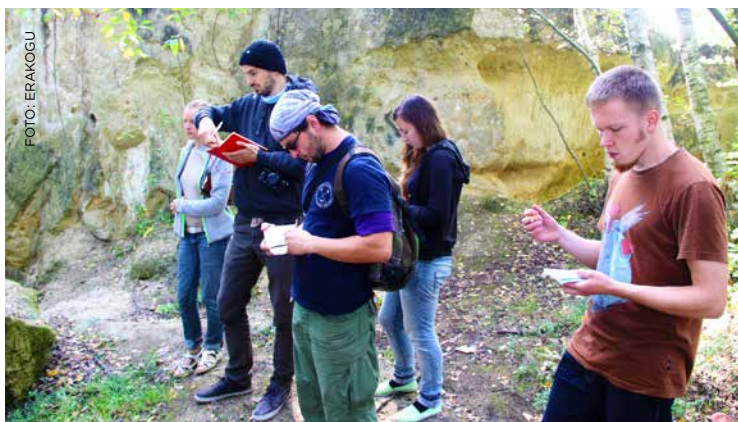
GEOLOOGIDE PRAKTIKAGRUPP 2014. AASTAL TŠEHHIMAAL PRAHA LÄHEDEL SILURI VANUSEGA KIVIMITE KARJÄÄRIS.

Ka botaanikatudengid külas- tasid varem Nõukogude Liidu erinevaid paiku. Neljanda kursuse suve nn vööndilisel praktikumil käidi Karjalas, Kesk-Aasias, Po- laar-Uraalis, Kaug-Idas, stepi-