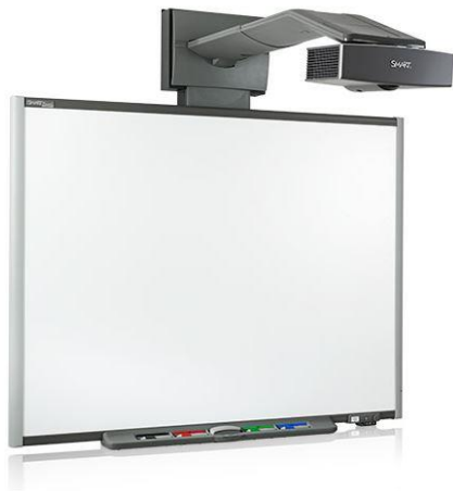
Joonis 1. SMART Board 600i. Õpetaja A interaktiivne tahvel (Telda OÜ, 2015e)

Õpetaja A töötab põhikoolis ja õpetab 7.–8. klassi. Tema kasutab SMART firma interaktiivset tahvlit. Õpetaja on seda nimetatud tahvlit kasutanud ligikaudu seitse aastat. Õpetaja B töötab gümnaasiumis ja õpetab 9.–12. klassi. Tema kasutab Optoma firma interaktiivset projektorit. Õpetaja on seda nimetatud projektorit kasutanud ligikaudu viis kuud. Mõlemad õpetajad töötavad erinevates maakondades ja väljaspool Tartu maakonda.