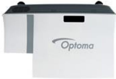
Joonis 2. Optoma W307USTi. Õpetaja B interaktiivne projektor (Optoma, 2015b)