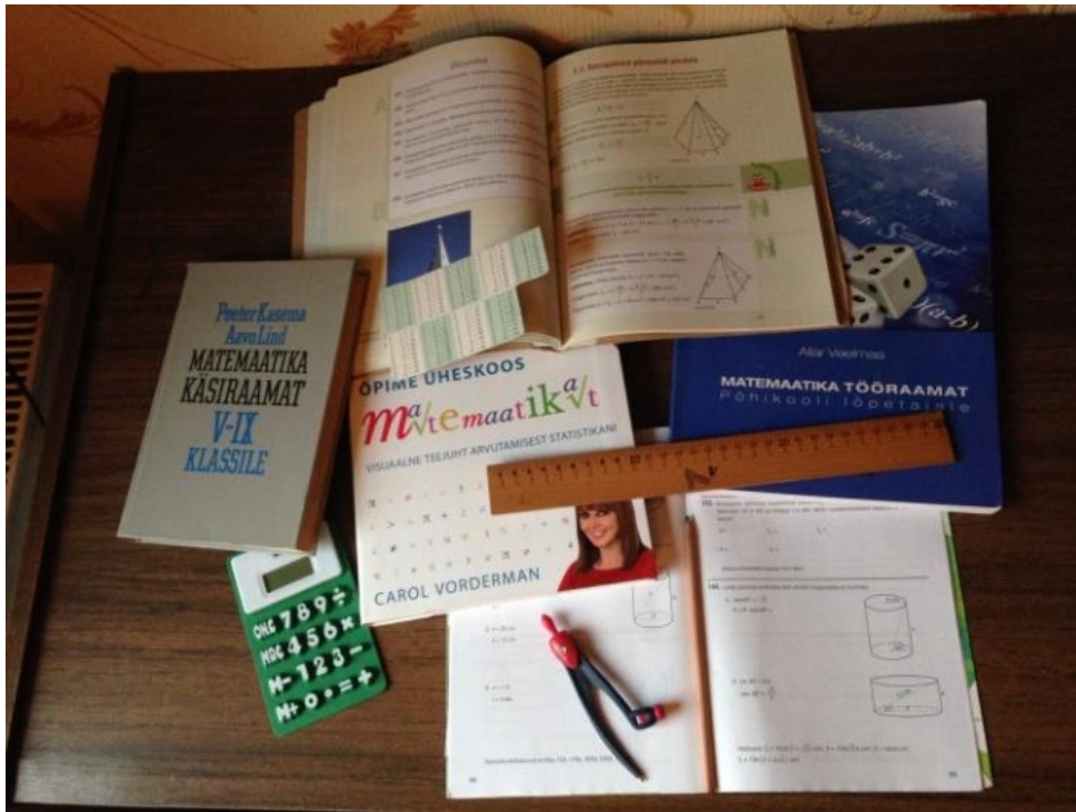
Joonis 7. Liisa arusaam matemaatikast