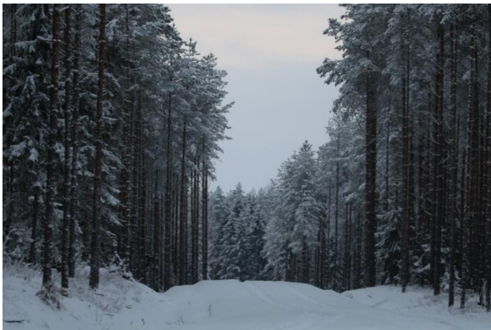
Joonis 1. Piia arusaam matemaatikast