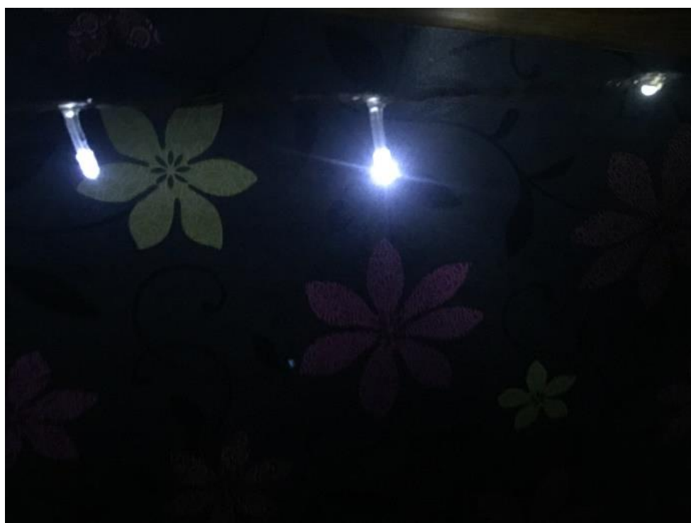
Joonis 4. Anni arusaam matemaatikast