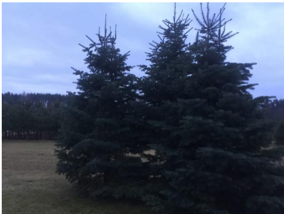
Joonis 5. Anni ideaalne õppekeskkond