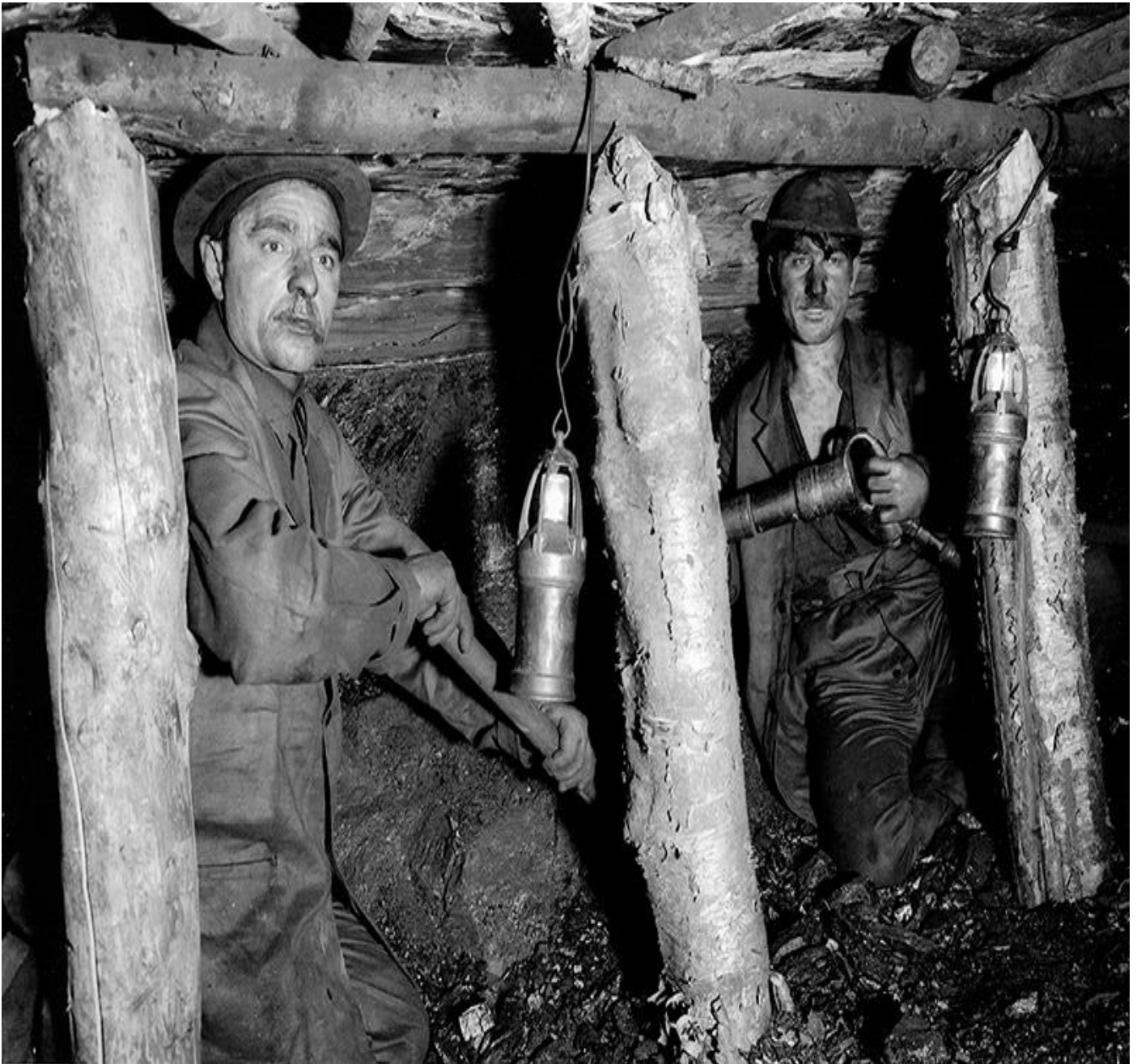
Lisa 3. Töötingimused kaevanduses