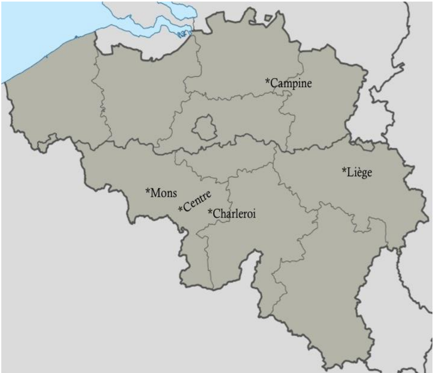
Lisa 1. Belgia peamised kivisöökaevandused