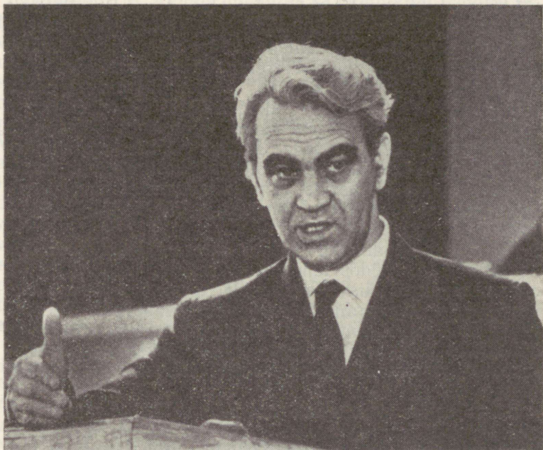
Akadeemik M. Keldõš Tallinnas esinemas.

sellega seoses pidaski presiidium otstarbekohaseks tutvuda koos NSV Liidu Ministrite Nõukogu Teaduslike Uurimistöõde Koordineerimise Riikliku Komiteega järkjärgult kõigi vabariikide akadeemiade ja NSV Liidu Teaduste Akadeemia tööga, vaadata, missugused on akadeemiade suhted tööstuse ja põllumajandusega, ning otsustada, mida tuleb teha, et teaduse edasine areng meie maal vastaks ülesannetele, mis partei tema ette on seadnud. Teadus areneb sõltumatult territoriaalsest paiknemisest, kuid teaduse ülesanded peavad eelkõige olema tihedasti seotud vabariigi majanduse arenguga. Ainult teaduse, tööstuse ja põllumajanduse tihe omavaheline läbipõimimine tagab teaduse arengu, temale tänapäeva nõuetele vastava baasi rajamise.