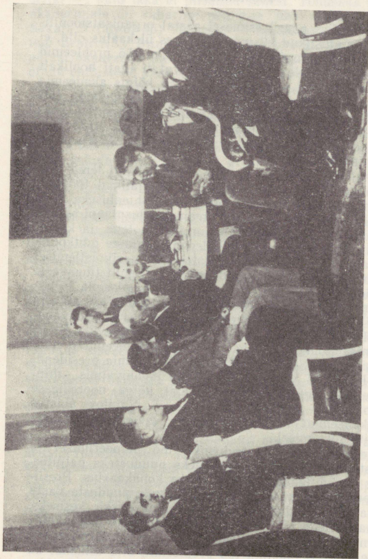
Liiduvabariikide Teaduste Akadeemiate Teadusliku Tegevuse Koordineerimise Nõukogu viiendalt sessioonilt 17—18. maini 1949. Vaheajal mõtteid vahetamas. Paremalt teine NSV Liidu Teaduste Akadeemia president S. Vavilov, vasakult teine Eestli NSV Teaduste Akadeemia president H. Kruus.