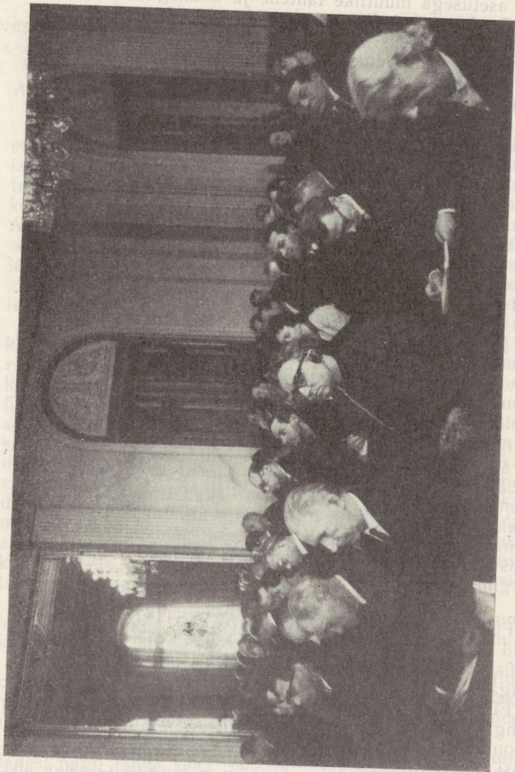
Eesti NSV Teaduste Akadeemia üldkogu istung 26. märtsil 1969.

... ja metatavalikaks ehituse ning arengu turunduse ... ja metatavalikaks ehituse ning arengu turunduse ... ja metatavalikaks ehituse ning arengu turunduse