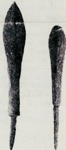
Rauast nooleotsi Iru linnusest.

Ette tellida võib ka järelmaksuga, sellest postkaardiga Seltsile tellija nime ja aadressi (selgesti!) äramärgimisega teatades, kuid sel juhul maksab eksemplar kr. 5.25.