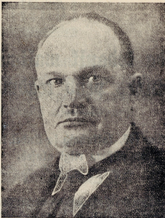
Konstantin Päts — põllumeeste juht, end. riigivanem.

Õnn, parem elu ja majandusline tõus ei lange meile mitte õhust sülle, vaid see on päsiwa ja sihikindla töö wili !