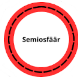
Joonis 1. Abjekti positsioon semiosfääris.

Paigutan abjekti Lotmani semiosfääri järgmiselt (vaata joonist 1). Semiosfäär on piiratud katkendliku joonega võrsemiootilisest sfäärist; abjekt paikneb alas, mis on märgitud punasega. Abjekt asub korraga nii semiosfääri perifeerias kui ka võrsemiootilises ruumis – taoline duaalne positsioon liminaalses ruumis võimaldabki subjektil tajuda abjektsiooni.