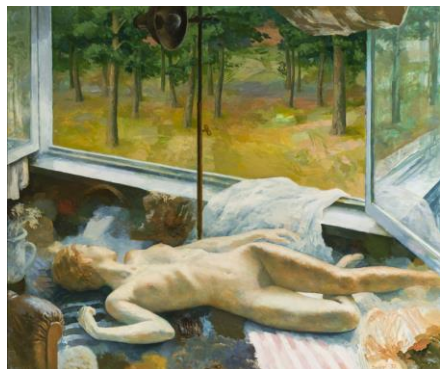
Foto 6: Tüdruk avatud akna all (EKM j 38405 M 6366); Eesti Kunstimuuseum SA; EKM38405_M06366_Subbi_O_Tüdruk_avatud_akna_all_ODS1178_t.jpg

Aktimaalija Olev Subbi 1977.aasta maal “Tüdruk avatud akna all”(Lisa 6) on tehtud temperatehnikas ning kujutab noort ilusat naist, kes oli mitmete tema maalide peategelane. Peale naiskuvandi on teosel kujutatud mitmeid eri kõrvalmotiive, jättes mulje, et tal ei lubata maalil üksi domineerida. Samuti esinevad maalil kunstniku tunnusmotiivid: suvepäev ja päevavalgus. 69