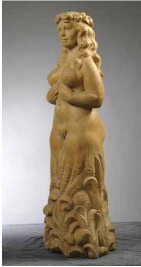
Foto 10: Viljakus (EKM j 17016 S 1182); Eesti Kunstimuuseum SA; EKMj17016S1182_1_pisipilt.jpg

Ellen Kolki, keda peetakse esteetika tagasitoojaks skulptuuri, töid iseloomustasid väljaveetud vormid ning looduselemendid. Inspiratsiooni sai kunstnik antiikmütoloogiast ja allegoorilistest motiividest. 75 Sarnased aspektid esinevad tema 1974.aasta puuskulptuuris “Viljakus”(Lisa 10).