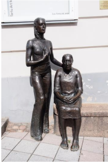
Foto 5: Maanaised (TKM TR 15440 S 630); Tartu Kunstimuuseum; TKMTR15440S630_2_pisipilt.jpg

Mare Mikof valmistas “Maanaiste”(Lisa 5) esimese versiooni kipsist 1974.aastal näituse “Inimene ja põld” jaoks. 1978.aastal valati skulptuur kultuuriministeeriumi otsusel pronksi ning 2013.aastal paigaldati see Tartu Kunstimuuseumi ette. 68