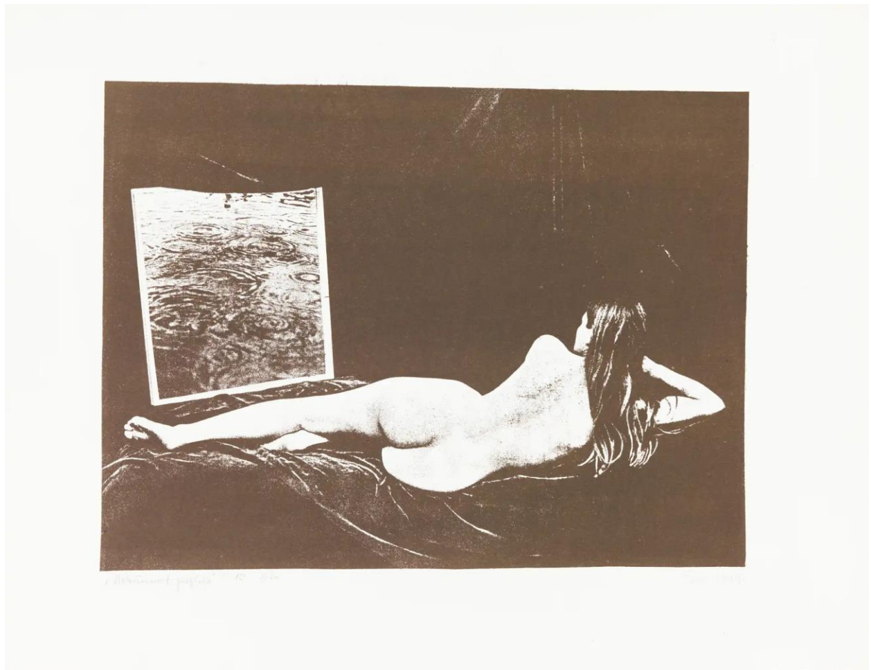
Lisa 8: VAIKELU PEEGLIGA 1979, LITOGRAAFIA, 46×60.2CM, EESTI KUNSTIMUUSEUM, https://sirjerunge.eu/et/works/still-life-with-a-mirror (27.03.2024)