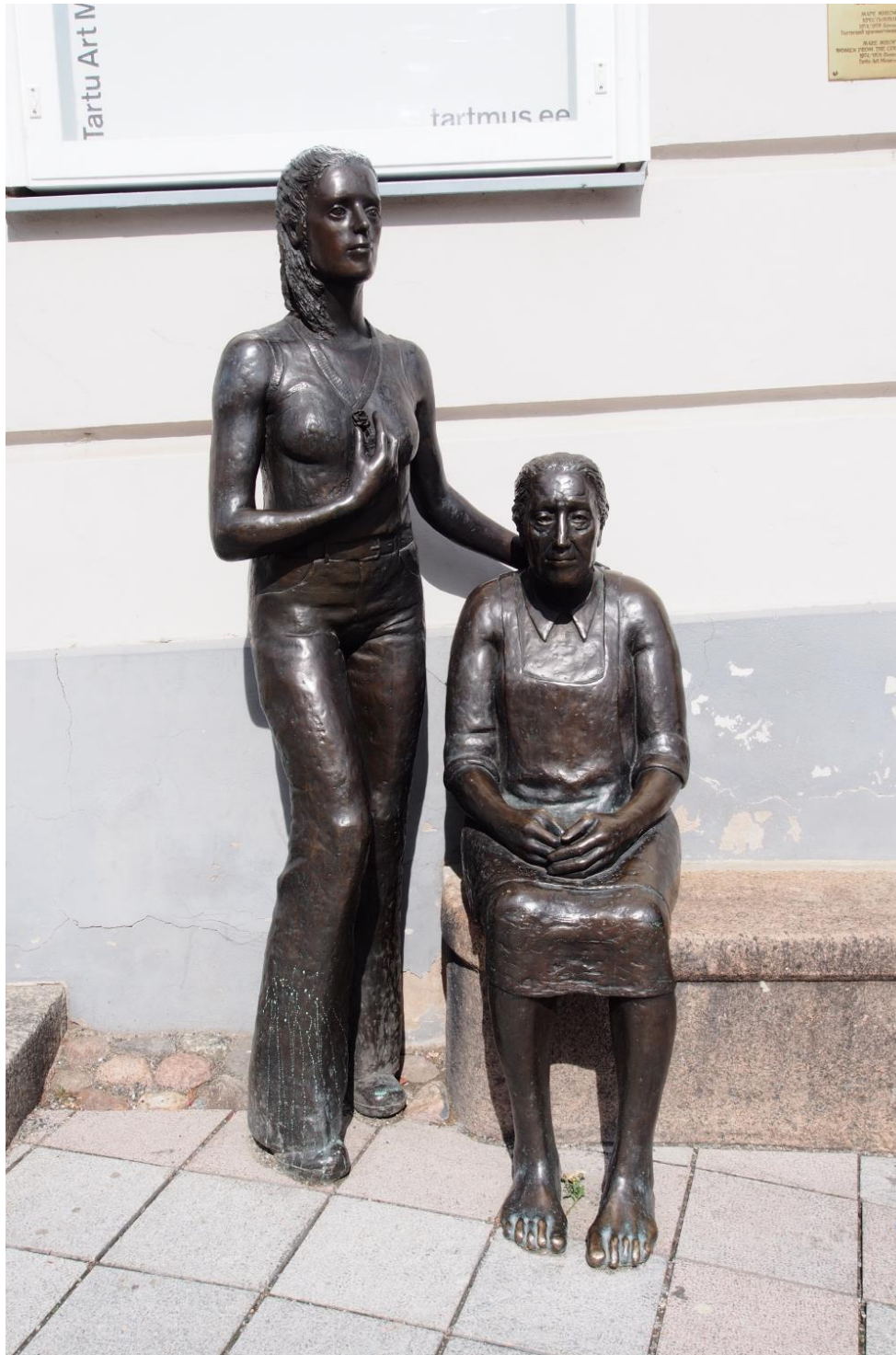
Lisa 5: Maanaised (TKM TR 15440 S 630); Tartu Kunstimuseum; TKMTR15440S630_2_pisipilt.jpg, https://www.muis.ee/et/museaalview/1474711 (27.03.2024)