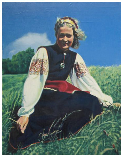
Foto 3: Eesti naine (EKM j 38407 M 6368); Eesti Kunstimuuseum SA; EKMj38407M6368_1_pisipilt.jpg

Tõnu Virve 1970ndate hüperrealismi töödes esines tugev sotsiaalne teravus. Eriti võimsalt väljendus see õlimaalis “Eesti naine”(Lisa 3), mis šokeeris oma radikaalse maaliuendusega toonast kunstnikkonda. Teos oli mitme allegooriakihiga, kriipides rahvuslikku nostalgiat Nõukogude Eesti rahvarõivalembuse kaudu. 66