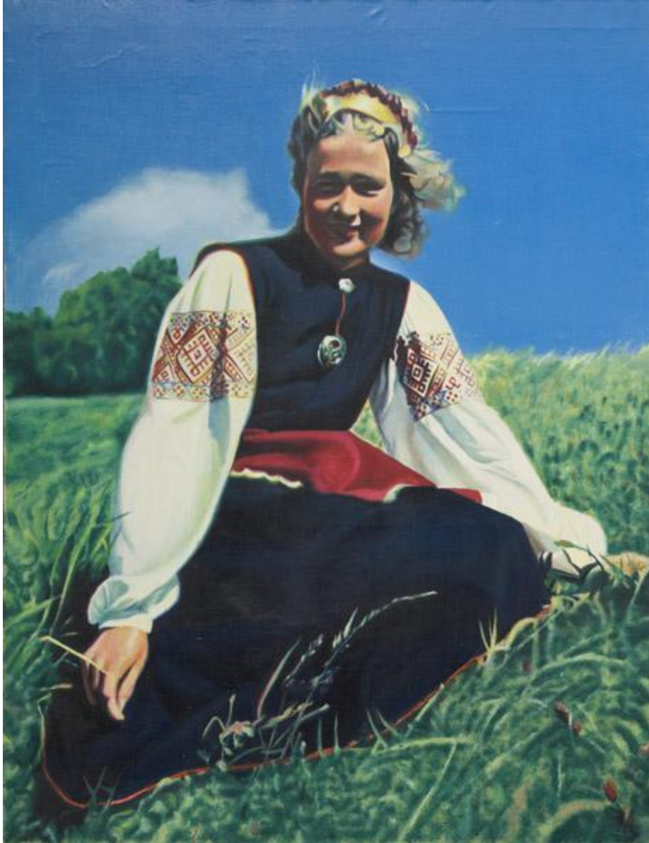
Lisa 3: Eesti naine (EKM j 38407 M 6368); EKMj38407M6368_1_pisipilt.jpg, https://www.muis.ee/museaalview/1447816 (27.03.2024)