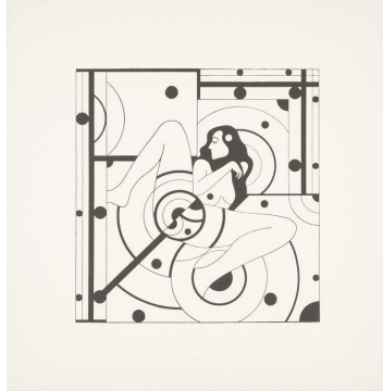
Foto 1: Naine-masin III (EKM j 42470 G 26167); Eesti Kunstimuuseum SA; EKMj42470G26167_1_pisipilt.jpg

L.Lapini 1975.aasta sügavtrükk “Naine-masin III”(Lisa 1) oli osa 1974.aastal alustatud samanimelisest seeriast, mis koosnes geomeetristest vormidest 62 , mida kunstnik nimetas inimliku-kosmilise energia visuaalväljundiks, 63 ning mida iseloomustas konstruktivistlike agregaatidega läbistatud erotiseeritud naisekeha. Lapini sõnul kujutas seeria kaasaja inimese võõrandumist ja mehhaniseerumist. Samas heideti talle ette naisekeha seksualiseerimist, mida võib toetada toona levinud “mehelik” lääne avangardkunst, mis naisi objektistas. 64