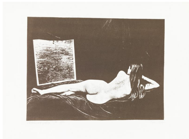
Foto 8: VAIKELU PEEGLIGA 1979, LITOGRAAFIA, 46×60.2CM, EESTI KUNSTIMUUSEUM

Sirje Runge jaoks olid 1970ndad eneseotsingu ajad: kümnendi alguses tõi ta eesti avangardi uue radikaalse laine. 70 Litograafiateos “Vaikelu peegliga”(Lisa 8) valmis aastal 1977 või 1978 ning kujutab kunstniku autoportreed aktina. Töö viitab D.Velazguezi teose “Veenus peegli ees” poosile, kus Veenus end peeglist silmitseb. Sedasi on Runge kahtluse alla seadnud naisidentiteedi ajaloolise konstruktsiooni, milles teda on nähtud enesekesksena. 71