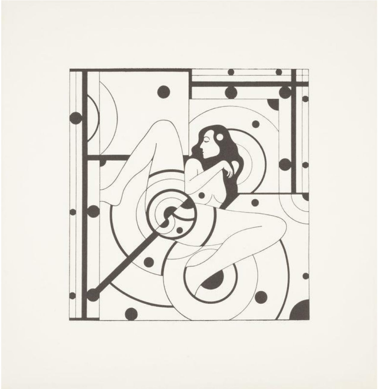
Lisa 1: Naine-masin III (EKM j 42470 G 26167); Eesti Kunstimuseum SA; EKMj42470G26167_1_pisipilt.jpg, https://www.muis.ee/museaalview/1499996 (27.03.2024)