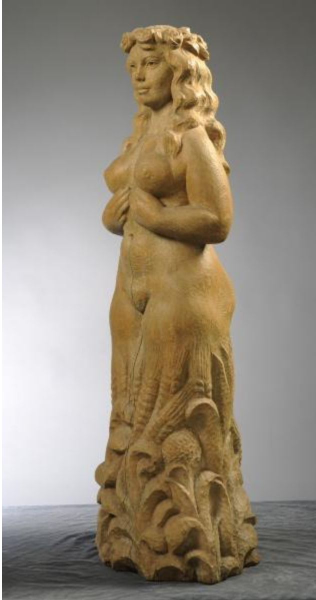
Lisa 10: Viljakus (EKM j 17016 S 1182); Eesti Kunstimuseum SA; EKMj17016S1182_1_pisipilt.jpg, https://www.muis.ee/et/museaalview/1446181 (27.03.2024)