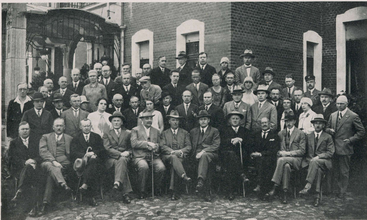
VII Eesti Arstidepäev Pärnus 29. ja 30. juulil 1928.