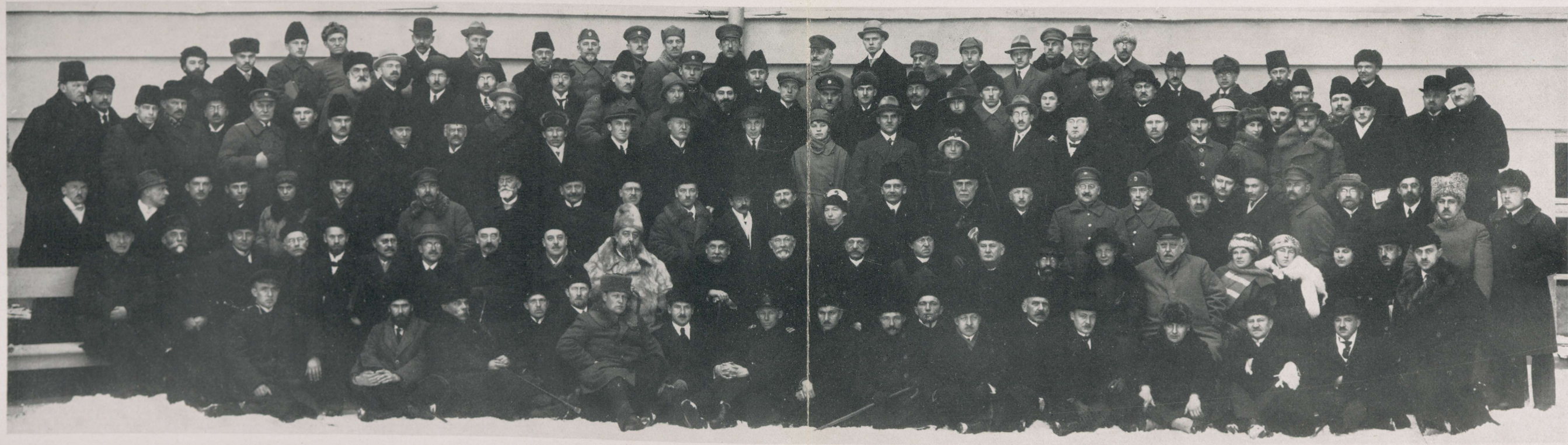
I Eesti Arstide Kongress Tartus 2.—4. dets. 1921.