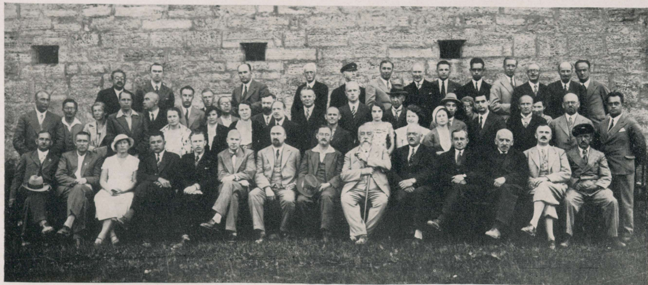
XII Eesti Arstidepäev Kuressaares 28. ja 29. juulil 1934.