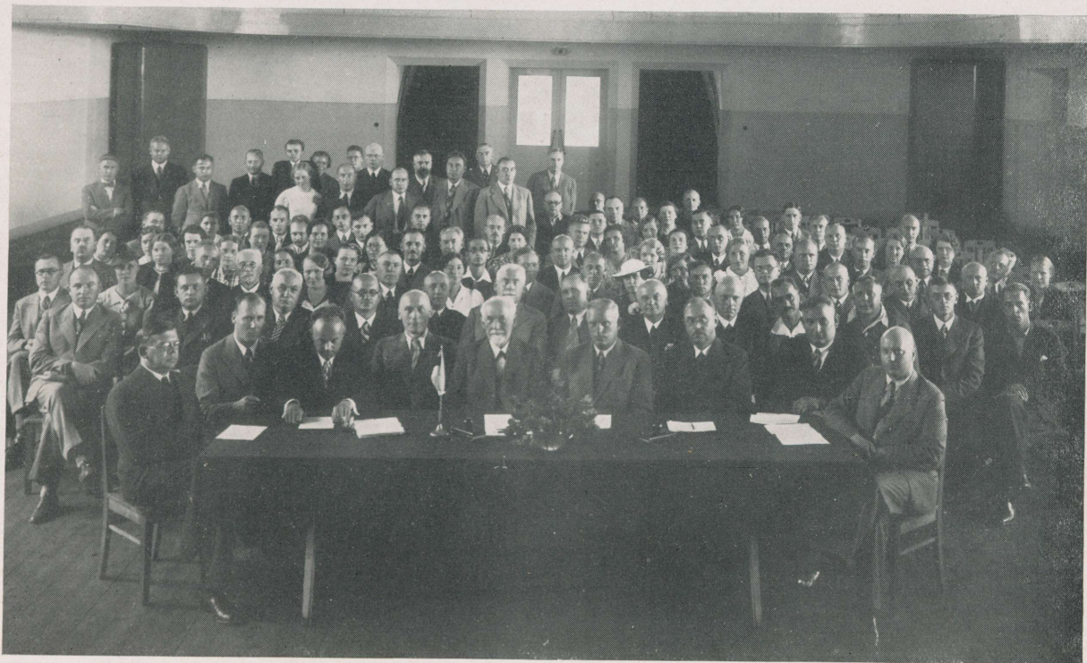
XV Eesti Arstidepäev Viljandis 21. ja 22. augustil 1937.