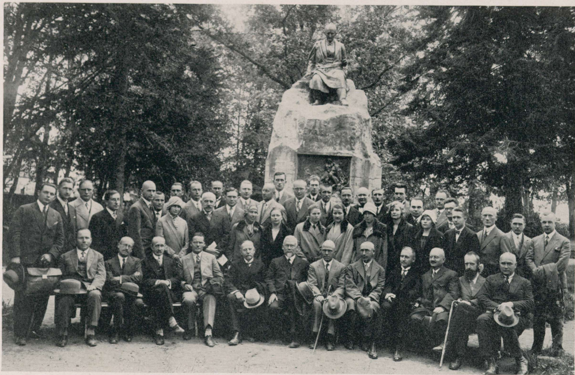
VIII Eesti Arstidepäev Võrus 31. augustil ja 1. septembril 1929.