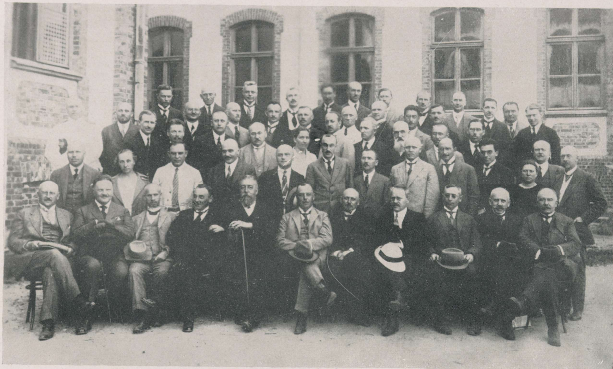
II Eesti Arstidepäev Pärnus 14. ja 15. juulil 1923.