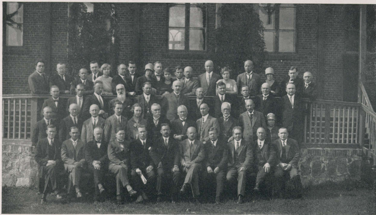
VI Eesti Arstidepäev Viljandis 27. ja 28. augustil 1927.