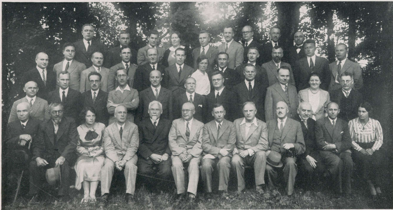
XIII Eesti Arstidepäev Rakveres 3. ja 4. augustil 1935.