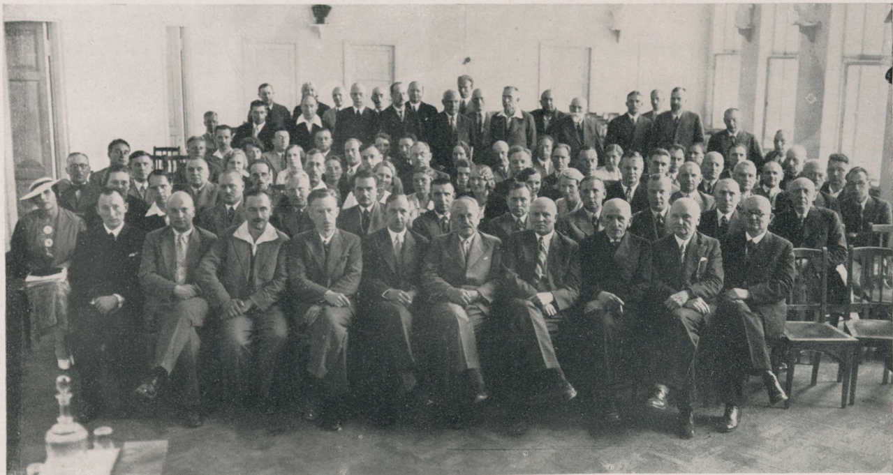
XIV Eesti Arstidepäev Haapsalus 15.—17. augustil 1936.