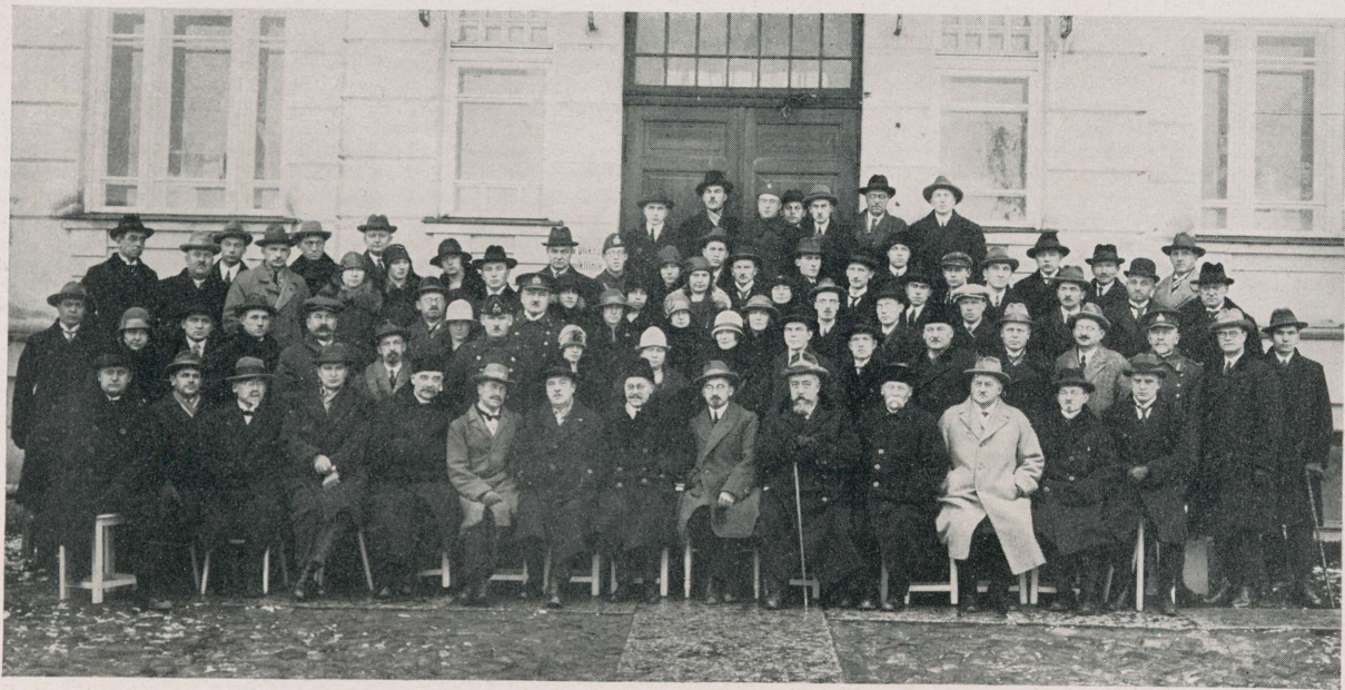
V Eesti Arstidepäev Tartus 27. ja 28. novembril 1926.